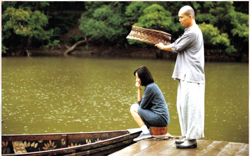
സ്‌പ്രിങ്ങ്, സമ്മർ, ഫാൾ, വിന്റർ... ആൻഡ് സ്‌പ്രിങ്ങ്

രുന്ന ഒരു കൂട്ടം ഗ്രാമീണരുടെ പലായനവേളയിൽ അവർ അനുഭവിക്കേണ്ടിവരുന്ന ജീവനരണപോരാട്ടങ്ങളുടെ കഥയാണ് സൗണ്ട് ഓഫ് സാൻഡ് . അകൂട്ടത്തിൽ അൽപ്പം വിദ്യാഭ്യാസമുള്ള റെനെയും കുടുംബവുമുണ്ട്. ഭാര്യ മോനയും മൂന്നു കുട്ടികളുമാണയാൾക്ക്. ഇളയപെൺകുട്ടി