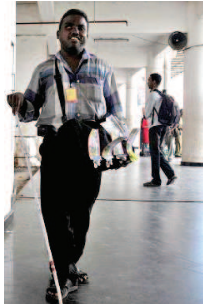
നങ്ങൾ വഴിയും നിരവധി പദ്ധതികളും പരിപാടികളും സർക്കാർ ആവിഷ്കരിച്ച് നടപ്പാക്കിവരുന്നു. ■

അംഗപരിമിതരെ സമൂഹത്തിന്റെ പൊതു ധാരയിൽ എത്തിക്കുന്നതിനായി, മറ്റ് സർക്കാർ വകുപ്പുകൾ വഴിയും വികലാംഗ ക്ഷേമ കോർപ്പറേഷൻ സംസ്ഥാന വികലാംഗ കമ്മീഷണറേറ്റ് തുടങ്ങിയ സംവിധാ