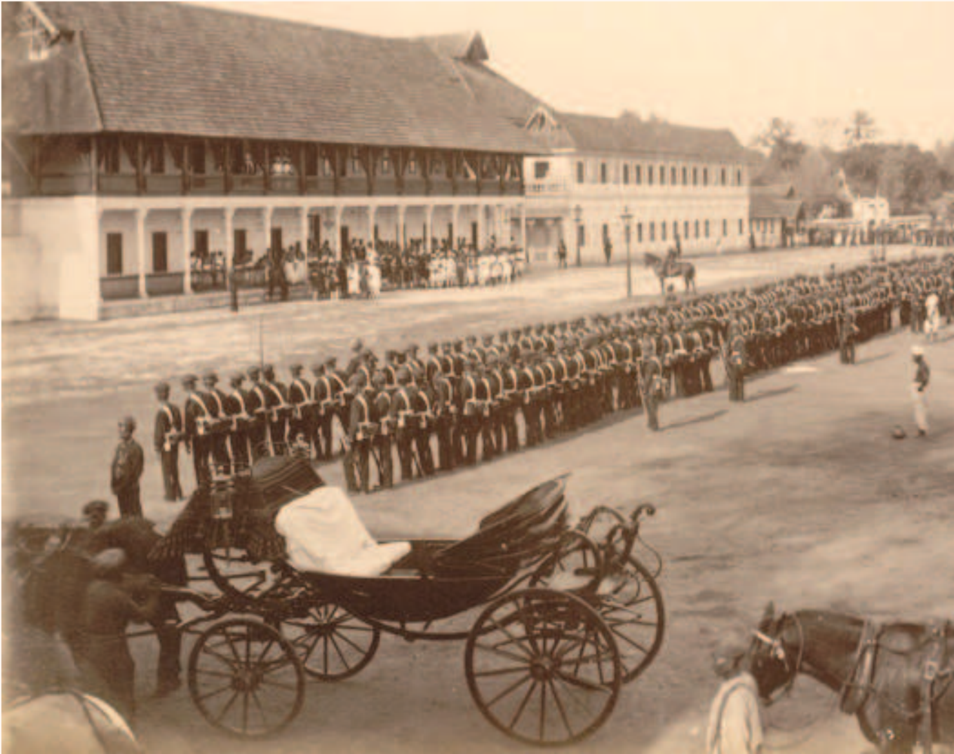
തിരുവിതാംകൂർ മഹാരാജാവിന്റെ ദർബാർ (1900)

തിരുവിതാംകൂർ സർവീസിൽ വിദേശ ബ്രാഹ്മണർക്ക് വർധിച്ച പ്രാധാന്യം നൽകുന്നതിൽ പ്രതിഷേധിച്ചും നാട്ടുകാർക്ക് വേണ്ടത്ര പ്രാധാന്യം ലഭിക്കണമെന്ന് ആവശ്യപ്പെട്ടും ശ്രീമൂലം തിരുനാൾ മഹാരാജാവിന് 1891 ജനുവരി ഒന്നിന് നാട്ടുകാർ സമർപ്പിച്ച ഭീമഹർജിയാണ്, 'തിരുവിതാംകൂർ മെമ്മോറിയൽ' അഥവാ 'മലയാളി മെമ്മോറിയൽ'. 'വിവിധ മതവർഗ്ഗ വ്യാപാരസ്ഥരായ പ്രധാനികളും വിദഗ്ദ്ധന്മാരും കാര്യസ്ഥരും' ആയ 10,078 പേർ ഒപ്പിട്ട ഈ നിർവേദനത്തിലെ ഒന്നാം പേരുകാരൻ, അന്ന് മദ്രാസ് ഹൈക്കോടതി വക്കീലായിരുന്ന കെ.പി. ശങ്കരമേനോൻ ആണ്. പ്രസിദ്ധ നോവലി