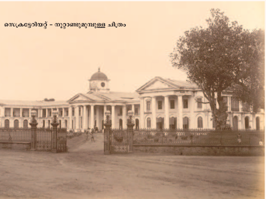
സെക്രട്ടേറിയറ്റ് - നൂറ്റാണ്ടുമുമ്പുള്ള ചിത്രം

തുടക്കത്തിൽ പറഞ്ഞതുപോലെ, ആധുനിക രാഷ്ട്രീയ പ്രക്ഷോഭണചരിത്രം തുടങ്ങുന്നത് മലയാളി മെമ്മോറിയലിൽ നിന്നാണ്. 1920 ൽ പോലും ഇന്ത്യൻ നാഷണൽ കോൺഗ്രസിന് ഉത്തരവാദിഭരണം ലക്ഷ്യമായിരുന്നില്ലെന്നറിയുമ്പോഴാണ് മലയാളി മെമ്മോറിയലിന്റെ പിന്നിലുള്ള ഉദ്ദേശ്യശുദ്ധിയും ദീർഘവീക്ഷണവും കൂടുതൽ വ്യക്തമാകുന്നത്. മെമ്മോറിയൽ സമർപ്പണം കൊണ്ട് ഏതാനും ഉദ്യോഗങ്ങൾ നാട്ടുകാർക്ക് ലഭിച്ചു എന്നതിനപ്പുറം ജനങ്ങളുടെ പ്രാർഥനയ്ക്കനുസരിച്ച് അത് വിജയകരമായില്ലെങ്കിലും ദേശസ്നേഹം വളർത്താനും 40 വർഷം കഴിഞ്ഞുണ്ടായ നിവർത്തന പ്രസ്ഥാനത്തിനും മറ്റും വിത്തുപാകാനും മലയാളി മെമ്മോറിയലിനു കഴിഞ്ഞുവെന്നത് വാസ്തവമാണ്. ■