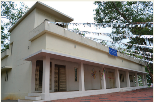
കോന്നി ഭക്ഷ്യ ഗവേഷണ-വികസന കേന്ദ്രം