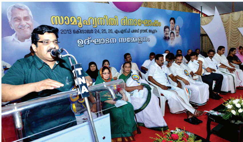
സാമൂഹികനീതി ദിനാഘോഷം മന്ത്രി എം.കെ. മുനീർ ഉദ്ഘാടനം ചെയ്യുന്നു

സർക്കാർ വകുപ്പുകളുടെ സേവനങ്ങളും ജനോപകാരപ്രദമായ പദ്ധതികളുടെ വിവരണവും ജനങ്ങൾക്ക് പകർന്ന നൽകിയ വിവിധ സർക്കാർ വകുപ്പുകളുടെ പ്രദർശന സ്റ്റാളുകൾ ജനശ്രദ്ധ പിടിച്ചുപറ്റി. മലപ്പുറം,