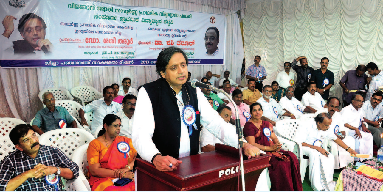
കേന്ദ്രമന്ത്രി ഡോ. ശശിതരൂർ കാസർകോടിനെ സമ്പൂർണ്ണ വിജ്ഞാൻ ജ്യോതി ജില്ലയായി പ്രഖ്യാപിക്കുന്നു

നെല്ലിക്കുന്ന് എം.എൽ.എ. ഉദ്ഘാടനം ചെയ്തു. വിജ്ഞാൻ ജ്യോതി പ്രഖ്യാപന വേദി അവാർഡുകളുടേയും ആദരവുകളുടേയും പെരുമഴയായി. ഏറ്റവും കൂടുതൽ പഠിതാക്കളെ വിജയിപ്പിച്ച സ്കൂൾക്ക് പഞ്ചായത്തിനുള്ള അവാർഡ് കാറഡുക്ക സ്കൂൾക്ക് പഞ്ചായത്ത് നേടി. മഞ്ചേശ്വരം സ്കൂൾക്ക് പഞ്ചായത്ത്