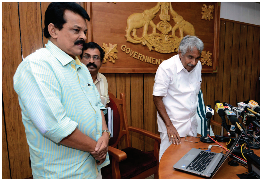
നിക്ഷേപക സംഗമം വെബ്സൈറ്റ് മുഖ്യമന്ത്രി ഉമ്മൻ ചാണ്ടി ഉദ്ഘാടനം ചെയ്യുന്നു

കേരളത്തിന്റെ നഗരവികസന രംഗത്ത് പുത്തൻ ഉണർവു പകരാൻ ഈ നിക്ഷേപക സംഗമത്തിന് കഴിയും. സാമ്പത്തിക വൈഷമ്യങ്ങൾ കാരണം അടിസ്ഥാന വികസനങ്ങൾക്ക് പണം കണ്ടെത്താൻ കഴിയാതെ വരുന്ന നഗരസഭകൾക്ക് ആശ്വാസവും. ■