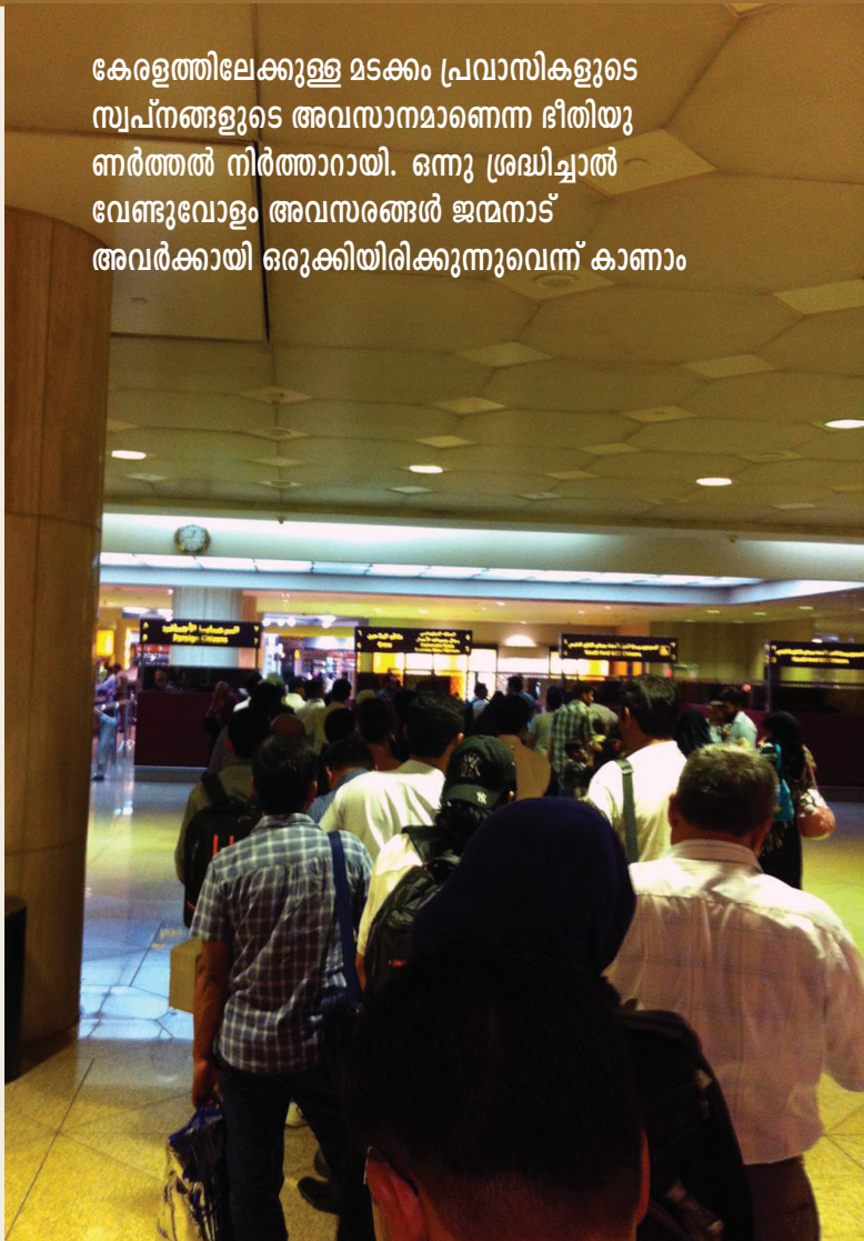
കേരളത്തിലേക്കുള്ള മടക്കം പ്രവാസികളുടെ സ്വപ്നങ്ങളുടെ അവസാനമാണെന്ന ഭീതിയുണർത്തൽ നിർത്താനായി. ഒന്നു ശ്രമിച്ചാൽ വേണ്ടുവോളം അവസരങ്ങൾ ജന്മനാട് അവർക്കായി ഒരുക്കിയിരിക്കുന്നുവെന്ന് കാണാം

സാങ്കേതിക വിദഗ്ദ്ധരെയല്ല നൈപുണ്യം നേടിയ തൊഴിലാളികളെയാണ് ഇന്ന് കേരളത്തിന് ആവശ്യമുള്ളത്. വിദ്യാഭ്യാസ യോഗ്യത വിഷയമേ അല്ല. ഇലക്ട്രീഷ്യൻ, പ്ലംബർ, മെയ്സൻ, പെയിന്റർ, കാർപെന്റർ, എ.സി. മെക്കാനിക്, ലിഫ്റ്റ് ടെക്നീഷ്യൻ, അലൂമിനിയം ഫാബ്രിക്കേഷൻ വർക്കർ, വെൽഡർ, ഗ്രൈന്റർ, ആട്ടോമൊബൈൽ റിപ്പയർ, ടയർ ചെയ്ഞ്ചർ, പഞ്ചർ വർക്കർ, ടൈലർ, ഹെയർ കട്ടർ, ഡ്രൈവർ, ബ്യൂട്ടീഷ്യൻ, ഡി.ടി.പി. ഓപ്പറേറ്റർ, പ്രിന്റർ തുടങ്ങി എത്രയോ മേഖലകളിൽ പരിജ്ഞാനമുള്ളവരെ കിട്ടാതെ കേരളം കഷ്ടപ്പെടുകയാണ്. അതോടൊപ്പം യാതൊരു പരിജ്ഞാനവും ആവശ്യമില്ലാത്ത 'ലേബർ' എന്ന നിലയിൽ എത്രയോ പേരെ ആവശ്യമുണ്ട്. ഹൗസ് കീപ്പിങ്, വിൻഡോ ക്ലീനിംഗ്, ക്ലീനിങ്, നിർമ്മാണ തൊഴിലാളികൾ, പാർക്കിങ്, കാരിയർ, സപ്ലയർ, കൃഷിപ്പണിക്കാർ എന്നീ മേഖലകളിലും വൻതോതിൽ ആളു