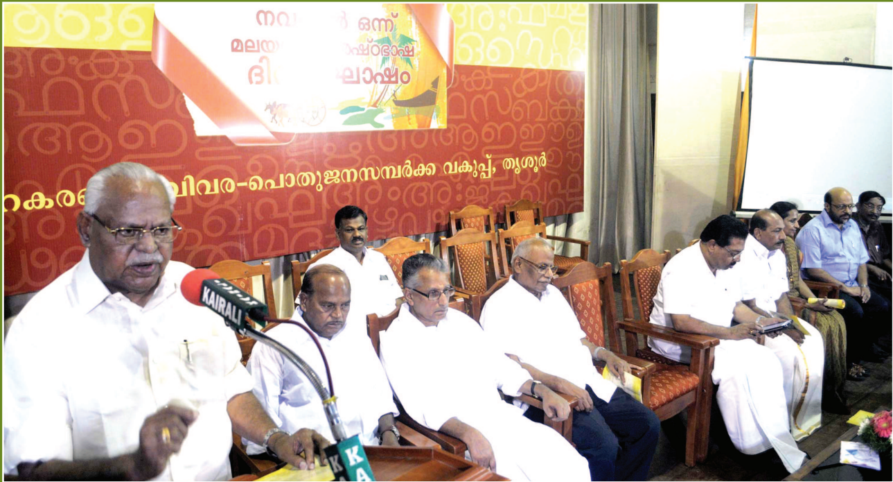
തൃശൂരിൽ മലയാളം ശ്രേഷ്ഠഭാഷാ ദിനാഘോഷം സഹകരണമന്ത്രി സി.എൻ. ബാലകൃഷ്ണൻ ഉദ്ഘാടനം ചെയ്യുന്നു