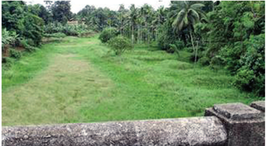
തിരുവല്ല കുറ്റൂർ എം.സി. റോഡിൽ ആറാട്ടുകടവ് പാലത്തിൽ നിന്നുള്ള വരട്ടാറിന്റെ ദൃശ്യം