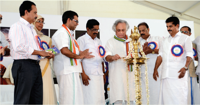
ഭൂരഹിതരില്ലാത്ത ജില്ല പ്രഖ്യാപനം കേന്ദ്രമന്ത്രി ജയറാം രമേശ് നിർവഹിക്കുന്നു

ഒരു തുണ്ട് ഭൂമിക്ക് എങ്കിലും അവകാശമില്ലാത്തവരായി കണ്ണൂർ ജില്ലയിൽ ഇനി ആരുമില്ല. തല ചായ്ക്കാൻ സ്വന്തമായി ഒരു തുണ്ട് ഭൂമിയെന്ന പതിനായിരങ്ങളുടെ സ്വപ്നം യാഥാർത്ഥ്യമായി. ഇതു വരെ സ്വന്തമായി ഭൂമിയില്ലാത്തവരായി കഴിഞ്ഞിരുന്ന ജില്ലയിലെ 11,106 കുടുംബങ്ങളാണ് ഭൂമിക്ക് ഉടമകളായി മാറിയത്. 73 പട്ടിക വർഗ കുടുംബങ്ങൾക്ക് ഒരു ഏക്കർ വീതവും ബാക്കിയുള്ളവർക്ക് മൂന്ന് സെന്റ് വീതവും ലഭിച്ചു. മുഴുവൻ ഭൂരഹിതർക്കും പട്ടയം എന്ന സുവർണ്ണ നേട്ടം കൈവരിച്ച് കണ്ണൂർ രാജ്യത്തെ ആദ്യ ഭൂരഹിതരില്ലാത്ത ജില്ലയെന്ന ബഹുമതിക്കർഹമായി. കേരളപ്പിറവി ദിനത്തിൽ കണ്ണൂർ മുനിസിപ്പൽ സ്റ്റേഡിയത്തിൽ ജനസാഗരത്തെ സാക്ഷിയാക്കി കേന്ദ്ര ഗ്രാമവികസന മന്ത്രി ജയറാം രമേശ് കണ്ണൂരിനെ ഭൂരഹിതരില്ലാത്ത ജില്ലയായി പ്രഖ്യാപിച്ചു.