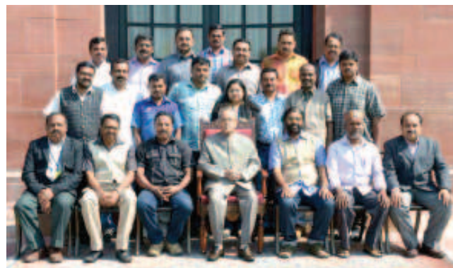
ആലപ്പുഴയിലെ മാധ്യമസംഘം രാഷ്ട്രപതിക്കൊപ്പം

പി.ആർ.ഡി ന്യൂഡൽഹി ഡെപ്യൂട്ടി ഡയറക്ടർ പി.ആർ. റോയി, ഇൻഫർമേഷൻ ഓഫീസർ ഡോ.