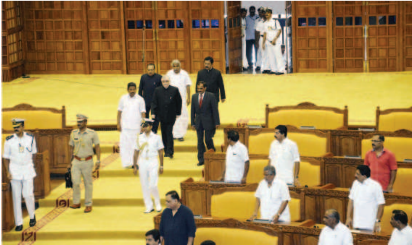
നയപ്രഖ്യാപനത്തിനായി ഗവർണ്ണർ പി.സദാശിവം നിയമസഭയിലെത്തുന്നു

യുള്ള 13 അവശ്യസാധനങ്ങൾ പൊതുവിപണിയിലെ വിലയേക്കാൾ 20-35 ശതമാനം വരെ കുറഞ്ഞ വിലയ്ക്ക് എന്റെ സർക്കാർ വിൽപന നടത്തിവരുന്നു. തിരുവനന്തപുരത്തും കോട്ടയത്തും തലശ്ശേരിയിലും ഹൈപ്പർ മാർക്കറ്റുകൾ ഉദ്ഘാടനം ചെയ്യപ്പെട്ടിട്ടുണ്ട്. കേരള സ്റ്റേറ്റ് സിവിൽ സപ്ലൈസ് കോർപ്പറേഷൻ ഏകദേശം നാലു ലക്ഷം കർഷകരിൽ നിന്നും 15 ലക്ഷത്തോളം മെട്രിക് ടൺ നെല്ല് സംഭരിക്കുകയും 2500 കോടി രൂപ നൽകുകയും ചെയ്തത് എന്റെ സർക്കാരിന്റെ ഒരു അപൂർവ നേട്ടമാണ്.