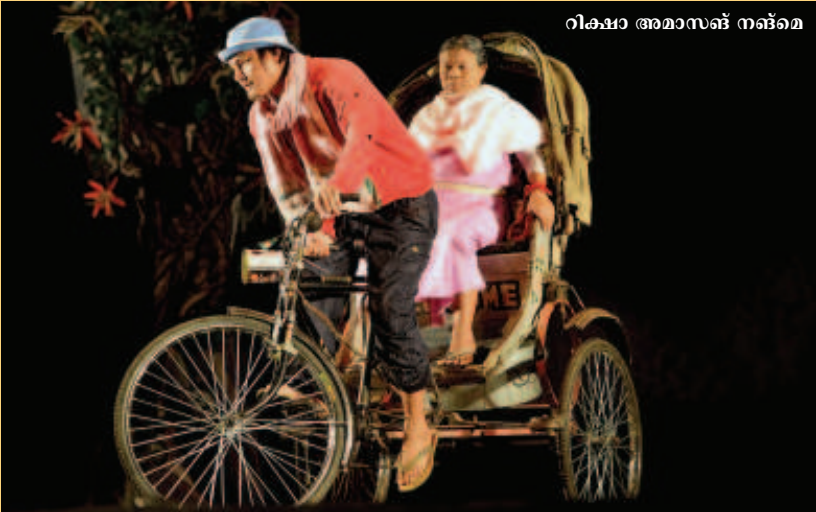
റിക്ക്ഷ അമാസങ്ങ് നങ്ങ്മെ

സാമൂഹ്യ സമരകാലത്ത് കൽക്കത്തയായിരുന്നു ഇന്ത്യൻ തിയേറ്റർ പ്രസ്ഥാനത്തിന്റെ ആസ്ഥാനം. പ്രൊസീലിയർ തിയേറ്റർ എന്ന ആ പ്രസ്ഥാനം ഇന്നില്ല. പകരം സമകാലിക നാടക പ്രസ്ഥാനങ്ങൾ നിരവധി പരിവർത്തനങ്ങളോടെ രൂപമെടുത്തു. പ്രൊസീലിയർ ശൈലി മാറിയിട്ട് പുതിയ വേദികൾ തേടുന്ന നാടകവേദി തന്നെ രൂപമെടുത്തു. അവയുടെ വൊക്കാബുലറി വ്യത്യസ്തമാണ്. ഇഡിയം വ്യത്യസ്തമാണ്. ഭാഷ വ്യത്യസ്തമാണ്. അൽക്കാസി പോലെയുള്ളവരുടെ അർദ്ധതപ്പെടുത്തുന്ന