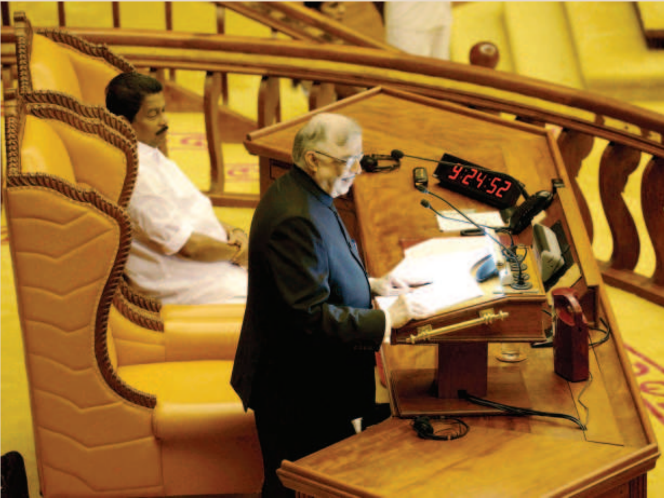
ഗവർണ്ണർ പി.സദാശിവം നയപ്രഖ്യാപന പ്രസംഗം നടത്തുന്നു