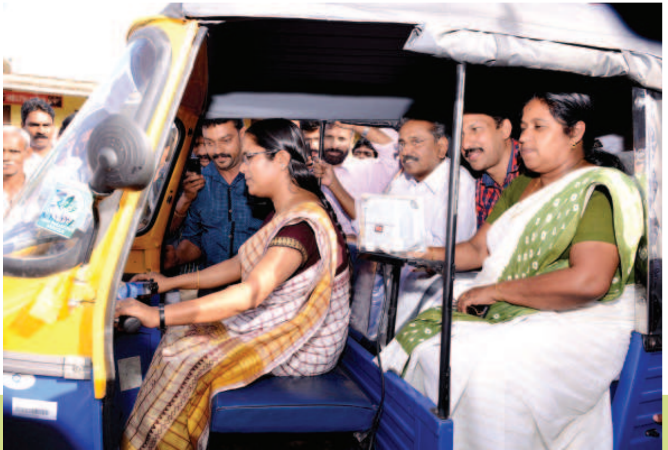
വനിതകൾക്കുള്ള സ്വയംസഹായകേന്ദ്ര പരിപാടിയിൽ ഓട്ടോറിക്ഷ വിതരണം ചെയ്ത വേളയിൽ

ഈ മേഖലയിൽ നിന്നുള്ളവരെ മുഖ്യധാരയിലെത്തിക്കാൻ വിദ്യാഭ്യാസത്തിലൂടെയേ കഴിയൂവെന്ന ബോധ്യമുണ്ട്. 40 ശതമാനത്തോളം ആദിവാസി വിഭാഗക്കാരും വനമേഖലയിലാണുള്ളത്. ഇടമലക്കുടിപോലുള്ള പ്രദേശങ്ങളിൽ നിന്നുള്ളവർക്ക് നിബിഢവനത്തിലൂടെ 42 കിലോമീറ്ററോളം താണ്ടിയേ പുറം ലോകത്തെത്താനാകൂ. ഇത്തരത്തിൽ വിദ്യാഭ്യാസ സൗകര്യം സുഗമമല്ലാത്ത സാഹചര്യം പരിഹരിക്കുന്നതിനാണ് ഗോത്രസാരഥി പദ്ധതി തുടങ്ങിയത്. വാഹന സൗകര്യമില്ലാത്ത മേഖലയിൽ