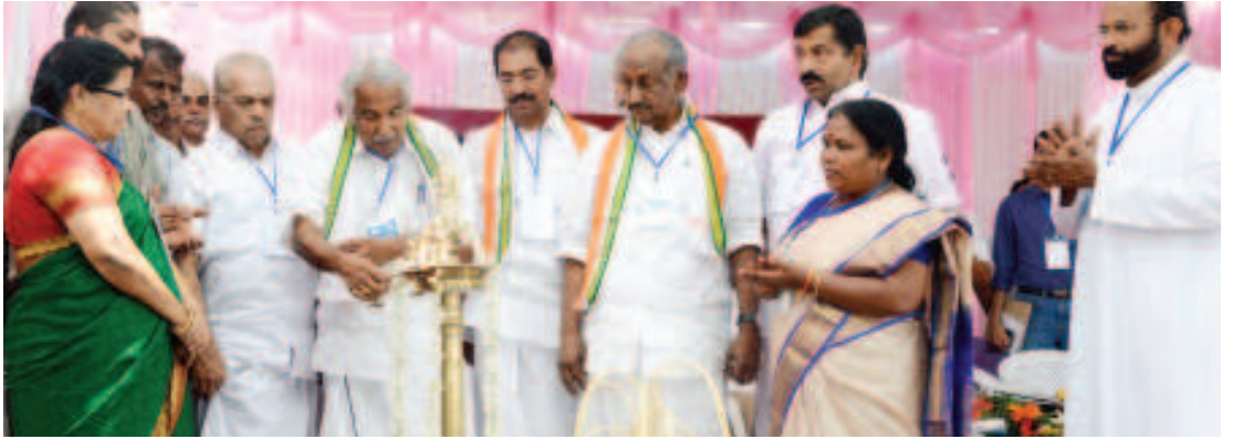
ക്ഷീരകർഷക സംഗമം മുഖ്യമന്ത്രി ഉമ്മൻ ചാണ്ടി ഉദ്ഘാടനം ചെയ്യുന്നു

കിണ്ണൂർ ജില്ലയിൽ കർണാടകയുമായി അതിർത്തി പങ്കിടുന്ന മലയോര ഗ്രാമമായ മണിക്കടവിന്റെ മനസ്സു നിറച്ചാണ് സംസ്ഥാന ക്ഷീരകർഷക സംഗമം അരങ്ങേറിയത്.