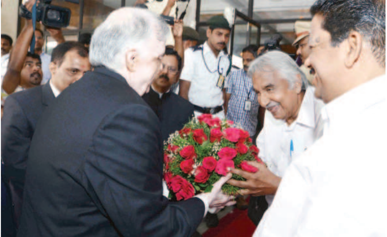
ഗവർണറെ മുഖ്യമന്ത്രി ഉമ്മൻചാണ്ടി സ്വീകരിക്കുന്നു

38. എന്റെ സർക്കാർ, പൊലീസ് സയൻസിനും ആഭ്യന്തര സുരക്ഷയ്ക്കും വേണ്ടിയുള്ള ദേശീയ സർവകലാശാല ഈ വർഷം സ്ഥാപിക്കുവാനുദ്ദേശിക്കുന്നു തീരദേശ സുരക്ഷയ്ക്കായി ഒരു ആൾ വിമെൻ ഇന്ത്യാ റിസർവ് ബറ്റാലിയനും ഒരു ഇന്ത്യാ റിസർവ് ബറ്റാലിയനും രൂപീകരിക്കുന്നതിന് എന്റെ സർക്കാർ ഉദ്ദേശിക്കുന്നു. കഴിഞ്ഞ വർഷം കേരള ഫയർ ആൻഡ് റെസ്ക്യൂ സർവീസസ് വകുപ്പ് വിവിധ ഫയർ ആൻഡ് റെസ്ക്യൂ പ്രവർത്തനങ്ങളിലൂടെ 8477 മനുഷ്യരുടെയും 5347 മൃഗങ്ങളുടെയും ജീവൻ രക്ഷിക്കുകയുണ്ടായി. പ്രസ്തുത പ്രവർത്തനങ്ങൾ മുഖേന ഏകദേശം 8508.67 കോടി രൂപ വിലമതിക്കുന്ന വസ്തുവകകൾ സംരക്ഷിക്കുകയുണ്ടായി.