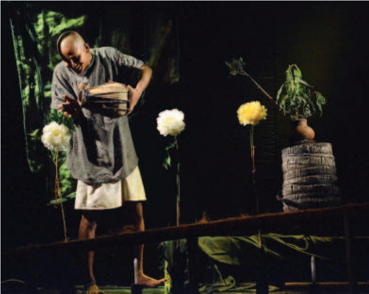
മൊമെന്റ് ജസ്റ്റ് ബിഫോർ ഡത്ത് എന്ന നാടകത്തിൽ നിന്ന്