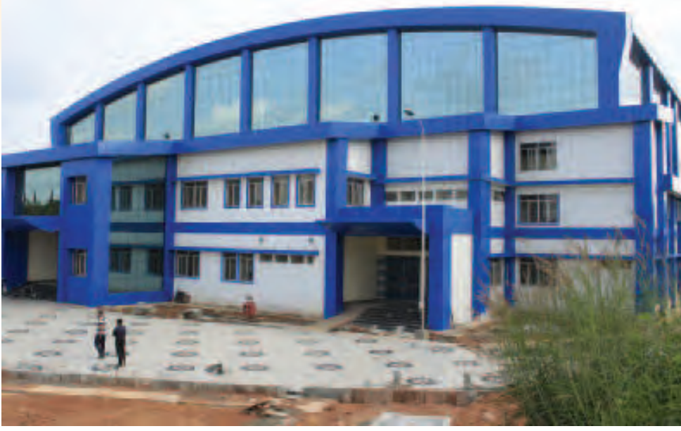
ഇൻഡോർ സ്റ്റേഡിയം കണ്ണൂർ

കണ്ണൂർ മുണ്ടയാട്ടെ ഇൻഡോർ സ്റ്റേഡിയമാണ് മറ്റൊരാകർഷണം. ഗുസ്തി, ബാസ്കറ്റ്ബോൾ മത്സരങ്ങൾക്ക് വേദിയായുന്ന ഈ സ്റ്റേഡിയം മലബാർ ജനതയുടെ കായികപ്രതീക്ഷകൾക്ക് ഒരു മുതൽക്കൂട്ടാവും. ഫുട്ബോൾ മത്സരങ്ങൾ അരങ്ങേ