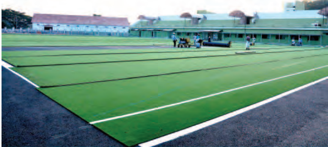
ഹോക്കി സ്റ്റേഡിയം കൊല്ലം

87 ലെ ഗെയിംസിൽ പങ്കെടുത്തത് 4307 താരങ്ങളായിരുന്നു. ഇത്തവണ താരങ്ങളും ഒഫീഷ്യലുകളുമായി 12,000 പേർ എത്തും