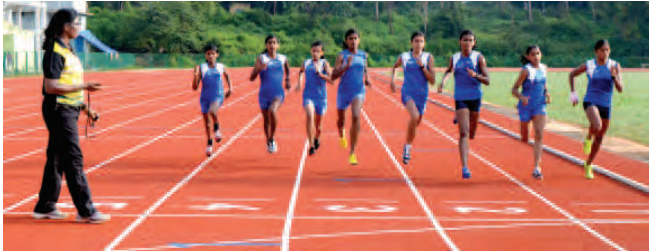
കായിക താരങ്ങളെ പരിശീലിപ്പിക്കുന്ന ഉഷ

എന്നാൽ പലവട്ടം ശുകുനപ്പിഴ കാണിച്ച തിരുവനന്തപുരം വീണ്ടും ചതിച്ചു. യൂണിവേഴ്സിറ്റി സ്റ്റേഡിയത്തിലെ മോണ്ടോ ട്രാക്കിൽ 400 മീറ്റർ ഹർഡ്ൽസിൽ പരിശീലനത്തിനിടെ കണകാലിന് പരിക്ക്. നിരാശയുടെയും സങ്കടത്തിന്റെയും ദിനങ്ങൾ. കാലിന് നീരുവെച്ചു. എങ്കിലും മറ്റ് താരങ്ങളുടെ പ്രകടനങ്ങളെ പ്രോത്സാഹിപ്പിക്കാൻ ഗെയിംസ് കഴിയുംവരെ തിരുവനന്തപുരത്തുതന്നെയുണ്ടായിരുന്നു. ഉദ്ഘാടന ചടങ്ങിൽ പതാകയേന്തിയതും മറ്റൊരുമായിരുന്നില്ല. 400 മീറ്റർ, 400 മീറ്റർ ഹർഡ്ൽസ്, 100, 200, 4100, 4400 മീറ്റർ റിലെ എന്നീ ഇനങ്ങളിൽ ഉറച്ച സ്വർണമാണ് അന്ന് കേരളത്തിന് നഷ്ടമായത്. പിന്നീട്