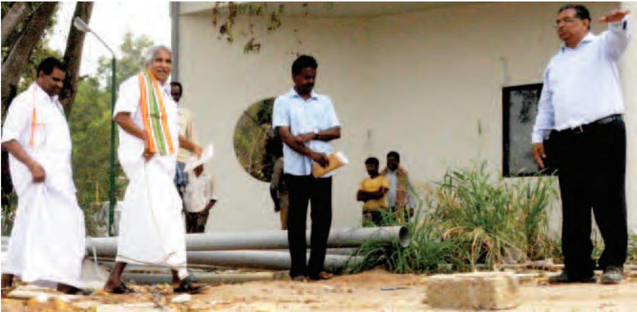
ഗെയിംസിന്റെ മുൻനോറുകൾ പരിശോധിക്കുന്ന മുഖ്യമന്ത്രിയും കായികമന്ത്രിയും

സാമ്പത്തിക സ്ഥിതി അത്ര ആശാവഹമല്ലാതിരുന്നിട്ടും 611 കോടിവരുന്ന വലിയ തുകയാണ് നാം ഗെയിംസിനായി മുടക്കുന്നത്. ഇത് എന്തെ സംബന്ധിച്ചിടത്തോളം ഗെയിംസിനായി മാത്രം ചെലവാക്കുന്നതല്ല, വലിയ കുതിപ്പിനായി തയ്യാറെടുക്കുന്ന കേരള സ്പോർട്സിന്റെ ഭാവിക്കുകൂടി പ്രയോജനപ്പെടുന്നതാണ്. പി.ടി ഉഷ, ഷൈനി വിത്സൺ, എം.ഡി വത്സമ്മ, കെ.എം. ബീനമോൾ, അഞ്ജു ബോബി ജോർജ്ജ്, ഐ.എം. വിജയൻ, ജിമ്മി ജോർജ്ജ് തുടങ്ങി നിരവധി കായികേതിഹാസങ്ങൾക്ക് ജന്മം നൽകിയ കേരളത്തിന്റെ കായികരംഗം മുരടിപ്പിലായതിന് കാരണം നമ്മുടെ കൂട്ടികളിലുറങ്ങുന്ന അപരിമേയമായ പ്രതിഭയെ ചൂഷണം ചെയ്യുന്നതിലും അവരെ ലോകനിലവാരത്തിലെത്തിക്കുന്നതിന് അവശ്യമായ കായികരംഗത്തെ അടിസ്ഥാനസൗകര്യം