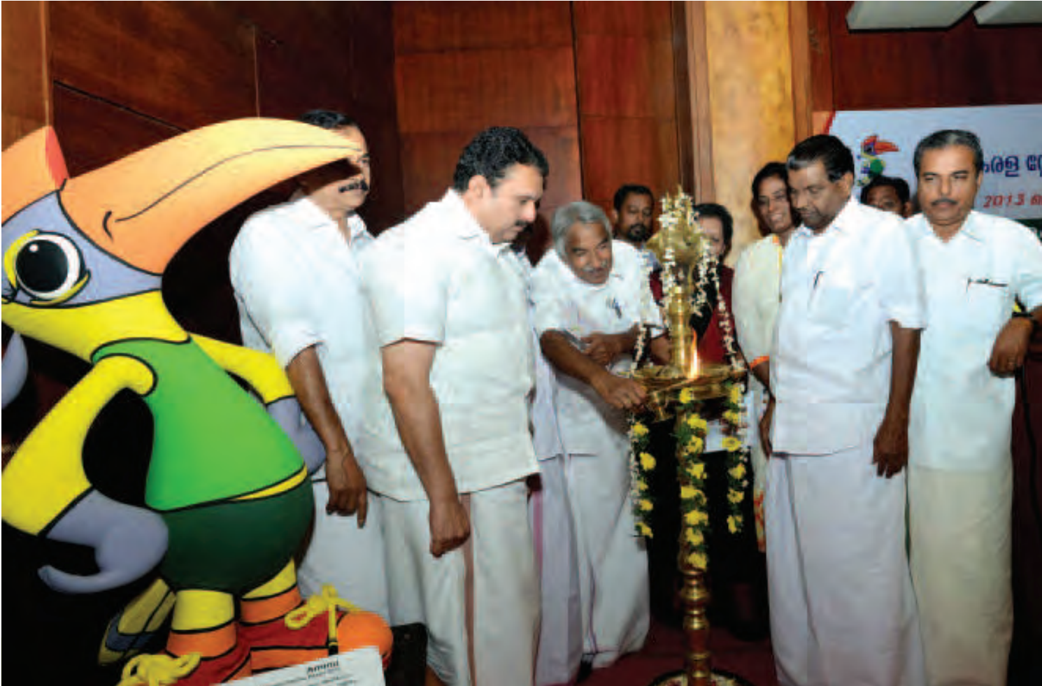
2013-ലെ മികച്ച കായികതാരങ്ങൾക്കുള്ള ജി.വി. രാജ പുരസ്കാര വിതരണോദ്ഘാടനം മുഖ്യമന്ത്രി നിർവഹിക്കുന്നു

ഗെയിംസിന്റെ തുടർച്ചയെന്നോണം വിവിധ ജില്ലകളിലായി നാല് ഗ്രീൻഫീൽഡ് സ്റ്റേഡിയങ്ങൾ കൂടി നിർമ്മിക്കുന്നുണ്ട്. സെൻട്രൽ സ്റ്റേഡിയം തിരുവനന്തപുരം, ഗ്രീൻഫീൽഡ് സ്റ്റേഡിയം, വട്ടിയൂർക്കാവ്, ഗ്രീൻഫീൽഡ് സ്റ്റേഡിയം ചേവായൂർ, കോഴിക്കോട്, നെഹ്രു സ്റ്റേഡിയം കോട്ടയം എന്നിവയാണ് അവ. ഗെയിംസിനു ശേഷവും സ്മരണയുയർത്തി നിലകൊള്ളാൻപോകുന്ന ഈ കളിയിടങ്ങൾ കായികലോകത്തിന് ഒരു മുതൽക്കൂട്ടായി എന്നും നിലനിൽക്കും. ■