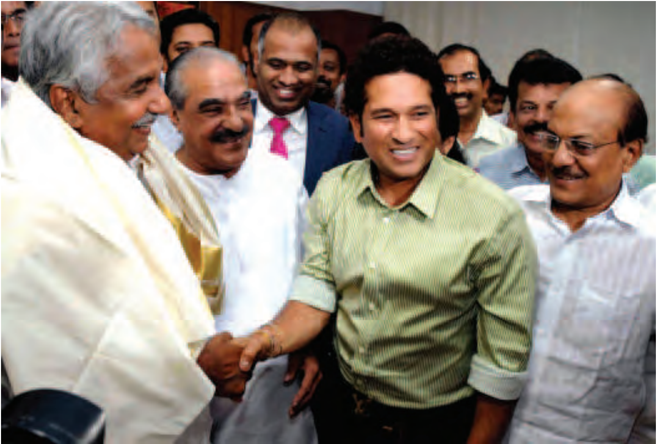
മുഖ്യമന്ത്രിക്കൊപ്പം ഗെയിംസിന്റെ ഗൂഡ്‌വിൽ അംബാസിഡറായ സച്ചിൻ ടെണ്ടുൽക്കർ

ക താരങ്ങൾക്കുള്ള വിശ്രമമുറിയായും കായിക ഉപകരണങ്ങൾ സൂക്ഷിച്ചുവെക്കുന്നതിനും, കായികക്ഷമത കേന്ദ്രങ്ങൾ തുടങ്ങിയവക്കായും നൽകുന്നതാണ്.