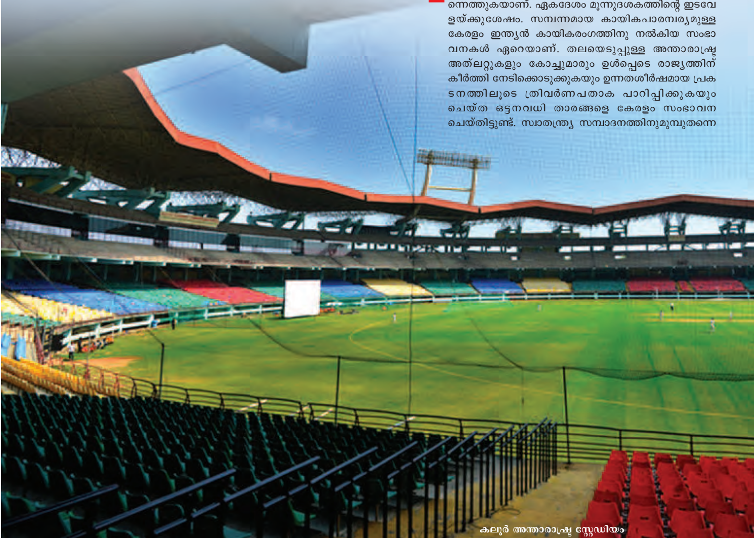
കലൂർ അന്താരാഷ്ട്ര സ്റ്റേഡിയം

മ ലയാളമണ്ണിലേക്ക് ഒരിക്കൽക്കൂടി ഇന്ത്യയിലെ ഏറ്റവും വലിയ കായികോത്സവമായ ദേശീയ ഗെയിംസ് വിരുന്നെത്തുകയാണ്. ഏകദേശം മൂന്നുദശകത്തിന്റെ ഇടവേളയ്ക്കുശേഷം സമ്പന്നമായ കായികപാരമ്പര്യമുള്ള കേരളം ഇന്ത്യൻ കായികരംഗത്തിനു നൽകിയ സംഭാവനകൾ ഏറെയാണ്. തലയെടുപ്പുള്ള അന്താരാഷ്ട്ര അത്ലറ്റുകളും കോച്ചുമാരും ഉൾപ്പെടെ രാജ്യത്തിന് കീർത്തി നേടിക്കൊടുക്കുകയും ഉന്നതശീർഷമായ പ്രകടനത്തിലൂടെ ത്രിവർണ പതാക പാറിപ്പിക്കുകയും ചെയ്ത ഒട്ടനവധി താരങ്ങളെ കേരളം സംഭാവന ചെയ്തിട്ടുണ്ട്. സാതന്ത്ര്യ സമ്പാദനത്തിനുവുമുന്തന്നെ