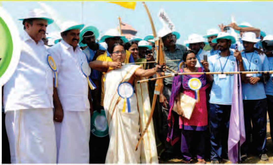
തലയ്ക്കൽ ചതു എവർറോളിങ്ങ് ട്രോഫി മത്സരം മന്ത്രി പി.കെ. ജയലക്ഷ്മി ഉദ്ഘാടനം ചെയ്യുന്നു

കെട്ടിടം വേണം. 90 മീറ്ററും 120 മീറ്ററും ദൈർഘ്യമുള്ള പരിശീലന മൈതാനം വേണം. പിന്നെ കായിക മന്ത്രാലയത്തിന്റെ ഒരു പ്രോത്സാഹനവും. ഏറ്റവും ഒടുവിൽ ആർച്ചറി അക്കാദമിയായി പുൽപ്പള്ളി പഞ്ചായത്ത് നൽകിയ എട്ട് ഏക്കർ സ്ഥലത്തിൽ രണ്ട് ഏക്കർ ഒഴികെയുള്ള സ്ഥലം തിരികെ വേണമെന്നാണ് അവരുടെ ആവശ്യം. ആകെയുള്ള പ്രതീക്ഷകൾ ലക്ഷ്യം തെറ്റുമോയെന്ന ആശങ്കകൾക്കിടയിൽ വഴി മാറിപ്പോകുന്നത് ഇന്ത്യൻ കായിക കരുത്തിന്റെ വരുംകാല സ്വപ്നങ്ങൾ കൂടിയ വാ. ഒപ്പം അസ്പ്രെവിദ്യയുടെ ഇന്ദ്രജാലങ്ങളും.