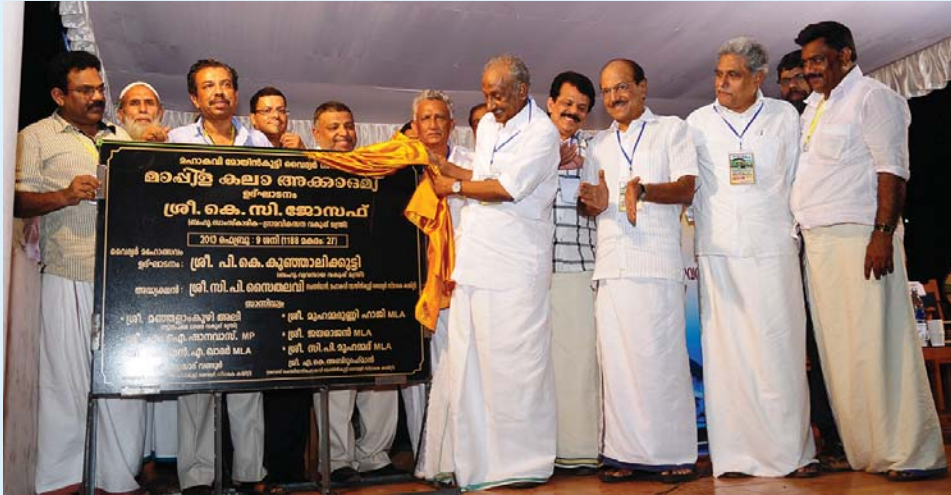
മഹാകവി മോയിൻകുട്ടി വൈദ്യർ സ്മാരക മാപ്പിളകലാ അക്കാദമി ഉദ്ഘാടനം സാംസ്കാരിക മന്ത്രി കെ.സി. ജോസഫ് നിർവഹിക്കുന്നു. മന്ത്രിമാരായ പി.കെ. കുഞ്ഞാലിക്കുട്ടി, മഞ്ഞളാംകുഴി അലി തുടങ്ങിയവർ സമീപം

പ്രദർശനവും വിൽപ്പനയും കൂടാതെ ജില്ലയിലെ വിവിധ വികസന പ്രവർത്തനങ്ങളുടെ ഉൾപ്പെടുത്തി ഫോട്ടോ പ്രദർശനവും ഒരുക്കിയിരുന്നു. 40 ശതമാനം വിലക്കിഴിവിയാണ് പുസ്തകങ്ങൾ നൽകിയത്. മാതൃഭൂമി ബുക്സും റാസ്മെറിയും അദർബുക്സും മേളയിലുണ്ടായിരുന്നു.