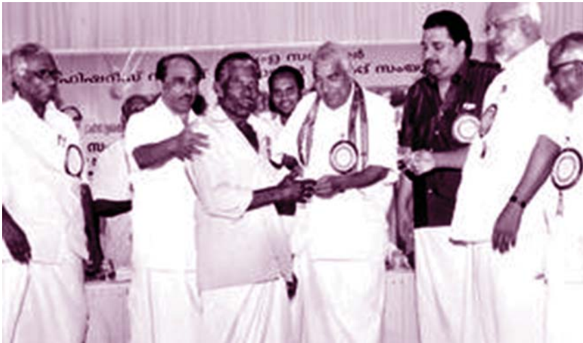
തണൽ പദ്ധതിയുടെ ഉദ്ഘാടനം കൊല്ലത്ത് മുഖ്യമന്ത്രി നിർവഹിക്കുന്നു

ബയോമെട്രിക് തിരിച്ചറിയൽ കാർഡിന് എൻറോൾ ചെയ്ത മത്സ്യത്തൊഴിലാളികൾക്കും അനുബന്ധ തൊഴിലാളികൾക്കും 1,350 രൂപ നിരക്കിൽ ധനസഹായം ലഭിക്കും. സർക്കാരിന്റെ ഈ ധനസഹായം മത്സ്യത്തൊഴിലാളികളുടെ കൈകളിൽ സുരക്ഷിതമായി എത്തുന്നുവെന്ന് ഉറപ്പുവരുത്തുവാൻ പദ്ധതി പ്രകാരമുള്ള തുക ബാങ്ക് അക്കൗണ്ടിലൂടെ മാത്രമാണ് വിതരണം ചെയ്യുക.