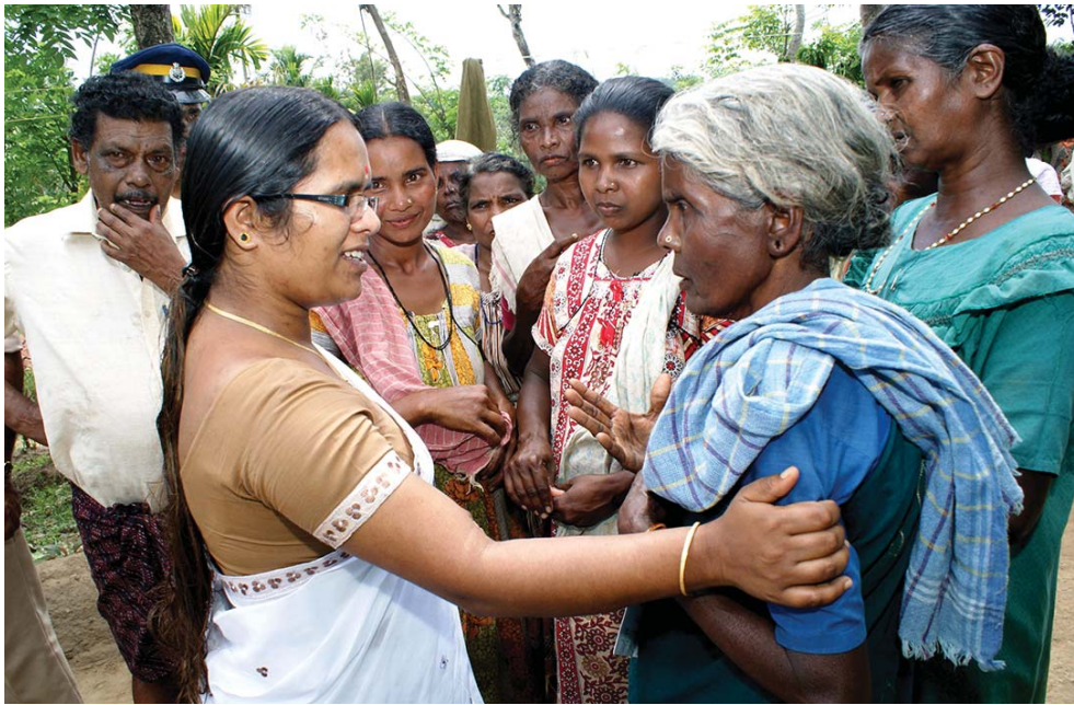
ഗോത്രജീവിതങ്ങൾക്ക് കൂടുതൽ കരുതൽ

വികസനവും കരുതലും എന്നതാണ് സർക്കാർ മുന്നോട്ടുവെക്കുന്ന മുദ്രാവാക്യം. കരുതലോടെയുള്ള വികസനവും കരുതൽ നൽകേണ്ട പല ജനവിഭാഗങ്ങളും ആവശ്യങ്ങളുമുള്ള ഒരു ജില്ലയാണ് വയനാട്. വയനാടിന്റെ സമഗ്രവികസനത്തിന് സർക്കാർ വലിയ പ്രാധാന്യമാണ് കൊടുക്കുന്നത്. ജില്ലയുടെ കാര്യത്തിൽ ഏറ്റവും കരുതൽ വേണ്ട മേഖലയാണ് കൃഷി. കാർഷികരംഗത്ത് അടുത്തിടെ പലപ്രതിസന്ധികളും രൂപംകൊണ്ടത് നമ്മൾ കണ്ടതാണ്. ഇത് മറികടക്കാൻ ഹ്രസ്വകാല അടിസ്ഥാനത്തിൽ നിരവധി നടപടികൾ സർക്കാർ ഇതിനകം സ്വീകരിച്ചുകഴിഞ്ഞു. എന്നാൽ ദീർഘകാല അടിസ്ഥാനത്തിലും നടപടികൾ വേണ്ടതുണ്ട്. അതിലൊരു നടപടിയായാണ് ഇവിടെ കാർഷിക യന്ത്ര