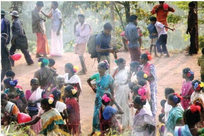
ചാമിയുട്ടിന്റെ വിവിധ ദൃശ്യങ്ങൾ

യുട്ടിലേക്ക് വിദേശികൾവരെ കാഴ്ചക്കാരായെത്തും. കരകന്യത്തവും തപ്പാംകൊട്ടും മകുടിയുത്തും നടത്താൻ പെൺവേഷം കെട്ടിയവർക്കൊപ്പം പ്രഗത്ഭരായ കലാകാരന്മാരും കലാകാരികളുമുണ്ടാകും.