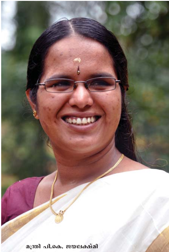
മന്ത്രി പി.കെ. ജയലക്ഷ്മി

ത്രിതല പഞ്ചായത്തിൽ ജനപ്രതിനിധിയായതിന്റെ മാത്രം അനുഭവത്തിൽനിന്നാണ് പ്രധാന ചുമതലകളുള്ള മന്ത്രിപദവി പി.കെ. ജയലക്ഷ്മി ഏറ്റെടുക്കുന്നത്. ഇന്ന് കേരളമറിയുന്ന ഭരണനേതൃത്വത്തിലെത്തിയപ്പോൾ ചുമതലകൾ വിശാലമായി. ആദിവാസികളുടെ ജീവിതപുരോഗതി മുതൽ യുവജനക്ഷേമം വരെ ലക്ഷ്യമിടുന്ന പ്രവർത്തനങ്ങൾ ചിട്ടയോടെ മുന്നേറുന്നു. തലക്കൽ ചന്തുസ്‌മാരകം തുടങ്ങി യാഥാർഥ്യമായത് നാടിന്റെ ദീർഘകാല ആവശ്യങ്ങൾ ഓരോന്നായിരുന്നു. സന്തം വകുപ്പുകൾക്കപ്പുറത്ത് വയനാടെന്ന പിന്നാക്ക ജില്ലയ്ക്ക് സമഗ്രവികസനമാണ് ലക്ഷ്യം. ആദിവാസികൾ ഏറ്റവും കൂടുതലുള്ള വയനാട്ടിൽ നിന്നും തുടങ്ങി സംസ്ഥാനത്തിന്റെ ഇതര കോണുകളിലേക്ക് നീളുന്ന വികസന ചിന്തയാണ് ഇതിനാധാരം.