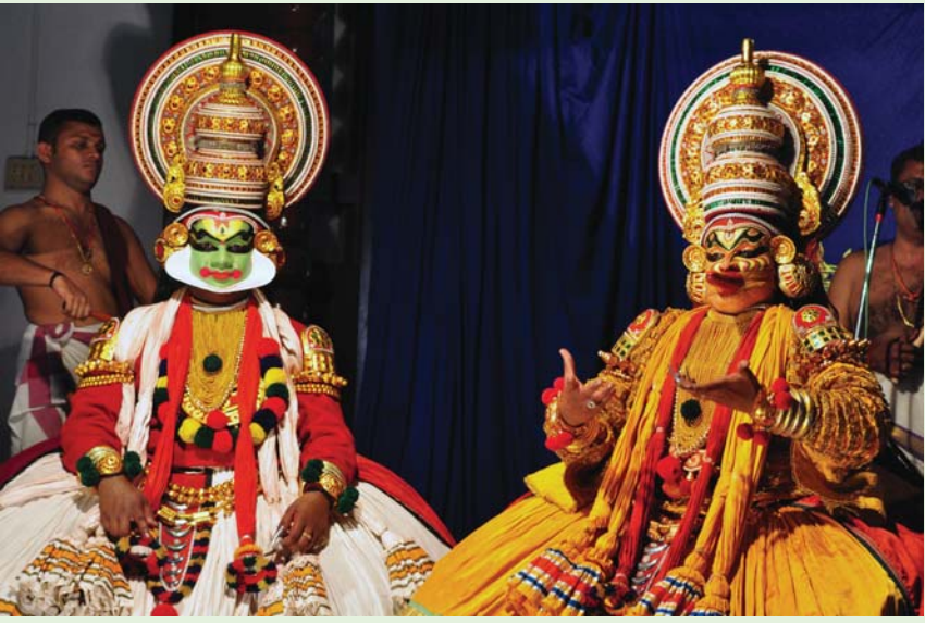
നളചരിതം ഒന്നാംദിവസം രംഗാവതരണത്തിൽ അരങ്ങിൽ നളനും ഹംസവും