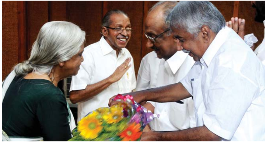
സരസ്വതി സമ്മാൻ ലഭിച്ച കവയിത്രി സുഗതകുമാരിയെ മുഖ്യമന്ത്രി ഉമ്മൻചാണ്ടിയും സാംസ്കാരിക മന്ത്രി കെ.സി. ജോസഫും അനുഗ്രഹിക്കുന്നു. കവി ഒ.എൻ.വി. കുറുപ്പ് സമീപം

സാഹിത്യ ബഹുമതിയായ എഴുത്തച്ഛൻ പുരസ്കാരവും സുഗതകുമാരിക്ക് ലഭിച്ചിരുന്നു.