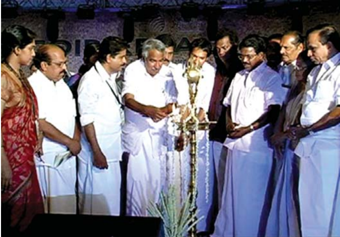
കയർ കേരള 2013 മുഖ്യമന്ത്രി ഉമ്മൻചാണ്ടി ഉദ്ഘാടനം ചെയ്യുന്നു. മന്ത്രി അടൂർ പ്രകാശ് സമീപം.

തൊഴിൽമേഖലയിലെ പ്രശ്നങ്ങൾ നേരിട്ടു മനസ്സിലാക്കുന്നതിന് റവന്യൂ-കയർ മന്ത്രി അടൂർ പ്രകാശ് തൊഴിലാളികളുമായി