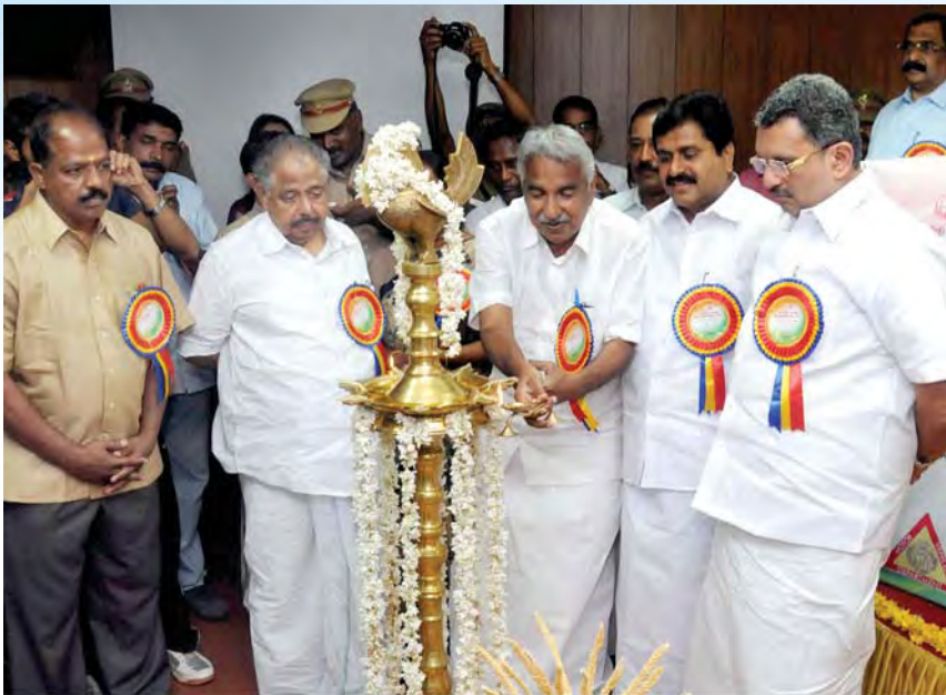
റോഡ് സുരക്ഷാവാരം സംസ്ഥാനതല ഉദ്ഘാടനം മുഖ്യമന്ത്രി ഉമ്മൻ ചാണ്ടി നിർവഹിക്കുന്നു

ചെക്ക് പോസ്റ്റുകളിലൂടെയുള്ള അഴിമതി തടയുവാനായി നൂതനമായ സംവിധാനങ്ങൾ ഈ ഗവൺമെന്റ് ഒരുക്കിയിട്ടുണ്ട്. മോട്ടോർ വാഹന വകുപ്പിന്റെ കീഴിൽ പ്രവർത്തിക്കുന്ന 19 ചെക്ക് പോസ്റ്റുകളിൽ വേയിങ് ബ്രിഡ്ജുകൾ ഇല്ലാത്തതിടത്ത് പോർട്ടബിൾ ഇലക്ട്രോണിക് വേയിങ്