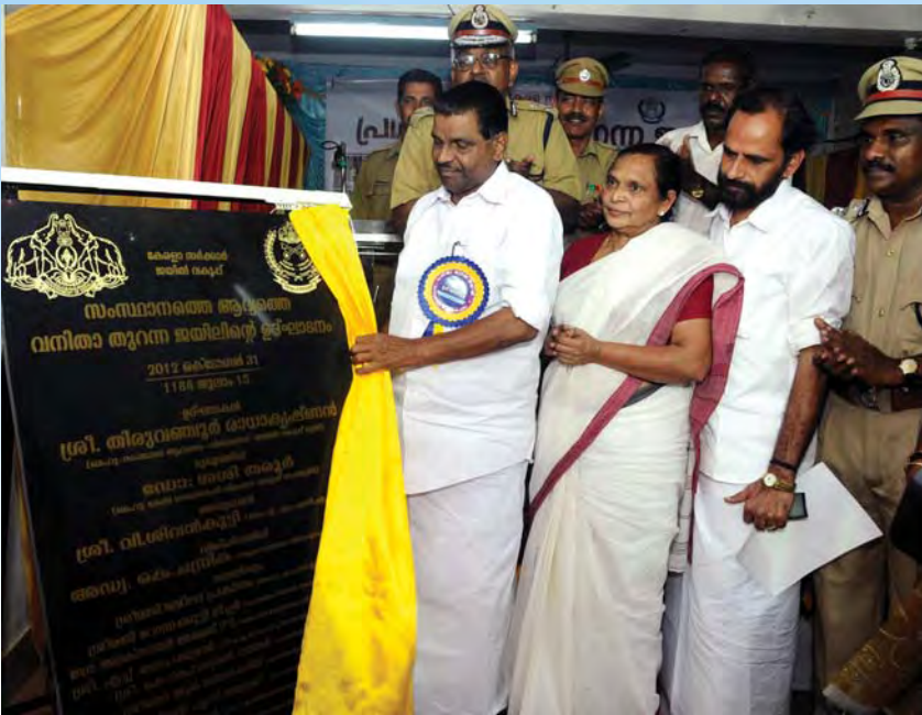
സംസ്ഥാനത്തെ ആദ്യ വനിതാ തുറന്ന ജയിൽ ആഭ്യന്തരമന്ത്രി തിരുവഞ്ചൂർ രാധാകൃഷ്ണൻ ഉദ്ഘാടനം ചെയ്യുന്നു