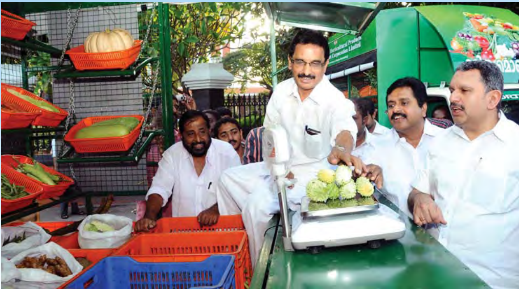
സഞ്ചരിക്കുന്ന പച്ചക്കറി വിൽപ്പനശാല മന്ത്രി കെ.പി. മോഹനൻ ഉദ്ഘാടനം ചെയ്യുന്നു

നായി ചെലവഴിച്ചുവരുന്നു. വരും വർഷങ്ങളിൽ കൂടുതൽ കാര്യക്ഷമമായി പഞ്ചായത്തടിസ്ഥാനത്തിൽ തരിശുഭൂമി കൃഷിയോഗ്യമാക്കാൻ നടപടി സ്വീകരിക്കുകയാണ്.