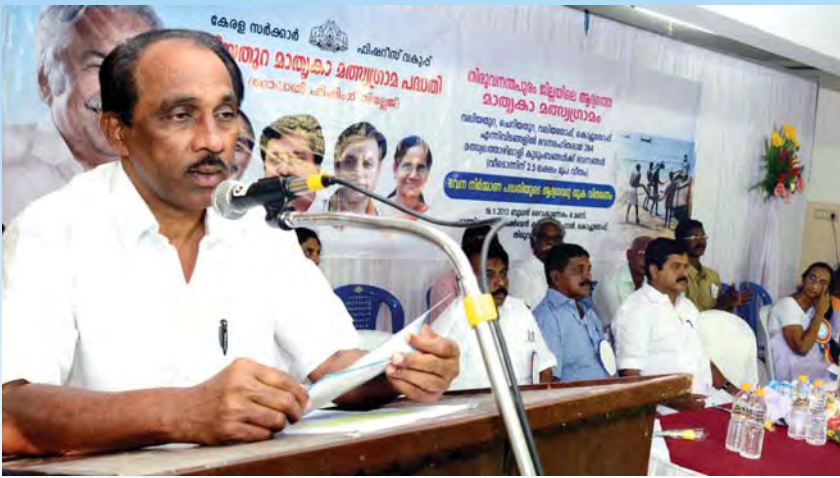
വലിയതുറ മാതൃകാ മത്സ്യഗ്രാമ പദ്ധതി പ്രകാരം വേന നിർമ്മാണ പദ്ധതിയുടെ ആദ്യഗുഡ് വിതരണം ഫിഷറീസ് മന്ത്രി കെ. ബാബു നിർവഹിക്കുന്നു

ഫിഷ്നെറ്റ് ഫാക്ടറി സ്ഥാപിക്കാൻ 30 കോടി യുടെ പദ്ധതിക്ക് അംഗീകാരം നൽകിക്കഴിഞ്ഞു. 30 കോടി രൂപയാണ് ഫാക്ടറിയുടെ നിർമ്മാണത്തിന് അനുവദിച്ചിരിക്കുന്നത്. മത്സ്യത്തൊഴിലാളി കടാശ്വാസ കമ്മീഷന്റെ കാലാവധി 2013 ഡിസംബർ 31 വരെ നീട്ടിയിട്ടുണ്ട്. കേരള മത്സ്യത്തൊഴിലാളി ക്ഷേമനിധി ബോർഡ് മുഖേന നൽകിവരുന്ന മത്സ്യത്തൊഴിലാളികളുടെയും അനുബന്ധ തൊഴിലാളികളുടെയും വാർധക്യ കാല-വിധവ പെൻഷനുകൾ കൂടി ശികയുൾപ്പെടെ വിതരണം ചെയ്തു. സംസ്ഥാനത്തെ മത്സ്യബന്ധന ജനവിഭാഗങ്ങൾക്കിടയിൽ സോഷ്യോ-ഇക്കണോമിക് സർവ്വേ നടത്താൻ തീരുമാനിച്ചു. മത്സ്യത്തൊഴിലാളി സമ്പാദ്യസമാശ്വാസ പദ്ധതിയിലെ ധനസഹായവിതരണം ബാങ്കുകൾ വഴിയാക്കി. സംസ്ഥാനത്ത് രജിസ്റ്റർ ചെയ്ത