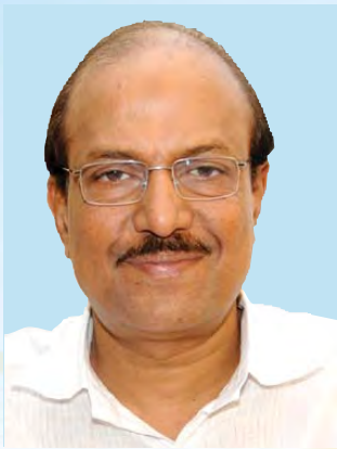
■ പി.കെ.കുഞ്ഞാലിക്കുട്ടി വ്യവസായ-ഐടി മന്ത്രി

വ്യത്യസ്ത മേഖലകളിൽ ആഭ്യന്തര-വിദേശ നിക്ഷേപകരെ ആകർഷിച്ച് സംസ്ഥാനത്തിന്റെ സുസ്ഥിര വികസനം സാധ്യമാക്കുകയെന്ന ലക്ഷ്യം മുൻനിർത്തിയാണ് കഴിഞ്ഞ രണ്ട് വർഷമായി വ്യവസായ-ഐടി വകുപ്പുകൾ പ്രവർത്തിക്കുന്നത്. അടിസ്ഥാന സൗകര്യവികസനത്തിന് മുൻതൂക്കം നൽകിയുള്ള വികസന സമീപനം സംസ്ഥാനത്തിന്റെ ഭാവിക്കു വലിയ മുതൽകൂട്ടാകും. വിവരസാങ്കേതിക വിദ്യയുടെ സാധ്യതകളിലൂടെ സാധാരണക്കാർക്ക് ഏറ്റവും വേഗത്തിൽ സേവനങ്ങൾ നൽകുന്നതിന് തുടക്കമിട്ടുവെന്നതാണ് കഴിഞ്ഞ വർഷത്തെ മികച്ച ഭരണനേട്ടങ്ങളിലൊന്നായി കാണുന്നത്. എമർജിന്റ് കേരളയിലൂടെ സംസ്ഥാനത്തിന്റെ പുരോഗതിക്ക് അനിവാര്യവും ഇണങ്ങുന്നതുമായ നിരവധി പദ്ധതിനിർദ്ദേശങ്ങൾ സർക്കാരിന് ലഭിച്ചു. ഇവയിൽ ചില പദ്ധതികൾക്ക് തുടക്കമിടാനായി. നിരവധി പദ്ധതി നിർദ്ദേശങ്ങൾ വിവിധ സർക്കാർ വകുപ്പുകളുടെ പരിഗണനയിലുണ്ട്.