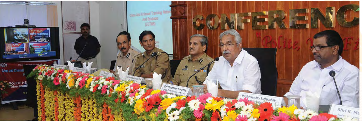
പൊലീസിന്റെ കൃത്യനിർവഹണം കാര്യക്ഷമവും സുതാര്യവുമാക്കുന്നതിനായി നടപ്പാക്കുന്ന ക്രൈം ആൻഡ് ക്രിമിനൽ ട്രാക്കിങ് സെന്റർക്ക് ആൻഡ് സിസ്റ്റത്തിന്റെ (സി.സി.ടി.എൻ.എസ്.) ഉദ്ഘാടനം മുഖ്യമന്ത്രി ഉമ്മൻചാണ്ടി നിർവഹിക്കുന്നു. ആഭ്യന്തരമന്ത്രി തിരുവഞ്ചൂർ രാധാകൃഷ്ണൻ സമീപം

കുറ്റാന്വേഷണം കൂടുതൽ കാര്യക്ഷമവും ഫലപ്രദവുമാക്കുന്നതിന് 100 സ്റ്റേഷനുകളിൽ ആധുനിക കമ്പ്യൂട്ടർ അധിഷ്ഠിത ഡിജിറ്റൈസ്ഡ് സംവിധാനമേർപ്പെടുത്തി. കുറ്റകൃത്യങ്ങൾ, കുറ്റവാളികൾ, അവരുടെ വിലാസങ്ങളും തുടങ്ങിയവ സംബന്ധിച്ച വിശദാംശങ്ങൾ കമ്പ്യൂട്ടർ ശൃംഖല വഴി ബന്ധിപ്പിച്ചുകൊണ്ട് എത്രയും വേഗം കുറ്റവാളികളെ കണ്ടെത്താനും അവരെ