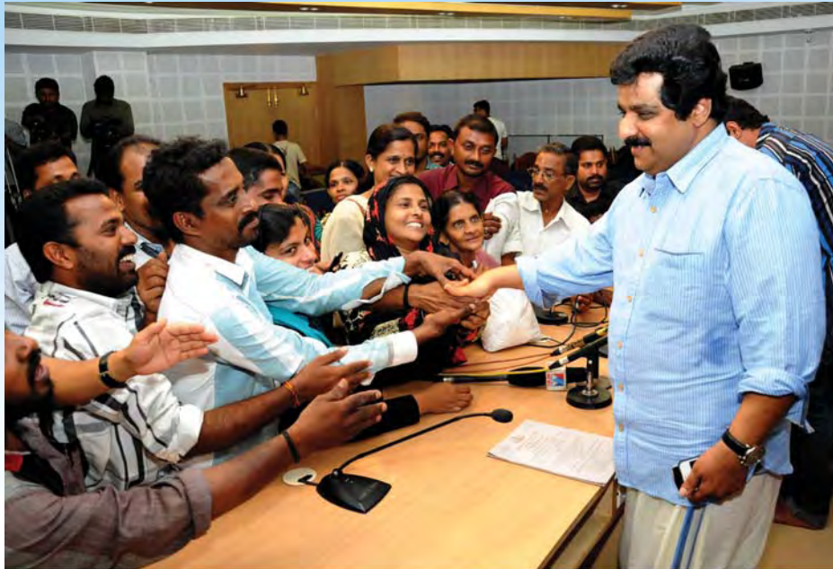
സെക്രട്ടേറിയറ്റ് പി.ആർ ചോബറിൽ വാർത്താസമ്മേളനം നടത്താനെത്തിയ സാമൂഹികക്ഷേമ മന്ത്രി ഡോ. എം.കെ. മുനീറുമായി വികലാംഗർ ആശ്വാദം പങ്കിടുന്നു

തിരക്കേറിയ നഗരങ്ങളിലും മറ്റ് പട്ടണങ്ങളിലും സന്ദർശകരാകെയെത്തുന്ന സ്ത്രീകളുടെയും യാത്ര ചെയ്യുന്ന സ്ത്രീകളുടെയും പ്രാഥമിക കൃത്യനിർവഹണം ദുസ്സഹമായ അവസ്ഥയിലാണെന്നു മനസ്സിലാക്കി അവർക്ക് ആധുനിക സൗകര്യത്തോടുകൂടിയുള്ള ടോയ്ലറ്റുകൾ ഷീ-ടോയ്ലറ്റ് എന്ന