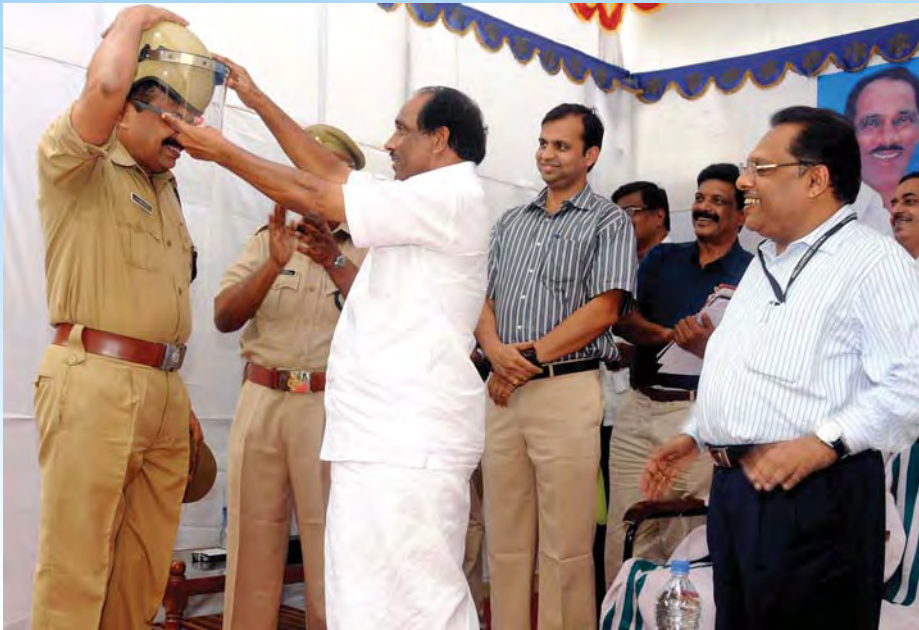
എക്സൈസ് വകുപ്പിന് പുതുതായി വാങ്ങിയ വാഹനങ്ങളുടെ ഫ്ലാഗ് ഓഫിംഗ്, എൻഫോഴ്സ് ക്വട്ടർകളുടെ വിതരണവും, ഹെൽപ്പ് ഡസ്കിന്റെ ഉദ്ഘാടനവും മന്ത്രി കെ. ബാബു നിർവഹിക്കുന്നു.

ധതയോടെയുള്ള പുതുക്കിയ മദ്യനയം അവതരിപ്പിക്കാൻ കഴിഞ്ഞുവെന്നതാണ് ഏറ്റവും വലിയ നേട്ടം. മദ്യത്തിന്റെ ലഭ്യത കുറച്ചുകൊണ്ടു ലഹരിവിരുദ്ധ ബോധവൽക്കരണത്തിന് പ്രാധാന്യം നൽകിയ മദ്യനയം തിരിനാളായിരുന്നു.