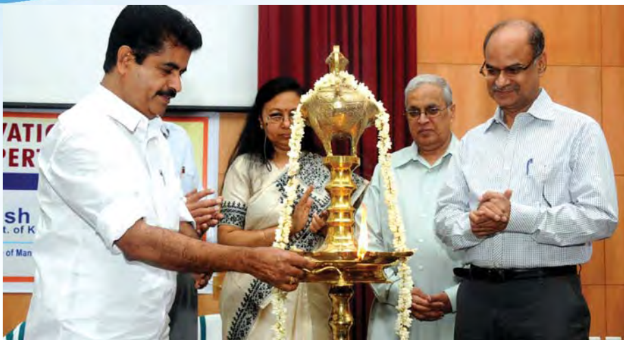
പൊതുമുതൽ/ഭൂസംരക്ഷണ മേഖലയിലെ നൂതന ആശയങ്ങൾ എന്ന വിഷയത്തിൽ നടന്ന ശില്പശാല റവന്യൂ മന്ത്രി അടൂർ പ്രകാശ് ഉദ്ഘാടനം ചെയ്യുന്നു