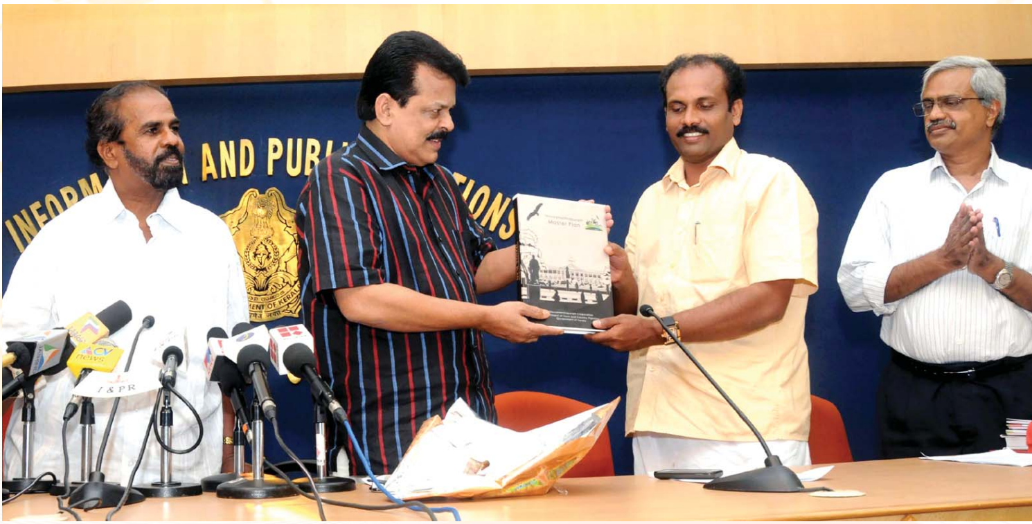
നഗര-ഗ്രാമാസൂത്രണ വകുപ്പ് തയ്യാറാക്കിയ തിരുവനന്തപുരം നഗരത്തിന്റെ മാസ്റ്റർപ്ലാൻ നഗരകാര്യമന്ത്രി മഞ്ഞളാകുഴി അലി പ്രകാശനം ചെയ്യുന്നു

ളായി നിലനിന്നിരുന്ന അപാകതകൾ പരിഹരിക്കാൻ ഇതിനകം കഴിഞ്ഞിട്ടുണ്ട്. ദീർഘവീക്ഷണമില്ലാതെയും വിദഗ്ധരുമായി കൂടിയായോലോചനകൾ നടത്താതെയും ഉദ്യോഗസ്ഥതലത്തിൽ മുൻ സർക്കാർ കൊണ്ടുവന്ന ഭേദഗതികൾ കെട്ടിടനിർമ്മാണ മേഖലയിൽ വലിയ സ്തംഭനമുണ്ടാക്കിയിരിക്കുന്നു. ഈ മേഖലയിലെ നിക്ഷേപങ്ങളും തൊഴിലവസരങ്ങളും ഇതുമൂലം കുറഞ്ഞു. ഫ്ളാറ്റുകളുടെ നിർമ്മാണം നില