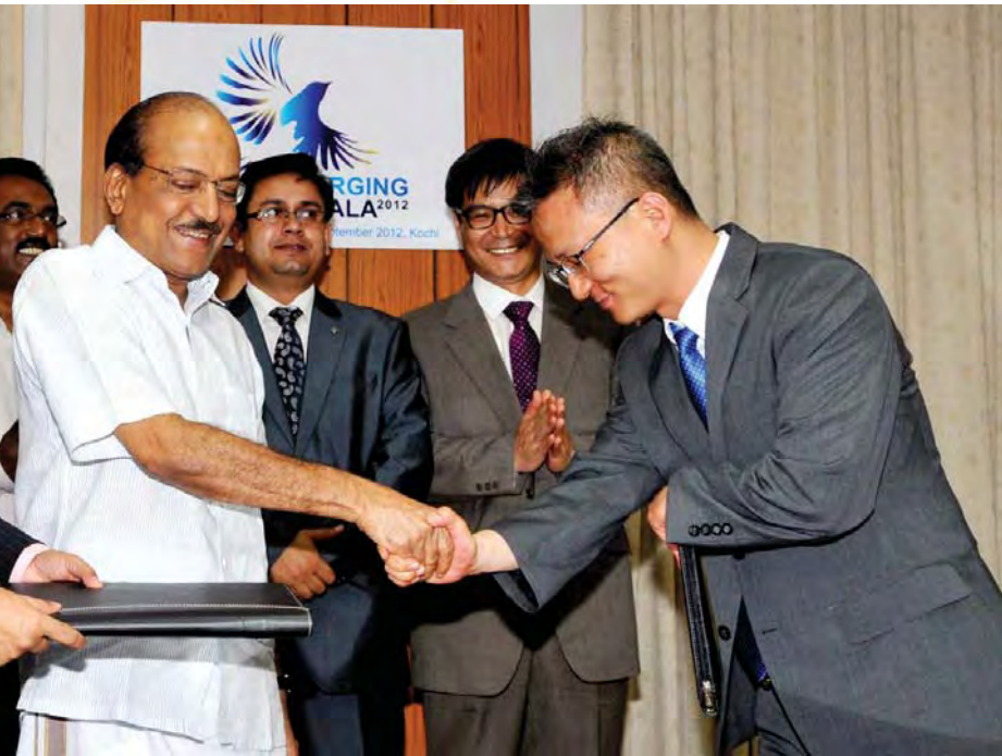
സുരോർജ് സാമഗ്രികൾ നിർമ്മിക്കുന്ന കൊറിയൻ കമ്പനിയായ ജൂസുങ് എൻജിനീയറിംഗ് കമ്പനിയും കെ.എസ്.ഐ.ഡി.സി.യുമായുള്ള ധാരണാപത്രം ഒപ്പിട്ട ശേഷം

നടന്നുവരുന്നു. ഇതിന് പുറമെ കോഴിക്കോട് സൈബർ പാർക്കിൽ മൂന്ന് ലക്ഷം ചതുരശ്ര അടി വിസ്തീർണ്ണമുള്ള കെട്ടിടം, തൃശൂർ കൊരട്ടി ഐടി പാർക്ക് 3.3 ലക്ഷം ചതുരശ്ര അടി വിസ്തീർണ്ണമുള്ള കെട്ടിടത്തിന്റെ നിർമ്മാണം എന്നിവ നടന്നുവരുന്നു. പുതിയ ഐടി നയത്തിന്റെ ഭാഗമായി സ്വകാര്യസംരംഭകരുടെ സഹായത്തോടെ സംസ്ഥാനത്ത് കൂടുതൽ ഐടി, ഐടി അനുബന്ധ പാർക്കുകൾ നിർമ്മിക്കാൻ ഉദ്ദേശിക്കുന്നുണ്ട്. എമർജിങ് കേരളയിൽ ഏതാണ്ട് ഇരുപതോളം ഐടി പാർക്കുകൾ നിർമ്മിക്കുവാൻ താൽപര്യം പ്രകടിപ്പിച്ച് നിക്ഷേപകർ എത്തിയിരുന്നു. ഇതുമായി ബന്ധപ്പെട്ട ചർച്ചകളും പുരോഗമിക്കുകയാണ്. സംസ്ഥാനത്തിന്റെ സ്വപ്ന സമൃദ്ധിയായ കൊച്ചി സ്മാർട്ട്സിറ്റിക്ക് 10,900 ചതുരശ്ര അടി വിസ്തീർണ്ണമുള്ള പവലിയൻ പൂർത്തിയായി. അഞ്ചുലക്ഷം ചതുരശ്ര അടി വിസ്തീർണ്ണമുള്ള കെട്ടിടം പണിയുന്നതിന്റെ പ്രാരംഭ പ്രവർത്തനങ്ങൾ മുഴുവൻ പൂർത്തിയായിട്ടുണ്ട്. 18 മാസങ്ങൾക്കുള്ളിൽ സ്മാർട്ട് സിറ്റിയുടെ ഒന്നാംഘട്ടം കമ്മീഷൻ ചെയ്യാൻ കഴിയുമെന്നാണ് പ്രതീക്ഷിക്കുന്നത്. തിരുവനന്തപുരം പള്ളിപ്പുറത്തെ ടെക്നോസിറ്റിയിൽ അടിസ്ഥാന സൗകര്യവികസനത്തിന്റെ ഭാഗമായുള്ള നിർമ്മാണ പ്രവർത്തനങ്ങൾ പുരോഗമിക്കുകയാണ്. നാലു കമ്പനികൾക്ക് ഇവിടെ ഭൂമി അനുവദിച്ചിട്ടുണ്ട്. ബഹുരാഷ്ട്ര ഐടി കമ്പനികളായ ഇൻഫോസിസ്, ടി.സി.എസ്, സൺടെക്, കൊഗ്നിസെന്റ്, ഏണസ്റ്റ് ആൻഡ് യങ് തുടങ്ങി നിരവധി കമ്പനികൾ കേരളത്തിൽ പുതുതായും കൂടുതലായും നിക്ഷേപ സന്നദ്ധതയുമായി രംഗത്തെത്തിയത് സംസ്ഥാനത്തെ ഐടി വളർച്ച ശരിയായ ദിശയിലാണ് എന്നതിന്റെ സൂചനയാണ്.