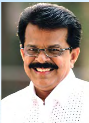
■ മഞ്ഞളാംകുഴി അലി നഗരകാര്യ-ന്യൂനപക്ഷക്ഷേമ മന്ത്രി

പരിസ്ഥിതിയുടെ തണലിൽ ഇടം തേടുന്നതാണ് നമ്മുടെ സംസ്കാരം. പ്രകൃതിയുടെ സ്വതന്ത്ര്യമുള്ള രൂപത്തെ കീറിമുറി കുന്ന ചെറിയ വിഭാഗത്തെ മാറ്റിനിർത്തിയാൽ പരിസ്ഥിതിയുടെ സൗന്ദര്യവും സർഗ്ഗങ്ങളും സ്പർശിക്കാൻ കേരളീയർ ആഗ്രഹിക്കാറുണ്ട്. കോൺക്രീറ്റ് കെട്ടിടങ്ങൾക്കു ചുറ്റിലും പച്ചക്കിരകളും അടുക്കളത്തോട്ടവും പൂമുഖത്തെ ചെടികളുമൊക്കെയായി നമ്മുടെ സംസ്കാരം വീട്ടിലും പരിസരത്തും വളരുന്നു. അതുകൊണ്ടുതന്നെ നഗരങ്ങളുടെ നിർമ്മിതിയിലും വികസനത്തിലും സത്തുലനാവസ്ഥ സംരക്ഷിക്കേണ്ടതുണ്ട്. ലോകമെമ്പാടും നഗരങ്ങളും പരിസ്ഥിതിയും തമ്മിലുള്ള പൊരുത്തക്കേടിന്റെ ചർച്ചകൾ മുറുകുമ്പോൾ പരിസ്ഥിതി സൗഹൃദനഗരങ്ങൾ എങ്ങനെയെന്നു കാണിച്ചുകൊടുക്കാനാണ് കേരളം ശ്രമിക്കുന്നത്. കേരളത്തിന്റെ ഹൃദയമായ പച്ചപ്പിന്നൂ കേടുപറ്റാതെ മാതൃകാ നഗരങ്ങൾ രൂപപ്പെടുത്തുകയും പരിസ്ഥിതി സൗഹൃദവികസനങ്ങൾ നടപ്പാക്കുകയുമാണ് നഗരകാര്യവകുപ്പ് ചെയ്യുന്നത്.