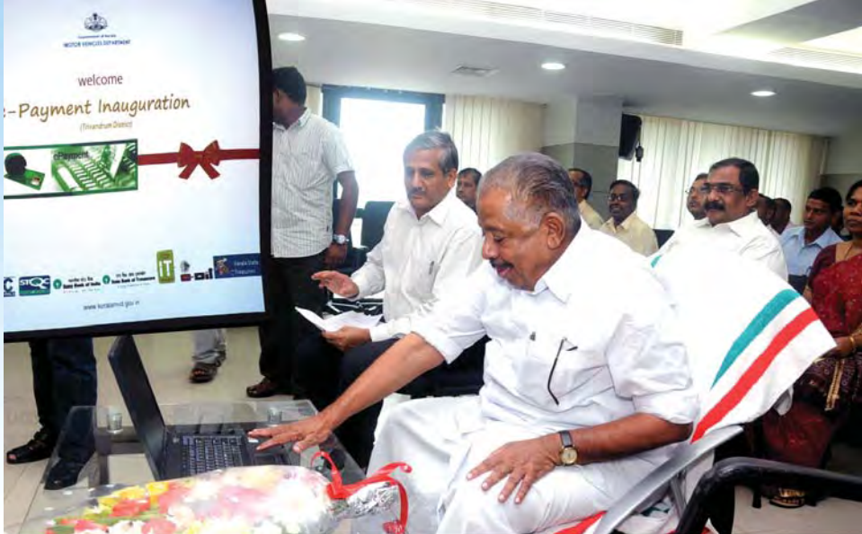
തിരുവനന്തപുരം ജില്ലയിലെ റീജിയണൽ സബ്റീജിയണൽ ട്രാൻസ്പോർട്ട് ഓഫീസുകളിൽ ഇ-പെയ്മെന്റ് സംവിധാനം നടപ്പാക്കുന്നതിന്റെ ഉദ്ഘാടനം ഗതാഗത-വൈദ്യുതിമന്ത്രി ആര്യാടൻ മുഹമ്മദ് നിർവഹിക്കുന്നു

സമ്പൂർണ്ണ കമ്പ്യൂട്ടർവൽക്കരണത്തിന്റെയും ഇ-ഗവേണൻസിന്റെയും ഭാഗമായി കെ.എസ്.ആർ.ടി.സിയിൽ ഓൺലൈൻ റിസർവേഷൻ സമ്പ്രദായം നടപ്പാക്കി. കെ.എസ്.ആർ.ടി.സിയുടെ ഡിപ്പോകൾ, വർക്ക്ഷോപ്പുകൾ, ഹെൽ ഓഫീസ് എന്നിവ കമ്പ്യൂട്ടർ ശൃംഖലവഴി ബന്ധിപ്പി