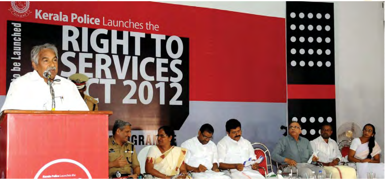
കേരള പോലീസിൽ സേവനാവകാശം നടപ്പാക്കുന്നതിന്റെ സംസ്ഥാനതല ഉദ്ഘാടനം മുഖ്യമന്ത്രി ഉമ്മൻചാണ്ടി നിർവഹിക്കുന്നു. മന്ത്രിമാരായ തിരുവഞ്ചൂർ രാധാകൃഷ്ണൻ, വി.എസ്. ശിവകുമാർ എന്നിവർ സമീപം

ഫിക്കറ്റ്, ആയുധങ്ങളും സ്ഫോടക വസ്തുക്കളും സംബന്ധിച്ച ലൈസൻസ്, ജോലി സംബന്ധമായ വെരിഫിക്കേഷൻ, വിദേശികളുടെ രജിസ്ട്രേഷൻ, കസ്റ്റഡിയിലെടുത്ത വാഹനങ്ങൾ നടപടിക്രമങ്ങൾ പൂർത്തിയാക്കി തിരികെ നൽകൽ, സമൻസുകൾ നൽകുന്നതും വാറന്റുകൾ നടപ്പാക്കുന്നതും, പട്ടികജാതി-വർഗ വിഭാഗങ്ങൾക്കെതിരെയുള്ള അതിക്രമങ്ങൾ എന്തിനാണ് സേവനാവകാശത്തിന്റെ പരിധിയിൽ കൊണ്ടുവന്നിട്ടുള്ളത്.