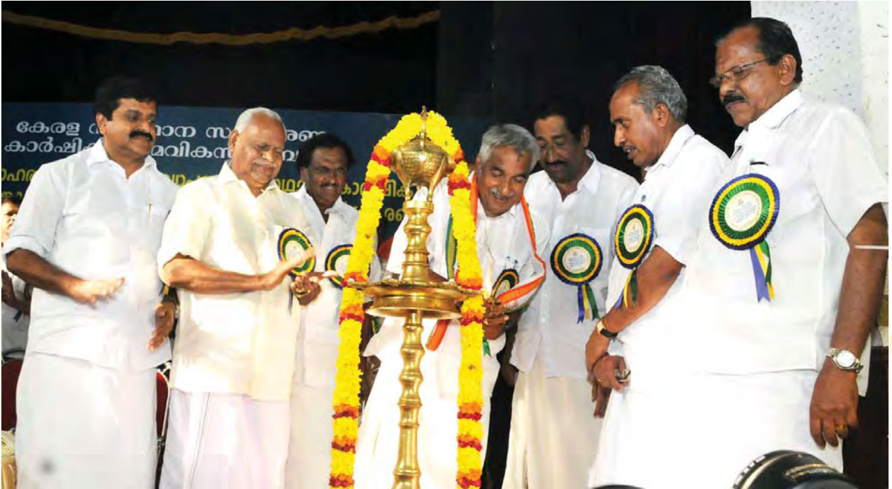
കേരള സംസ്ഥാന സഹകരണ കാർഷിക ഗ്രാമവികസന ബാങ്കിന്റെ നികേഷപസമാഹരണ അനുമതി പ്രഖ്യാപനവും പ്രാഥമിക കാർഷിക ബാങ്കുകളുടെ പ്രവർത്തന മികവിനുള്ള അവാർഡ് വിതരണത്തിന്റെ ഉദ്ഘാടനവും മുഖ്യമന്ത്രി ഉമ്മൻചാണ്ടി വി.ജെ.ടി. ഹാളിൽ നിർവഹിക്കുന്നു. മന്ത്രിമാരായ വി.എസ്. ശിവകുമാർ, സി.എൻ. ബാലകൃഷ്ണൻ തുടങ്ങിയവർ സമീപം

കാർഷിക ഉൽപാദനം വർദ്ധിപ്പിക്കുന്നതിനും കർഷകരെ പ്രോത്സാഹിപ്പിക്കുന്നതിനുമായി 'കർഷകസേവന കേന്ദ്രങ്ങൾ' ആരംഭിക്കുന്നതിന് സംസ്ഥാനത്തെ 14 ജില്ലകളിലെ തിരഞ്ഞെടുത്ത 40 ബ്ലോക്കു