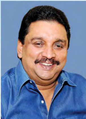
■ ഷിബു ബേബിജോൺ തൊഴിൽ മന്ത്രി

സർവരാജ്യ തൊഴിലാളികളെ സംഘടിപ്പിക്കുവാൻ അവകാശബോധത്തിന്റെ ചക്രവാളങ്ങളിൽ മുഴങ്ങിക്കേട്ട ഈ മുദ്രാവാക്യം അധ്വാനവർഗത്തിന്റെ ചരിത്രം തന്നെ മാറ്റിക്കുറിച്ചു. അധ്വാനിക്കുന്നവന്റെ വിയർപ്പിന് മൂല്യം കൽപ്പിച്ചുകൊണ്ട് എട്ടു മണിക്കൂർ ജോലി എട്ടു മണിക്കൂർ വിശ്രമം എട്ടുമണിക്കൂർ വിനോദം എന്ന മാതൃഷ്ടിക സമവാക്യം പ്രയോഗത്തിൽ കൊണ്ടുവരാനായി തൊഴിലാളികൾ നടത്തിയ പോരാട്ടങ്ങളുടെ പരിണിതഫലങ്ങളാണ് ഇന്നു നാം അനുഭവിക്കുന്നത്.