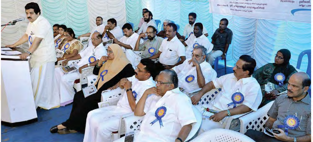
തമ്പുര പ്രതീക്ഷാവേർ മന്ത്രി എം.കെ. മുനീർ ഉദ്ദേശ്യം ചെയ്യുന്നു

വ്യഭജനങ്ങളുടെ സംഖ്യ 13 ശതമാനം അധികരിച്ച കേരളത്തിൽ ഒരു വയോജനനയം പ്രഖ്യാപിക്കാൻ സാമൂഹികനീതി വകുപ്പിന് കഴിഞ്ഞു. വ്യഭജനങ്ങളുടെ സമഗ്രമായ ആരോഗ്യ-സാമ്പത്തിക-സാമൂഹിക സംരക്ഷണത്തിനുള്ള പദ്ധതികൾ ഉൾക്കൊള്ളുന്നതാണ് ഈ നയം. കുട്ടികളെ ചൂഷണമുക്തരാക്കുന്നതിനും അവരുടെ അവകാശങ്ങൾ സംരക്ഷിക്കുന്നതിനുമായി 'ചൈൽഡ് റൈറ്റ്സ് കമ്മീഷൻ' രൂപീകരിച്ചു. ■