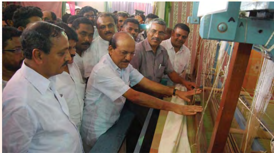
ദേശീയ കൈത്തറി പ്രദർശന വിപണനമേള മന്ത്രി പി.കെ. കുഞ്ഞാലിക്കുട്ടി ഉദ്ഘാടനം ചെയ്യുന്നു

ട്ടുണ്ട്. എയർപോർട്ട്-സീപോർട്ട് അടിസ്ഥാനപ്പെടുത്തിയുള്ള ഈ പദ്ധതിയുടെ ഭാഗമായുള്ള സ്ഥലമേറ്റെടുക്കൽ നടപടിക്രമങ്ങൾ പുരോഗമിക്കുകയാണ്. ചാറ്റർജി ഗ്രൂപ്പ്, ഐ.റ്റി.സി, എസ്.ആർ.ഇ.ഐ ഇൻഫ്രാസ്ട്രക്ചർ ഫിനാൻസ് ലിമിറ്റഡ്, ഹിൻഡൽകോ ഇൻഡസ്ട്രീസ് ലിമിറ്റഡ് എന്നീ വൻകിട കമ്പനികൾ ഇതിനകം പദ്ധതിയുമായി സഹകരിച്ച് പ്രവർത്തിക്കാൻ സന്നദ്ധത അറിയിച്ചിട്ടുണ്ട്. എറണാകുളം, തൃശൂർ, മലപ്പുറം ജില്ലകളിലൂടെ കടന്നുപോകുന്ന കെ.എസ്.ഐ.ഡി.സി.യുടെ നിർദ്ദിഷ്ട കൊച്ചി-പാലക്കാട് നിംസ് പദ്ധതി, കെ.എസ്.ഐ.ഡി.സി.യുടെ തന്നെ പാലക്കാട്ടെ നിർദ്ദിഷ്ട ലൈറ്റ് എൻജിനീയറിംഗ് ഇൻഡസ്ട്രിയൽ പാർക്ക് എന്നീ