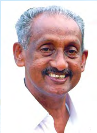
■ കെ.സി. ജോസഫ് ഗ്രാമവികസന-ആസൂത്രണ-സാംസ്കാരിക മന്ത്രി

യു. ഡി.എഫ് സർക്കാർ മൂന്നാം വർഷത്തിലേക്കു കടന്നിരിക്കുകയാണ്. കേരളത്തിലെ ജനങ്ങളുടെ പ്രതീക്ഷയ്ക്കൊത്തു പ്രവർത്തിക്കാൻ ഈ കാലയളവിൽ കഴിഞ്ഞുവെന്ന അഭിമാനം ഞങ്ങൾക്കുണ്ട്. ചെയ്തതിനേക്കാൾ അധികം കാര്യങ്ങൾ ചെയ്യാൻ ബാക്കിയുണ്ടെന്ന വസ്തുത വിസ്മരിക്കുന്നില്ല. എങ്കിലും ചുരുങ്ങിയ കാലംകൊണ്ട് നല്ല പ്രവർത്തനം കാഴ്ചവയ്ക്കാൻ കഴിഞ്ഞതിന്റെ സന്തോഷം തോന്നുന്നു.