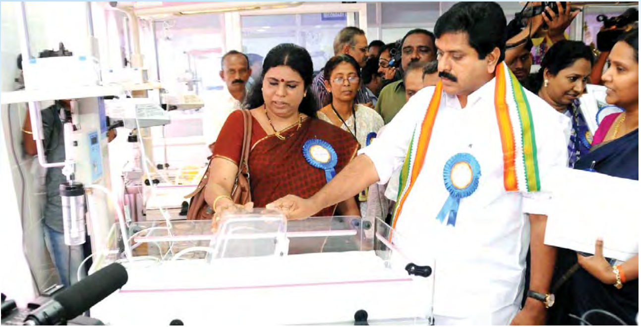
തിരുവനന്തപുരം കുട്ടികളുടെ ആശുപത്രിയിലെ നവജാത ശിശുസംരക്ഷണ കേന്ദ്രത്തിന്റെ ഉദ്ഘാടനത്തിനു ശേഷം

ഗിക്കുന്നതിനുള്ള ക്രിയാത്മക നടപടികളാണ് സർക്കാർ സ്വീകരിച്ചിട്ടുള്ളത്. സംസ്ഥാന വ്യാപകമായി 60 ഹോമിയോ ഡിസ്പെൻസറികൾ ഇതിനകം ആരംഭിച്ചു. 50 എണ്ണം ഉടൻ ആരംഭിക്കും. പുതിയ രണ്ട് ആശുപത്രികൾ തുടങ്ങാനും നടപടികൾ ആരംഭിച്ചു. 14 ജില്ലകളിലും സീതാലയം വനിതാ ആരോഗ്യ കേന്ദ്രങ്ങൾ തുറന്നു. ജീവിതശൈലീ രോഗങ്ങൾ പ്രതിരോധിക്കുന്നതിനും ചികിത്സിച്ചുമാറ്റുന്നതിനുമായി തിരുവനന്തപുരത്തും കോഴിക്കോടും ആയുഷ് ഹോളിസ്റ്റിക് കേന്ദ്രങ്ങൾ ആരംഭിച്ചു. മലപ്പുറം ചേതനാ ക്യാൻസർ കെയർ സെന്ററിനെ 10 കിടക്കകളോടുകൂടിയ ആശുപത്രിയായി ഉയർത്തുന്നതിനുവേണ്ട നടപടി സ്വീകരിച്ചു. മരുന്ന് വിതരണം സുഗമമാക്കുന്നതിന്റെ ഭാഗമായി വാഹനസൗകര്യത്തോടുകൂടിയ നാലു റീജിയണൽ മെഡിക്കൽ സ്റ്റോറുകൾ ആരംഭിച്ചു. കാസർകോട് എൻഡോസൾഫാൻ ബാധ്യത മേഖലയിൽ സ്പെഷ്യാലിറ്റി മൊബൈൽ ക്ലിനിക്ക് ആരംഭിച്ചു. ആലപ്പുഴയിൽ ജെനിയാട്രിക്സിലും, ഇടുക്കിയിൽ തൈറോയ്ഡിലും, തൃശ്ശൂരിൽ അഡോളസന്റ് ഹെൽത്ത് കെയറിലും കണ്ണൂരിൽ മാതൃശിശു പരിചരണത്തിലും സ്പെഷ്യാലിറ്റി കെയർ സെന്ററുകൾ ആരംഭിച്ചു. പട്ടികജാതി കോളനികളിൽ 29 ആരോഗ്യകേന്ദ്രങ്ങൾ തുടങ്ങി. ഓരോ ജില്ലയിലേയും രണ്ട് ഡിസ്പെൻസറികളെ മാതൃകാ ഡിസ്പെൻസറികളായി ഉയർത്തി. തൃശ്ശൂരിൽ കൗമാരപ്രായക്കാരായുള്ള ഹെൽത്ത് കെയർ സെന്ററുകൾ ആരംഭിച്ചു. കോഴിക്കോട് ഗവൺമെന്റ് ഹോമിയോപ്പതിക് മെഡിക്കൽ കോളേജിൽ റിസർച്ച് ലാബിന്റെയും തിരുവനന്തപുരം ഹോമിയോപ്പതിക് മെഡിക്കൽ കോളേജിൽ ക്യാൻസർ കെയർ