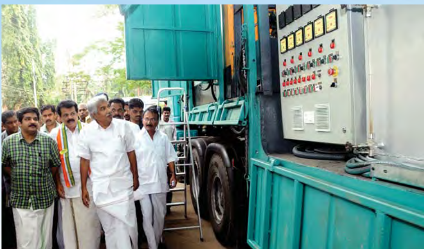
മൊബൈൽ ഇൻസിനേറ്ററിന്റെ പ്രവർത്തനം മുഖ്യമന്ത്രി ഉമ്മൻചാണ്ടി നോക്കിക്കാണുന്നു

നഗരങ്ങളെ അലട്ടുന്ന പ്രധാന പ്രശ്നമാണ് മാലിന്യം. സംസ്കരണ പ്ലാന്റുമായി എവിടെ ചെന്നാലും പ്രാദേശികമായ എതിർപ്പുകൾ ഉയർന്നുവരും. എങ്കിലും വരാന്തിരിക്കുന്ന വലിയ വിപത്ത് ഒഴിവാക്കാൻ സർക്കാരിന് ബാധ്യതയുണ്ട്. ചില നഗരസഭകളിൽ നല്ല രീതിയിൽ മാലിന്യ സംസ്കരണ സംവിധാനങ്ങൾ നടന്നുവരുന്നുണ്ട്. ഇവ ഇല്ലാത്ത സ്ഥലങ്ങളിൽ പരിസ്ഥിതിക്ക് ദോഷം വരാത്തരീതിയിലുള്ള ആധുനിക പ്ലാന്റുകൾ സ്ഥാപിക്കും. മാലിന്യസംസ്കരണ സംവിധാനം ശക്തിപ്പെടുത്തുന്നതിനായി 2012-13 വർഷത്തെ സംസ്ഥാന ബജറ്റിൽ പ്രഖ്യാപിച്ച സിയാൽ മോഡൽ കമ്പനി 'ക്രീൻ കേരള കമ്പനിലിമിറ്റഡ്' എന്ന പേരിൽ രൂപവത്കരിച്ചു കഴിഞ്ഞു. ശരിയായ മാലിന്യസംസ്കരണ സംവിധാനങ്ങളുണ്ടെങ്കിൽ മാത്രമേ നഗരവികസനം യാഥാർത്ഥ്യമാകൂ. അത്യാധുനിക