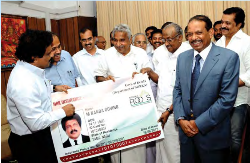
നോർക്ക റൂട്ട്സിന്റെ ഐ.ഡി. കാർഡ് വിതരണോദ്ഘാടനം മുഖ്യമന്ത്രി ഉമ്മൻചാണ്ടി നിർവഹിക്കുന്നു. മന്ത്രി കെ.സി. ജോസഫ് സമീപം

സർക്കാർ മൂന്നു മാസത്തെ സാവകാശം അനുവദിച്ചിരിക്കുകയാണ്.