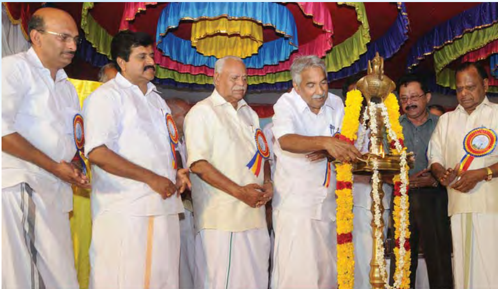
സഹകരണവകുപ്പ് ജഗതിയിൽ നിർമ്മിക്കുന്ന ഓഫീസ് സമുച്ചയത്തിന്റെ ശിലാസ്ഥാപനം മുഖ്യമന്ത്രി നിർവഹിക്കുന്നു

കേപ്പിന്റെ കീഴിലുള്ള തൃക്കരിപ്പൂർ, വടകര, തലശ്ശേരി, കിടങ്ങൂർ എൻജിനീയറിങ്