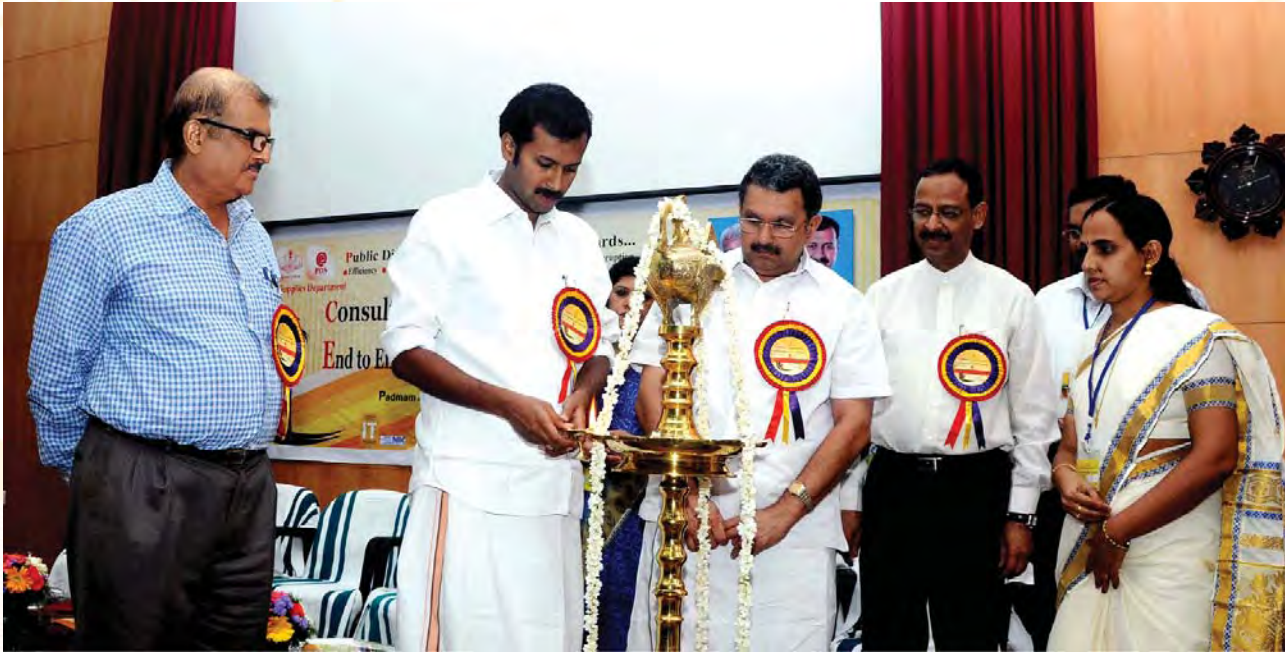
പൊതുവിതരണ സംവിധാനം പൂർണ്ണമായും കമ്പ്യൂട്ടർവത്കരിക്കുന്നതിന്റെ ഭാഗമായി സംഘടിപ്പിച്ച ശില്പശാല ഭക്ഷ്യ-സിവിൽ സപ്ലൈസ് മന്ത്രി അനൂപ് ജേക്കബ് ഉദ്ഘാടനം ചെയ്യുന്നു

സംസ്ഥാനത്തെ പൊതുവിതരണരംഗം സമഗ്രമായ മാറ്റത്തിന്റെ പാതയിലാണ്. പൊതുവിതരണ സംവിധാനം പൂർണ്ണമായി കമ്പ്യൂട്ടർവത്കരിക്കുന്നതിനും അർഹത