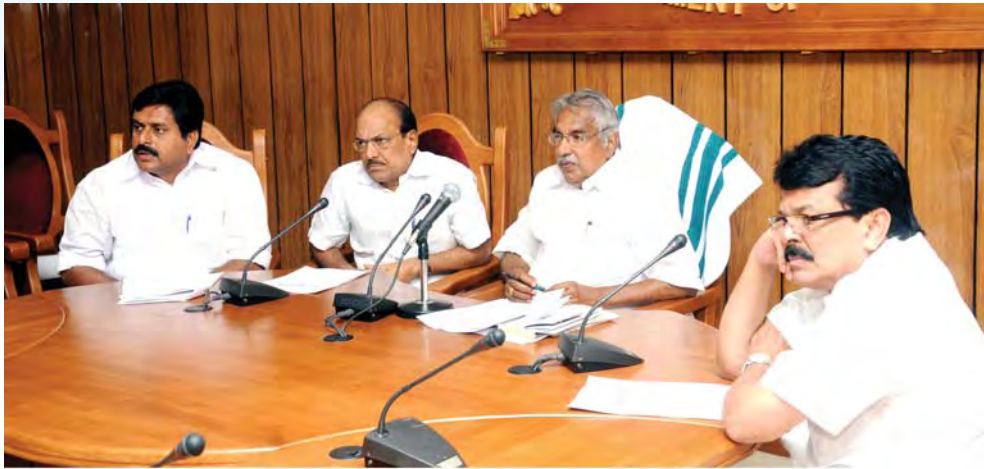
തലസ്ഥാന വികസനം സംബന്ധിച്ച പദ്ധതികളെക്കുറിച്ച് ചർച്ച ചെയ്യാൻ മുഖ്യമന്ത്രി ഉമ്മൻചാണ്ടിയുടെ അധ്യക്ഷതയിൽ ചേർന്ന ഉന്നതാധികാര സമിതി യോഗം. മന്ത്രിമാരായ പി.കെ. കുഞ്ഞാലിക്കുട്ടി, വി.എസ്. ശിവകുമാർ, മഞ്ഞളാകുഴി അലി എന്നിവർ സമീപം

മിക്ക നഗരസഭകളും ദൈനംദിന പ്രവർത്തനങ്ങൾക്കുപോലും സാമ്പത്തികമായി പ്രയാസപ്പെടുന്ന സാഹചര്യമുണ്ട്. അവരെ സഹായിക്കാൻ ഒട്ടേറെ പദ്ധതികൾ നടപ്പാക്കിവരുന്നു. നഗരസഭകൾക്ക് വരുമാനം കിട്ടുന്ന പദ്ധതികൾ ആസൂത്രണം ചെയ്യുകയും ഭൗതിക സാഹചര്യം ഒരുക്കുകയും ചെയ്താൽ പദ്ധതിക്കാവശ്യമായ പണം നൽകാൻ സർക്കാർ സന്നദ്ധമാണ്. മിക്ക നഗരസഭകളും ഇത്തരം പദ്ധതികൾ സമർപ്പിച്ചിട്ടുണ്ട്. പദ്ധതികളെല്ലാം സർക്കാർ ഫണ്ടുപയോഗിച്ച് നടപ്പാക്കാൻ കഴിയില്ല. നഗരസഭകൾ മുൻകയ്യെടുത്ത് പൊതു-സ്വകാര്യ പങ്കാളിത്തത്തോടെ നടപ്പാക്കിയ പദ്ധതികൾ പലതും വിജയിച്ചിട്ടുണ്ട്. ഈ മാതൃക എല്ലാ നഗരസഭകളിലേക്കും വ്യാപിപ്പി