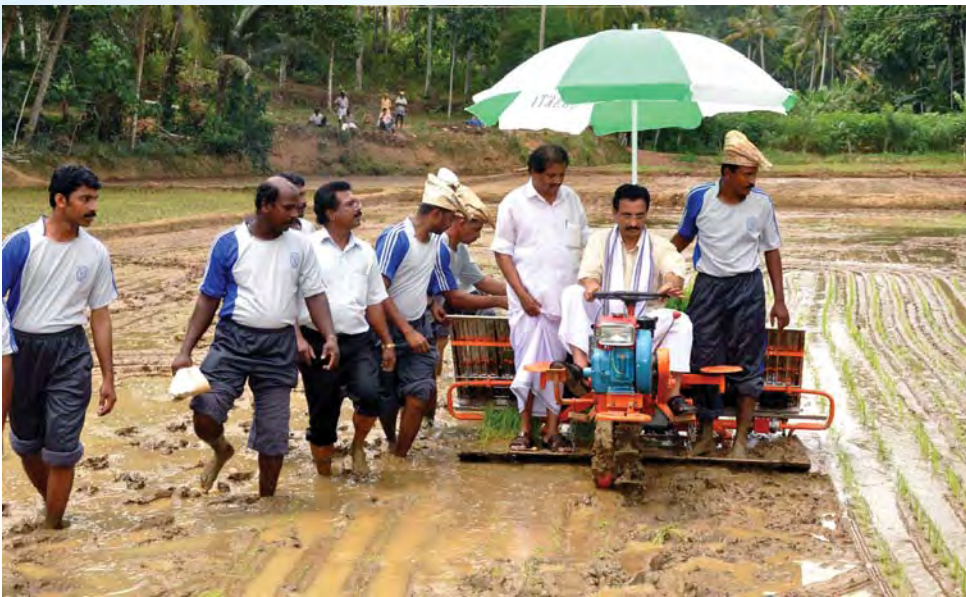
നെൽപ്പാടങ്ങളിലെ യന്ത്രവൽക്കരണത്തിനായി മിത്രനികേതൻ കൃഷി വിജ്ഞാന കേന്ദ്രം രൂപം നൽകിയ മിത്രകർമ്മസേനയുടെ ഉദ്ഘാടനം കൃഷിമന്ത്രി നിർവഹിക്കുന്നു

കാർഷികോത്പാദനം വർദ്ധിപ്പിക്കുന്നതിന് ഊന്നൽ നൽകുന്നതോടൊപ്പം കർഷക ക്ഷേമവും ഉറപ്പാക്കുകയെന്ന നയത്തിന്റെ ഭാഗമായി രണ്ടു ഹെക്ടറിനു താഴെ ഭൂമിയുള്ള ചെറുകിട നാമമാത്ര കർഷകർക്ക് പ്രതിമാസം 400 രൂപ പെൻഷൻ അനുവദിക്കുകയും ഏതാണ്ട് 207844 കർഷകർ ഇതിന്റെ ഗുണഭോക്താക്കളായി മാറുകയും ചെയ്തു. 2013-14 ബജറ്റിൽ കർഷക പെൻഷൻ 500 രൂപയായി വർദ്ധിപ്പിക്കുകയും ചെയ്തിട്ടുണ്ട്.