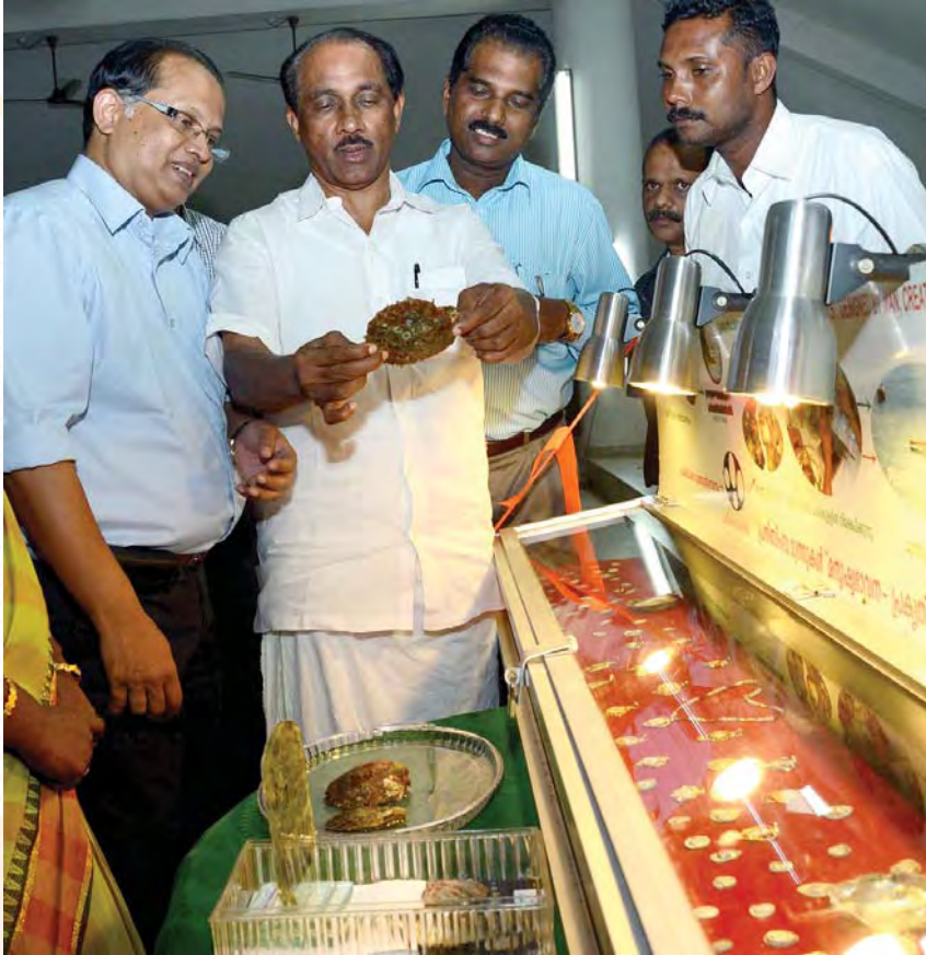
ഡിസൈനർ മുത്തുത്പാദന സാങ്കേതികവിദ്യ പരിശീലനപരിപാടിയുടെ ഭാഗമായ പ്രദർശനം കാണുന്ന മന്ത്രി കെ. ബാബു

തുറമുഖം 590 കിലോമീറ്റർ കടൽത്തീരമുള്ള കേരളത്തിൽ തുറമുഖങ്ങളുടെ പ്രസക്തി വളരെ വലുതാണ്. ആർക്കും വേണ്ടാതെ അവഗണിക്കപ്പെട്ടു കിടന്നിരുന്ന ഒരു വകുപ്പായിരുന്നു തുറമുഖ വകുപ്പ്. വകുപ്പിന് സ്വന്തമായി ഒരു ആസ്ഥാന മന്ദിരമുണ്ടായതു