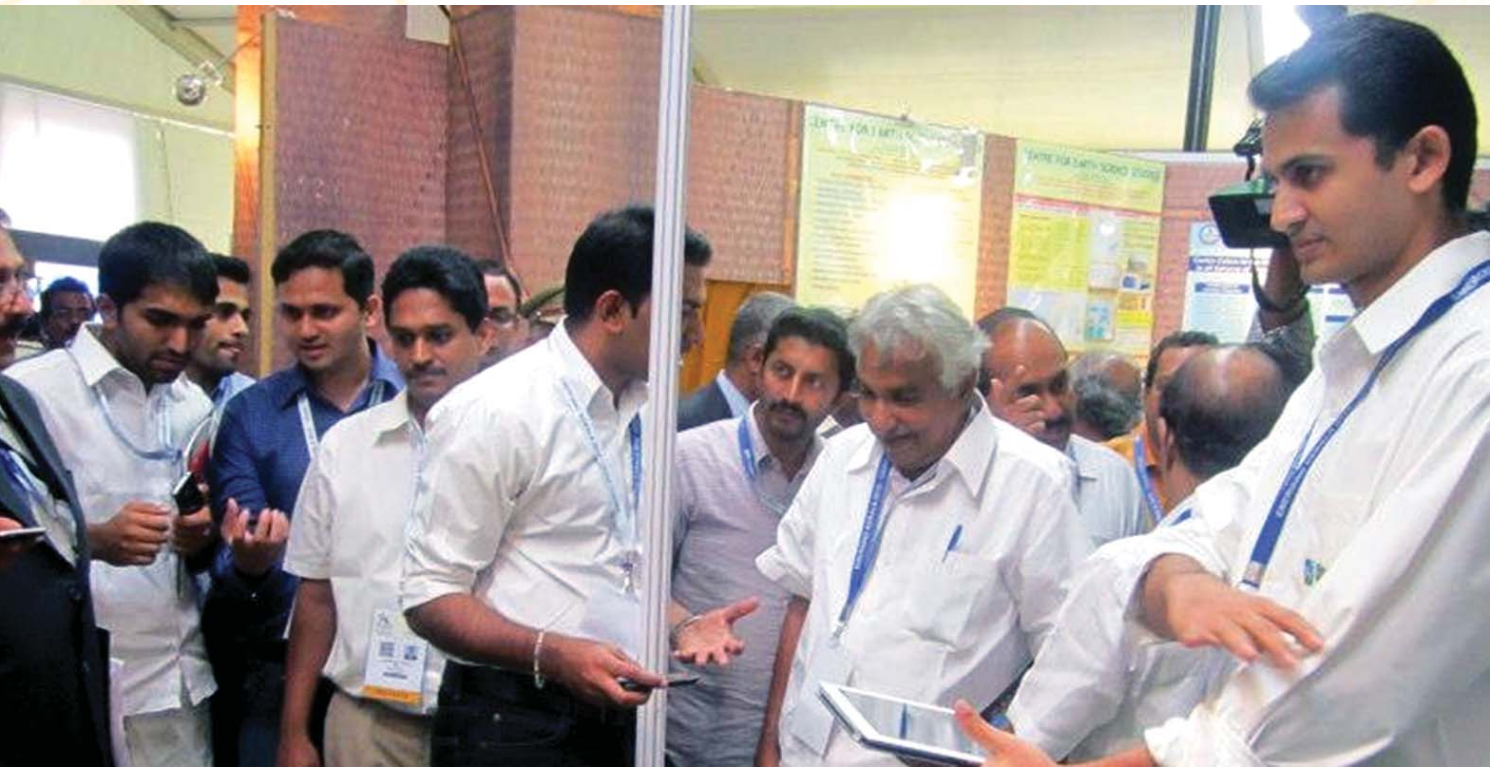
യുവസംരംഭകരോടൊത്ത് : എമർജിങ് കേരളയിലെ സ്റ്റാർട്ട് അപ് വില്ലേജിന്റെ പവലിയൻ സന്ദർശിക്കുന്ന മുഖ്യമന്ത്രി

ആശയങ്ങളെ സംരംഭങ്ങളാക്കാൻ യുവാക്കളെയും വിദ്യാർഥികളെയും സഹായിക്കുന്ന നൂതന സംരംഭമാണ് സ്റ്റാർട്ട് അപ് വില്ലേജുകൾ. എറണാകുളത്ത് കളമശ്ശേരിയിൽ ആദ്യത്തെ സ്റ്റാർട്ട് അപ് വില്ലേജ് പ്രവർത്തനം തുടങ്ങിയിട്ടുണ്ട്. പുതിയ സംരംഭക സംസ്കാരം പ്രോത്സാഹിപ്പിക്കാൻ ഉദ്ദേശിച്ചുള്ള ഇവിടെ കെട്ടിട വാടകയൊന്നും ഈടാക്കുന്നില്ല. വെള്ളം, വൈദ്യുതി, മെയിന്റനൻസ് ഇനത്തിലായി നാമമാത്രമായ തുകയേ ഈടാക്കുന്നുള്ളൂ. സ്റ്റാർട്ട് അപ് വില്ലേജിലെ വിദ്യാർഥി സംരംഭകർക്ക് നാലു ശതമാനം വരെ ഗ്രേസ് മാർക്കും ഇരുപതു ശതമാനം വരെ ഹാജർ ഇളവും സർവകലാശാലകൾ നൽകും. ഒന്ന്-രണ്ട് വർഷത്തിനുള്ളിൽ സ്റ്റാർട്ട് അപ് വില്ലേജിൽനിന്ന് പൂർണ്ണ സംരംഭകരായി ഇറങ്ങുന്ന ആദ്യബാച്ച് തൊഴിൽ അന്വേഷകരാവില്ല, തൊഴിൽ ദാതാക്കളായി മാറും. ■