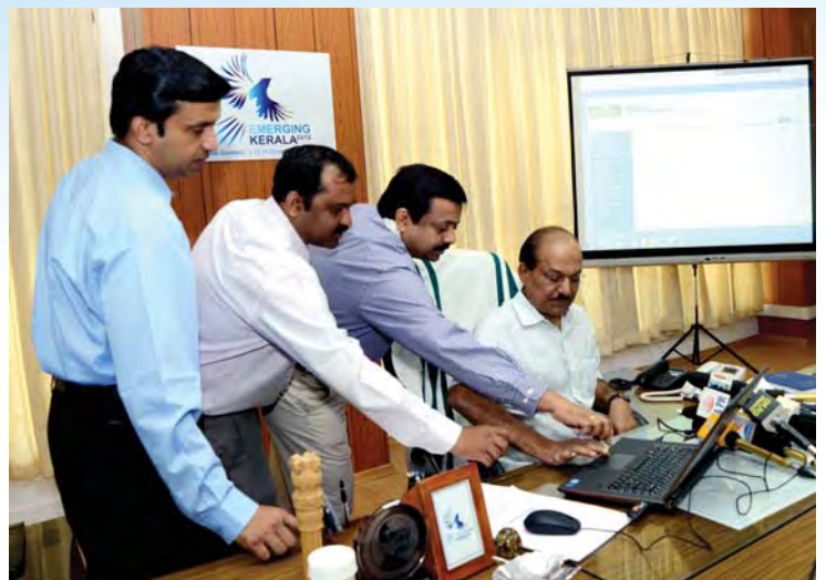
പുരം ജില്ലാതല ഉദ്ഘാടനവും സംസ്ഥാനമാകെ നടപ്പാക്കിയതിന്റെ നിർവഹിക്കുന്നു