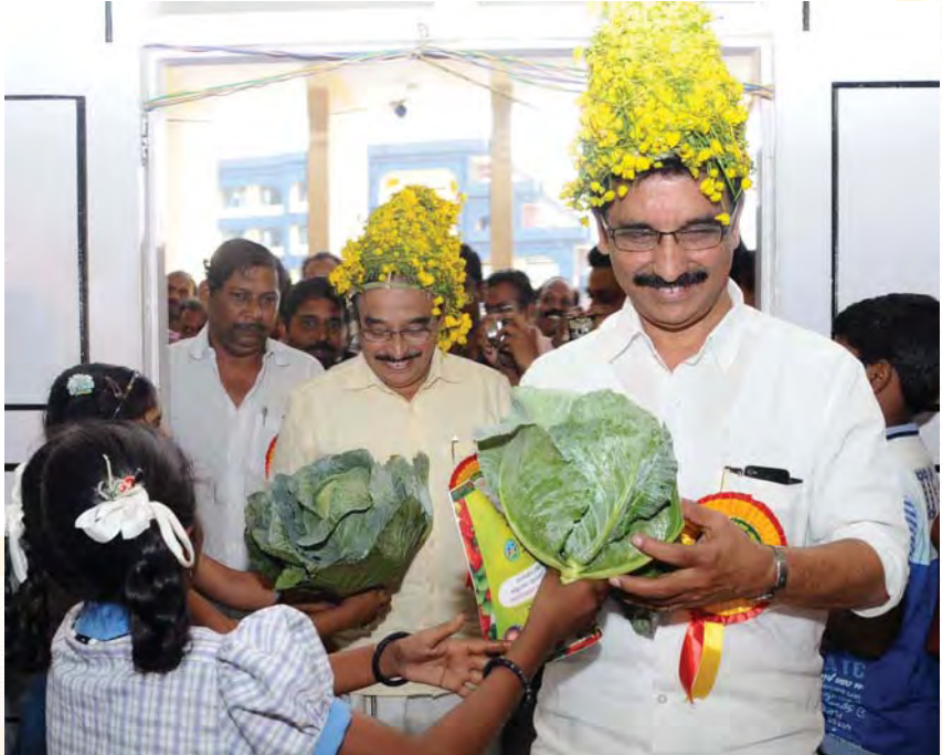
പച്ചക്കറി വികസന പദ്ധതി ഉദ്ഘാടനത്തിനെത്തിയ മന്ത്രിമാരെ കുട്ടികൾ സ്വീകരിച്ചപ്പോൾ

സ്വയംപര്യാപ്തത കൈവരിപ്പിക്കുവാനും ജൈവ കൃഷി നടത്തുവാനും. കേരളത്തെ 2016 ആകുമ്പോഴേക്കും ഒരു ജൈവസംസ്ഥാനമാക്കി മാറ്റുകയെന്നതാണ് നാലക്ഷ്യമിടുന്നത്. അതിന് യുവതലമുറയുടെയും പ്രത്യേകിച്ച് വിദ്യാർത്ഥികളുടെയും പൂർണ്ണ സഹകരണവും സാന്നിധ്യവും അനിവാര്യമാണ്. അതു കൂടുതൽ നേടിയെടുത്ത് മുന്നോട്ടു പോകുമ്പോൾ മുഴുവൻ ജനവിഭാഗത്തിന്റെയും സഹായസഹകരണങ്ങൾ ഉണ്ടാകുമെന്ന് പ്രത്യാശിക്കുന്നു. ■