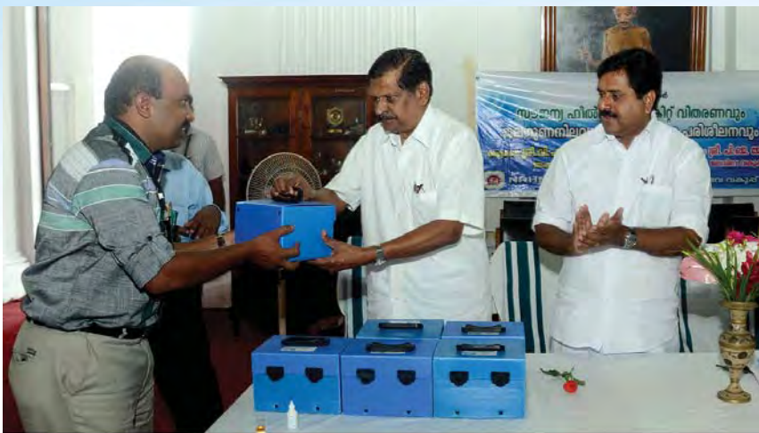
ജലഗുണനിലവാര പരിശോധനാ പരിശീലനവും സൗജന്യ ഫീൽഡ് ടെസ്റ്റ് കിറ്റ് വിതരണവും: സംസ്ഥാനതല ഉദ്ഘാടനം മന്ത്രി പി.ജെ. ജോസഫ് നിർവഹിക്കുന്നു.

സംസ്ഥാനം നേരിടുന്ന വരൾച്ചയുടെ പശ്ചാത്തലത്തിൽ എല്ലാ ഗ്രാമ പഞ്ചായത്തിലും ജലസംരക്ഷണ പ്രവർത്തനങ്ങൾ സംഘടിപ്പിക്കുന്നതിനായി 100 പേരുടെ ജലകർമ്മസേന രൂപീകരിച്ചു. വരൾച്ചയെ പ്രതിരോധിക്കുന്നതിനും എല്ലാ ഗ്രാമപഞ്ചായ