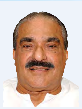
■ കെ.എം. മാണി ധന മന്ത്രി

വ രുചെലവുകളുടെ ട്രപ്പിസിൽ വിരസമായ ഒരുധാരാളം പോലെ വായിച്ചുതീർത്തിരുന്ന ധനവകുപ്പിന് മനുഷ്യമുഖം നൽകിയെന്നതാണ് കഴിഞ്ഞ രണ്ടുകൊല്ലത്തെ ഏറ്റവും പ്രധാനമായ നേട്ടം. സമസ്തമേഖലകളിലും ഉണർവിന്റെ കാലഘട്ടമായിരുന്നു ഇത്. വീകസനത്തിന്റെ വസന്തം വിരിയിക്കാനും കാര്യങ്ങളുടെ വിരൽസ്പർശമായി മാറാനും ധന-നിയമ-ഭവനനിർമ്മാണ വകുപ്പുകൾക്കു കഴിഞ്ഞുവെന്നത് ചാരിതാർത്ഥ്യജനകമാണ്.