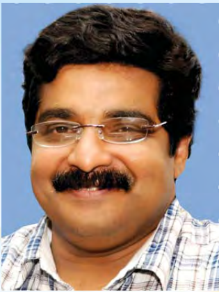
■ ഡോ. എം.കെ. മുനീർ പഞ്ചായത്ത്-സാമൂഹികനീതി മന്ത്രി

നമ്മുടെ ഭരണഘടനയുടെ 73, 74 ഭേദഗതികൾ ചരിത്രപ്രധാനമാണ്. ഇന്ത്യൻ പൗരന്റെ ജനാധിപത്യാവകാശങ്ങളും അധികാരങ്ങളും അർത്ഥശങ്കക്കിടയില്ലാത്തവിധം അരക്കിട്ടുറപ്പിച്ച ഈ ഭേദഗതികൾ അധികാരവികേന്ദ്രീകരണവും വികേന്ദ്രീകൃതസൂത്രണവും സംസ്ഥാനങ്ങളിൽ നടപ്പാക്കാൻ പ്രേരകമായി. 'ബിങ് ബാൻക്' സമീപനം സ്വീകരിച്ച കേരളം ഇതര സംസ്ഥാനങ്ങളേക്കാൾ വളരെ വേഗം മുൻപന്തിയിലെത്തി. ഇതിന്റെ ഏറ്റവും നല്ല ഉദാഹരണങ്ങളാണ് പഞ്ചായത്തിരാജ് സംവിധാനം ഏറ്റവും കാര്യക്ഷമമായി നടപ്പാക്കുന്നതിനുള്ള അഖിലേന്ത്യ ബഹുമതിക്ക് തുടർച്ചയായി അർഹമാകുന്നത്. ഈ വർഷവും പഞ്ചായത്ത് രാജ് ദിനാഘോഷച്ചടങ്ങിൽ ദില്ലിയിൽ വച്ച് പ്രധാനമന്ത്രി മൻമോഹൻ സിങ്ങിൽ നിന്ന് ഈ ബഹുമതി ഏറ്റുവാങ്ങാനുള്ള അവസരം എനിക്കു ലഭിച്ചു.