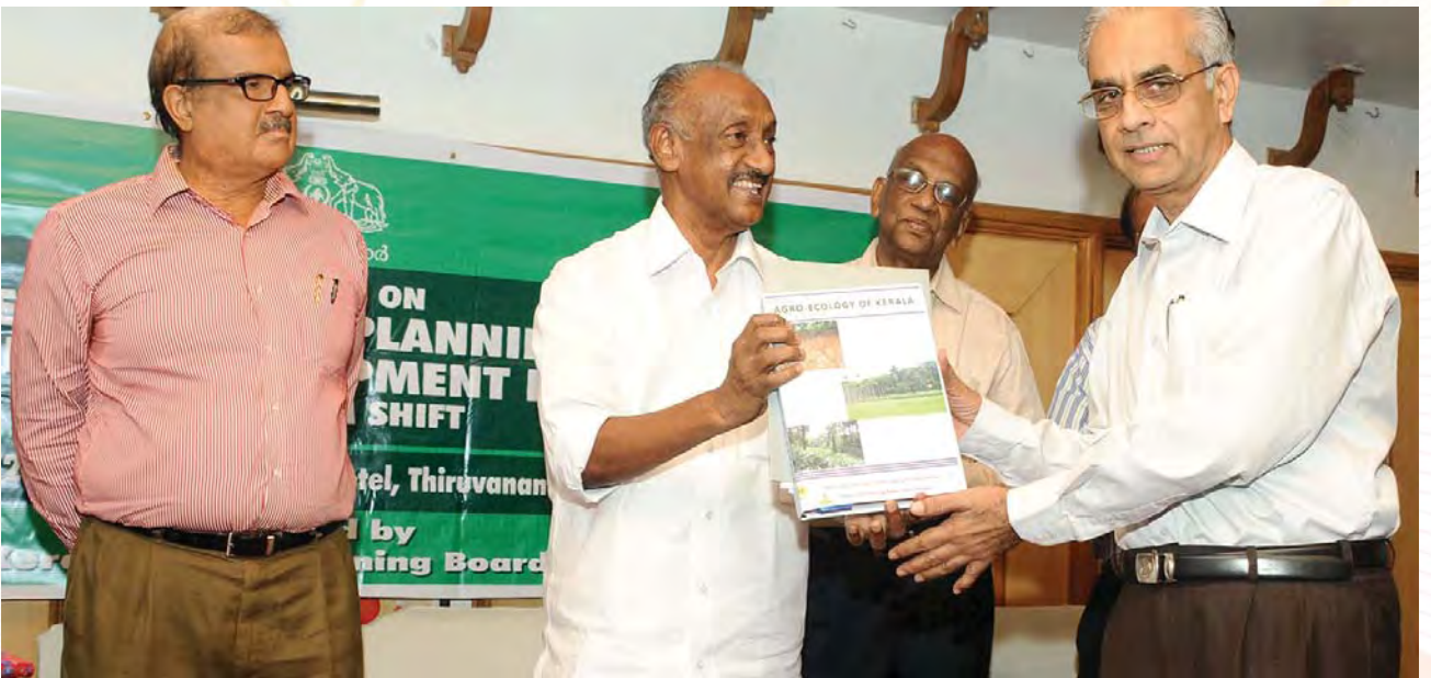
കാർഷിക-പാരിസ്ഥിതിക ആസൂത്രണത്തിലൂടെ സംസ്ഥാനത്തെ കൃഷി വികസനം സെമിനാർ മന്ത്രി കെ.സി. ജോസഫ് ഉദ്ഘാടനം ചെയ്യുന്നു

വികേന്ദ്രീകൃതസൂത്രണം നടപ്പാക്കിയെങ്കിലും പദ്ധതി നടത്തിപ്പിൽ തിരഞ്ഞെടു