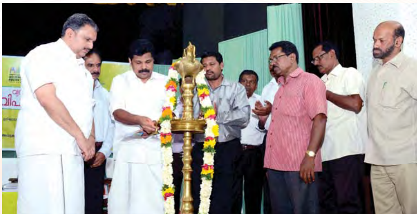
ജി.കെ.എസ്.എഫ്, വി.ജെ.ടി. ഹാളിൽ ആരംഭിച്ച മെഗാ ട്രേഡ് ഫെയർ മന്ത്രി എ.പി. അനിൽകുമാർ ഉദ്ഘാടനം ചെയ്യുന്നു.

ടൂറിസം വികസനത്തിൽ പ്രാദേശികമായ സന്തുലനം അനിവാര്യമാണെന്നു