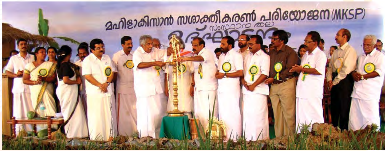
മഹിളാകിസാൻ സശക്തീകരണ പരിയോജന സംസ്ഥാനതല ഉദ്ഘാടനം മഖ്യമന്ത്രി ഉമ്മൻ ചാണ്ടി നിർവഹിക്കുന്നു

രാജീവ് ആവാസ്യോജന പദ്ധതിക്കായി കേരളത്തിൽ വികസിപ്പിച്ച എം.ഐ.എസ്.