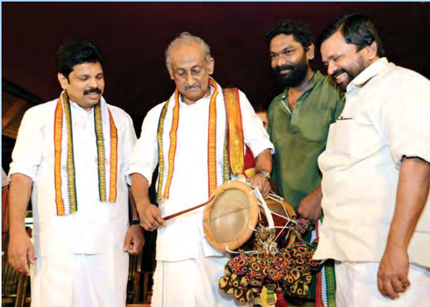
താളം ഫെസ്റ്റിവലിന്റെ ഉദ്ഘാടന ചടങ്ങ് മന്ത്രി കെ.സി. ജോസഫ് നിർവഹിക്കുന്നു

അന്തർദ്ദേശീയ പഠന കേന്ദ്രത്തിന്റെ പുതിയ മന്ദിരം പണിപൂർത്തിയാക്കുകയും ചെയ്തു.