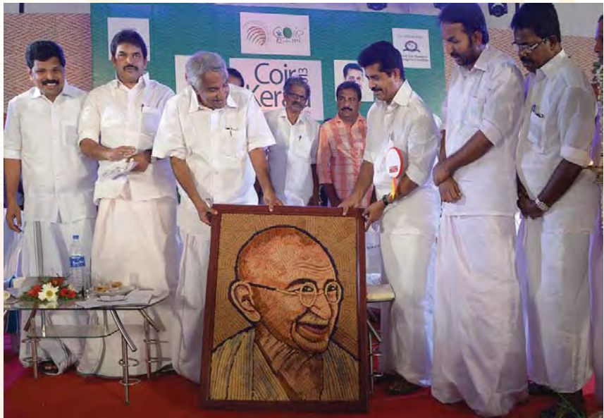
കയർ കേരള ഫെസ്റ്റിവലിന്റെ ഉദ്ഘാടന വേദിയിൽ