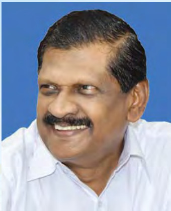
■ പി.ജെ.ജോസഫ് ജലവിഭവ മന്ത്രി

9 ഴയുടെ കുളിരും സുഖവും അനുഭവിക്കാൻ വിദേശികൾ ആഴ്ചകളോളം വന്നു താമസിക്കുന്ന നാടാണു കേരളം. ഇടവപ്പാതിയും തുലാമഴയും, ചുട്ടുപൊള്ളി പനിച്ചു കിടക്കുന്ന മണ്ണിലേക്ക് അവിചാരിതമായി പെയ്തു വീഴുന്ന വേനൽ മഴയും..... 44 നദികളും തടാകങ്ങളും തണ്ണീർത്തടങ്ങളും മറ്റനേകം തോടുകളും അരുവികളും എന്നു വേണ്ട, ജലസമ്പന്നതയ്ക്കും ഹരിത സമൃദ്ധിക്കും പേരുകേട്ട നാട്. ഇത് ഒരുവശം. മറുവശത്ത് ഭൂമിയുടെ ജലസംഭരണികളായ പാടങ്ങൾ നികത്തി, കിണറുകൾ വറ്റി, കുളങ്ങൾ തുർന്ന്, നദികൾ മണൽക്കുഴികളായി, നഗരങ്ങളും ഗ്രാമങ്ങളും ഒരു പോലെ കുടിവെള്ളത്തിനായി പരക്കെ പായുന്ന കാഴ്ചകൾ എങ്ങും..... ഈ വൈരുദ്ധ്യങ്ങൾക്കിടയിൽ ഉത്തരവാദിത്വപൂർവ്വം പ്രവർത്തിക്കുക എന്ന വെല്ലുവിളിയാണ് യു.ഡി.എഫ് സർക്കാർ രണ്ടു വർഷം മുമ്പ് ഏറ്റെടുത്തത്. ആ കടമ നിറവേറ്റുകയാണ് ജലവിഭവ വകുപ്പിന്റെ പ്രവർത്തനങ്ങൾ.