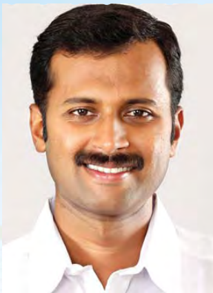
■ അനൂപ് ജേക്കബ് ഭക്ഷ്യ-സിവിൽ സപ്ലൈസ്-രജിസ്ട്രേഷൻ മന്ത്രി

ഭക്ഷ്യ-സിവിൽ സപ്ലൈസ്-രജിസ്ട്രേഷൻ വകുപ്പുകളെ സംബന്ധിച്ചിടത്തോളം പ്രവർത്തന ചടങ്ങുകളുടെയും കർമ്മകുശലതയുടെയും രണ്ടു സംവത്സരമാണ് കടന്നുപോയത്. ദീർഘകാലവികസനത്തിന് മുതൽക്കൂട്ടാവുന്ന ഒട്ടേറെ പ്രവർത്തനങ്ങളും തീരുമാനങ്ങളും ഈ കാലയളവിലുണ്ടായി.