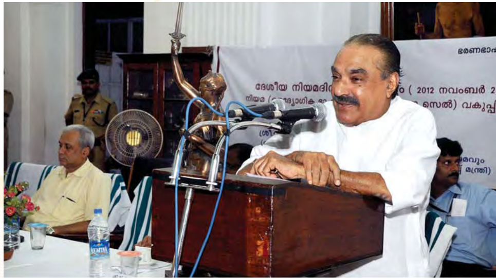
നിയമദിനാഘോഷം സെക്രട്ടേറിയറ്റിലെ ദർബാർ ഹാളിൽ ധനകാര്യ-നിയമ മന്ത്രി കെ.എം. മാണി ഉദ്ഘാടനം ചെയ്യുന്നു

നിയമസേവനം ആവശ്യക്കാർക്ക് അടുത്തേക്കു സഞ്ചരിക്കുന്ന ലോക് അദാലത്തിനു തുടക്കം കുറിച്ചു. ഈ വാഹനം ഗ്രാമീണ, ഗിരിവർഗ മേഖലകൾ സന്ദർശിച്ച് നിയമബോധന ക്ലാസുകളും തർക്കപരിഹാര അദാലത്തുകളും നടത്തിവരുന്നു. ദുർഗുണപരിഹാര പാഠശാലകളിലും ജുവനൈൽ ഹോമുകളിലുമുള്ള അന്തേവാസികൾക്ക് കൗൺസിലിങ് സൗകര്യം ഏർപ്പെടുത്തി. ഇതിന് ഉദ്ഘാടനം ജനുവരി 27 ന് ചീഫ് ജസ്റ്റിസ് നിർവഹിച്ചു.