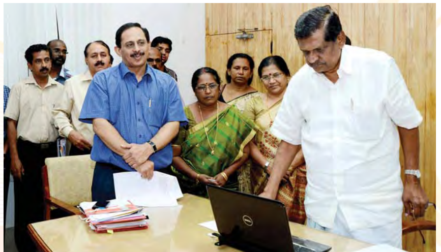
ജലസേചന വകുപ്പിലെ ഇ-ടെൻഡറിങ് സംവിധാനം മന്ത്രി പി.ജെ. ജോസഫ് ഉദ്ഘാടനം ചെയ്യുന്നു

ടെൻഡർ നടപടികളിലെ ഇടപെടലുകൾ ഒഴിവാക്കി സുതാര്യത കൈവരിക്കുവാൻ ടെൻഡറുകൾ ഇ-ടെൻഡറിങ് ചെയ്തുവരുന്നു.