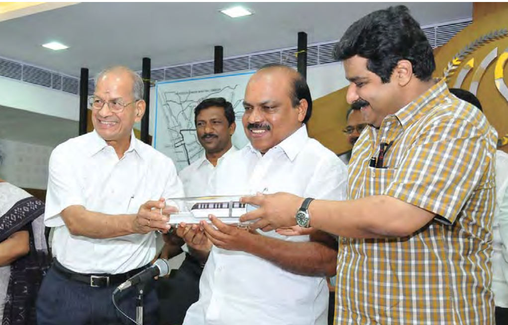
കോഴിക്കോട് മോണോറെയിലിന്റെ മാതൃക ഇ. ശ്രീധരൻ മന്ത്രിക്ക് കൈമാറുന്നു. മന്ത്രി എം.കെ. മുനീർ സമീപം

നഗരങ്ങളിലും പ്രധാന റോഡുകളിലും മാത്രമല്ല വികസനം ഉണ്ടാകേണ്ടതെന്ന തിരിച്ചറിവ് നമ്മുടെ സൽക്കാരിനുണ്ട്. സമഗ്രവികസനം മുന്നിൽക്കണ്ടാണ് തദ്ദേശസ്ഥാപനങ്ങളുടെ കീഴിലെ റോഡുകൾ മേജർ ഡിസ്ട്രിക്ട് റോഡുകളായി ഉയർത്താൻ നാം തീരുമാനമെടുത്തത്.