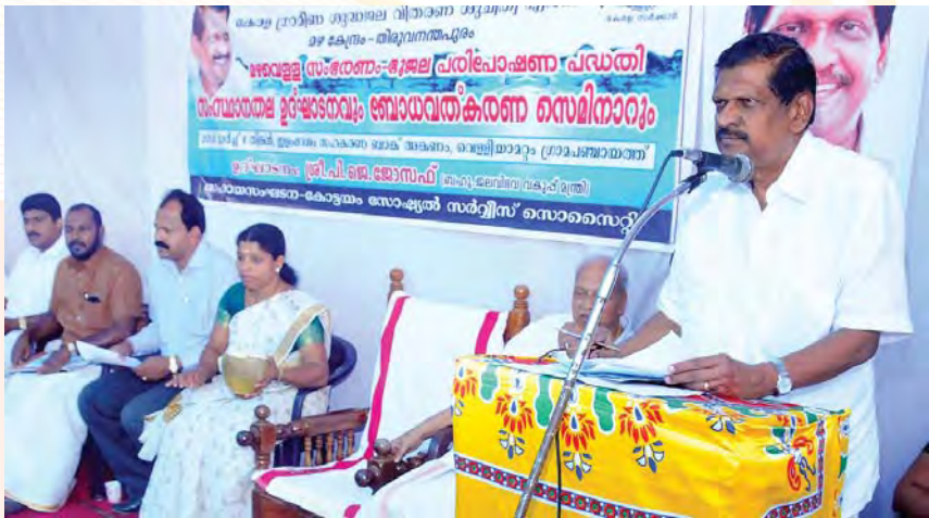
മഴവെള്ള സംഭരണം-ഭൂജല പരിപോഷണപദ്ധതിയുടെ സംസ്ഥാനതല ഉദ്ഘാടനം വെള്ളിയായറ്റം ഗ്രാമപഞ്ചായത്തിൽ മന്ത്രി പി.ജെ. ജോസഫ് നിർവഹിക്കുന്നു

കേരളത്തിലെ 112 ഗ്രാമപഞ്ചായത്തുകളിലെ പ്രവർത്തനത്തിലൂടെ, പദ്ധതി ലക്ഷ്യമായ 2500 സ്കീമുകൾ എന്നത് കടന്ന്, 3710 സ്കീമുകൾ ജലനിധി കമ്മീഷൻ ചെയ്തു. ഇതിലൂടെ 1.88 ലക്ഷം കുടുംബങ്ങൾക്കും, 11.11 ലക്ഷം ഗുണഭോക്താക്കൾക്കും ശുദ്ധജലം ലഭിച്ചു. ഗ്രാമീണ മേഖലയിൽ, 92,217 ശുചിത്വ സംവിധാനങ്ങൾ, 89,319 പരിസ്ഥിതി സംരക്ഷണ സംവിധാനങ്ങൾ, നാലായിരത്തിലധികം ഗുണഭോക്തൃസംഘങ്ങൾ, അൻപതോളം സഹായസംഘടനകൾ, 1013 ഗുണഭോക്തൃ സമിതികളുടെ നേതൃത്വത്തിൽ പ്രത്യേക ഭൂജല സംവർദ്ധന പരിപാടികൾ, 13,304 മഴവെള്ള സംഭരണ