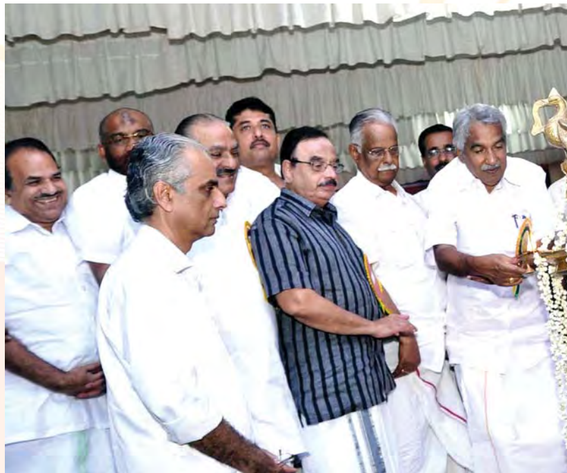
മലയാള സർവകലാശാല ഉദ്ഘാടനം തുഞ്ചൻപറമ്പിൽ മുഖ്യമന്ത്രി ഉമ്മൻചാണ്ടി നിർവഹിക്കുന്നു

കേരളത്തിലെ വിദ്യാർത്ഥികളും വിദ്യാഭ്യാസരംഗവും അതിവേഗം ലോകോത്തര നിലവാരത്തിലേക്കു കുതിച്ചുകൊണ്ടിരിക്കുകയാണ്. വാർത്താവിനിമയരംഗത്തുണ്ടായ വിപ്ലവം മൂലം ലോകത്തിലെ ഏത് അറിവും പുരോഗതിയും തത്സമയം അറിയാനുള്ള ശേഷി ലോകം നേടിയപ്പോൾ, നമ്മുടെതുപോലുള്ള ഒരു സംസ്ഥാനത്തിന് അതിൽ പങ്കെടുത്ത് വിജയം വരിച്ച് ലോകത്തിനു മുമ്പിൽ അഭിമാനത്തോടെ നിൽക്കാതിരിക്കാൻ കഴിയില്ല. വിദ്യാഭ്യാസരംഗത്ത് ഏതു മാർഗം അവലംബിച്ചാലാണ് മുന്നേറാൻ കഴിയുന്നതെന്നു പഠിക്കാനും മനസ്സിലാക്കാനും അതുകൊണ്ടുതന്നെ നാം ശ്രദ്ധിച്ചു. വിദ്യാഭ്യാസരംഗത്തിന്റെ കരുത്താണ് കേരളത്തിന്റെ ശക്തിയും സമ്പത്തും എന്ന നിലവന്നത് അത്തരം കാഴ്ചപ്പാടിലൂന്നിയ പദ്ധതികൾ ആവിഷ്കരിക്കാൻ കഴിഞ്ഞതുമാണ്. പ്രാഥമിക വിദ്യാഭ്യാസതലം മുതൽ ഉന്നത വിദ്യാഭ്യാസ ശ്രേണിവരെ ഓരോ ഘട്ടത്തിലും സൂക്ഷ്മമായ പരിരക്ഷണ വ്യഗ്രതയോടെ സർക്കാർ ഇടപെട്ടുകൊണ്ടുണ്ടായ നേട്ടത്തിനു പകരംവെക്കാവുന്ന