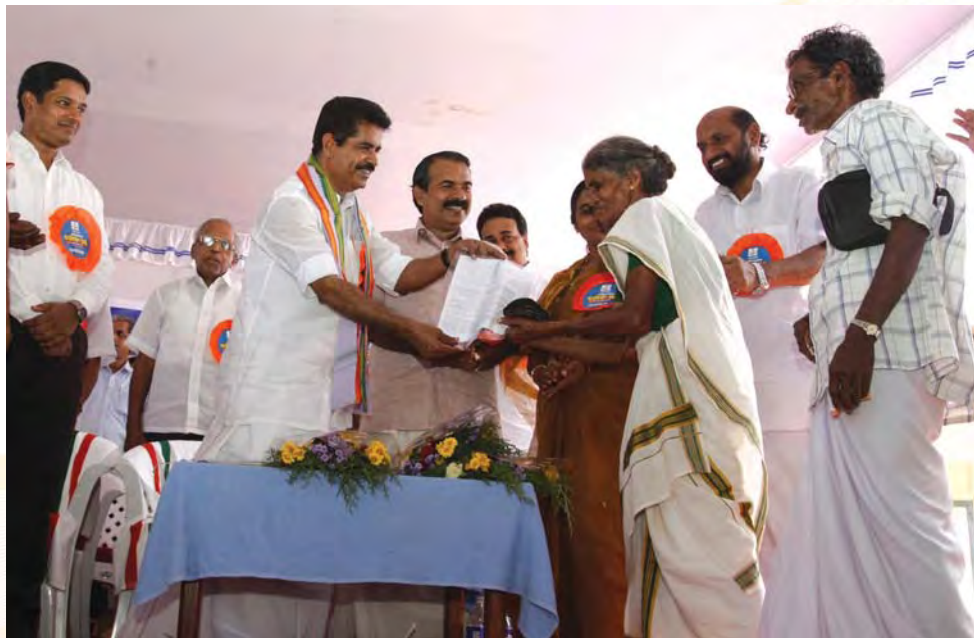
കണ്ണൂർ ജില്ലയിൽ പട്ടയവിതരണം നിർവഹിക്കുന്ന മന്ത്രി അടൂർ പ്രകാശ്

വിവിധ ക്ഷേമ സമാശ്വാസ പദ്ധതികളിലായി 1348 കോടി രൂപയിലധികം ധനസഹായം നടപ്പുസാമ്പത്തികവർഷം നൽകിയിട്ടുണ്ട്. സർക്കാരിന്റെ നൂറുദിന കർമ്മപരിപാടി മുഖ്യമന്ത്രിയുടെ ജനസമ്പർക്ക പരിപാടി, വിവിധ ജില്ലകളിൽ നടന്ന ഫയൽ തീർപ്പാക്കൽ അദാലത്തുകൾ എന്നിവയി