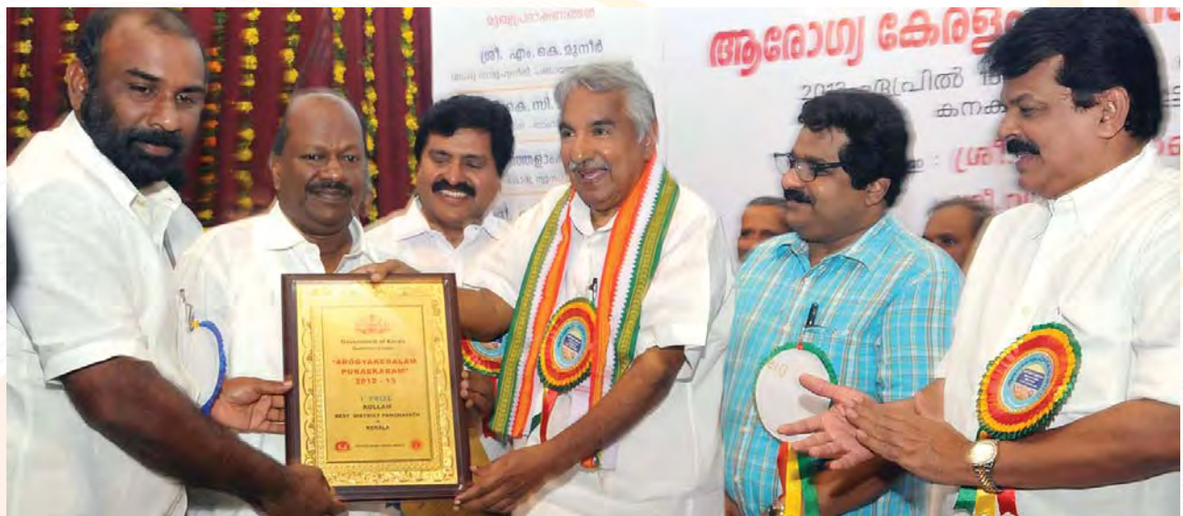
ആരോഗ്യകേരളം പുരസ്കാരം മുഖ്യമന്ത്രി വിതരണം ചെയ്യുന്നു

വിവിധ സർക്കാരാശുപത്രികളിലെ റേഡിയേഷൻ സുരക്ഷാ വിഭാഗങ്ങൾ, ഡയറക്ടറേറ്റ് ഓഫ് റേഡിയേഷൻ സേഫ്റ്റി മുഖാന്തിരം ശക്തിപ്പെടുത്തി. ആറായിരത്തോളം എക്സ്-റേ, സി.ടി. സ്കാൻ, മാമോഗ്രാഫി, കാത്ലാബ് യൂണിറ്റുകളിൽ 80 ശതമാനത്തിലും റേഡിയേഷൻ സുരക്ഷാ മാന