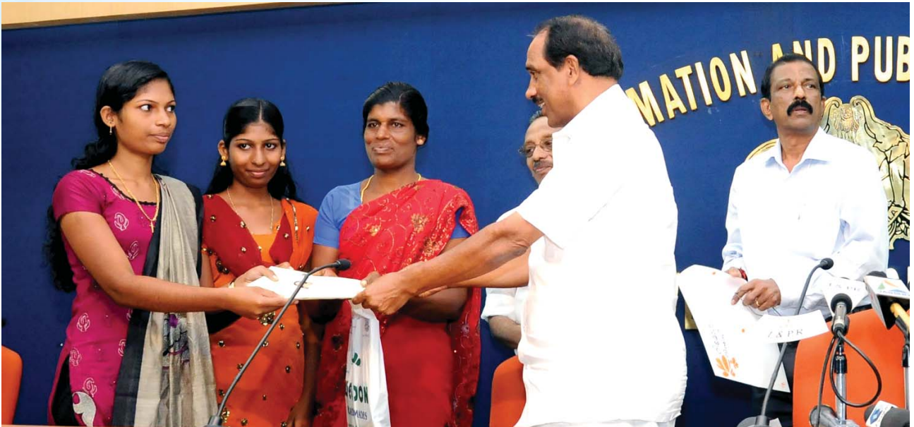
വിഴിഞ്ഞം അന്താരാഷ്ട്ര തുറമുഖ വികസനത്തിനായി ഭൂമി നൽകിയവർക്കുള്ള പുനരധിവാസ പാക്കേജ് പ്രകാരമുള്ള രേഖകൾ ഫിഷറീസ് മന്ത്രി കെ. ബാബു കൈമാറുന്നു

ലൂടെ ജനങ്ങൾക്കു ലഭിക്കുന്ന പ്രഥമ നേട്ടമാണിത്. വൈദ്യുതി എത്തിക്കുന്നതിനുള്ള ടെൻഡർ ക്ഷണിച്ചു. റെയിൽ നിർമ്മാണം സംബന്ധിച്ച് കേന്ദ്ര സർക്കാർ ലാസ്റ്റ് മെയിൽ കണക്ടിവിറ്റിയിലുൾപ്പെടുത്തി കഴിഞ്ഞ ബജറ്റിൽ ഉൾപ്പെടുത്തിയിട്ടുണ്ട്. ഇതിനായി റെയിൽ വികാസ് നിഗം ലിമിറ്റഡ് സർവ്വേ പൂർത്തിയാക്കിക്കഴിഞ്ഞു. ഇന്ത്യൻ റെയിൽവേ ഇത് അംഗീകരിച്ചുകഴിഞ്ഞാൽ സ്ഥലമേറ്റെടുക്കൽ നടപടി കളാരംഭിക്കും. 600 മീറ്റർ നീളമുള്ള താൽകാലിക റോഡിന്റെ നിർമ്മാണ പ്രവർത്തനങ്ങൾ പൂർത്തിയാക്കിയെങ്കിലും എൻ.എച്ച് 47 ബൈപ്പാസുമായി ബന്ധിപ്പിക്കുന്ന പ്രധാന റോഡിന്റെ നിർമ്മാണം ബൈപ്പാസ് ആയതിനുശേഷം മാത്രമേ ആരംഭിക്കാൻ കഴിയൂ.