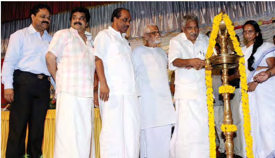
എക്സൈസ് വകുപ്പ് കുടുംബശ്രീയിലൂടെ നടപ്പാക്കുന്ന ലഹരിവിരുദ്ധ ബോധവൽക്കരണ പരിപാടിയുടെ സംസ്ഥാനതല ഉദ്ഘാടനം മുഖ്യമന്ത്രി ഉമ്മൻചാണ്ടി നിർവഹിക്കുന്നു