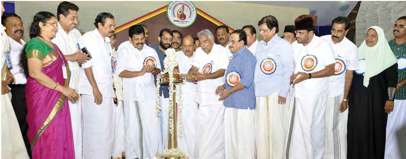
സംസ്ഥാന സ്കൂൾ യുവജനോത്സവം തിരുവിൽ മുഖ്യമന്ത്രി ഉദ്ഘാടനം ചെയ്യുന്നു

കേരളം വിദ്യാഭ്യാസ വിഷയത്തിൽ ലോകത്തിന് ഒരു മാതൃകയാകണമെന്നാണ് താത്പര്യം. അതിനുള്ള പരിശ്രമമാണ് നടക്കുന്നത്. അതിൽ നമ്മുടെ സംസ്ഥാനത്തിന്റെ സുഗമമായ ഭാവിയ്ക്കൽ താത്പര്യമുള്ള എല്ലാവരും സഹകരിച്ചുവരുന്നു എന്നത് സന്തോഷകരമാണ്. ■