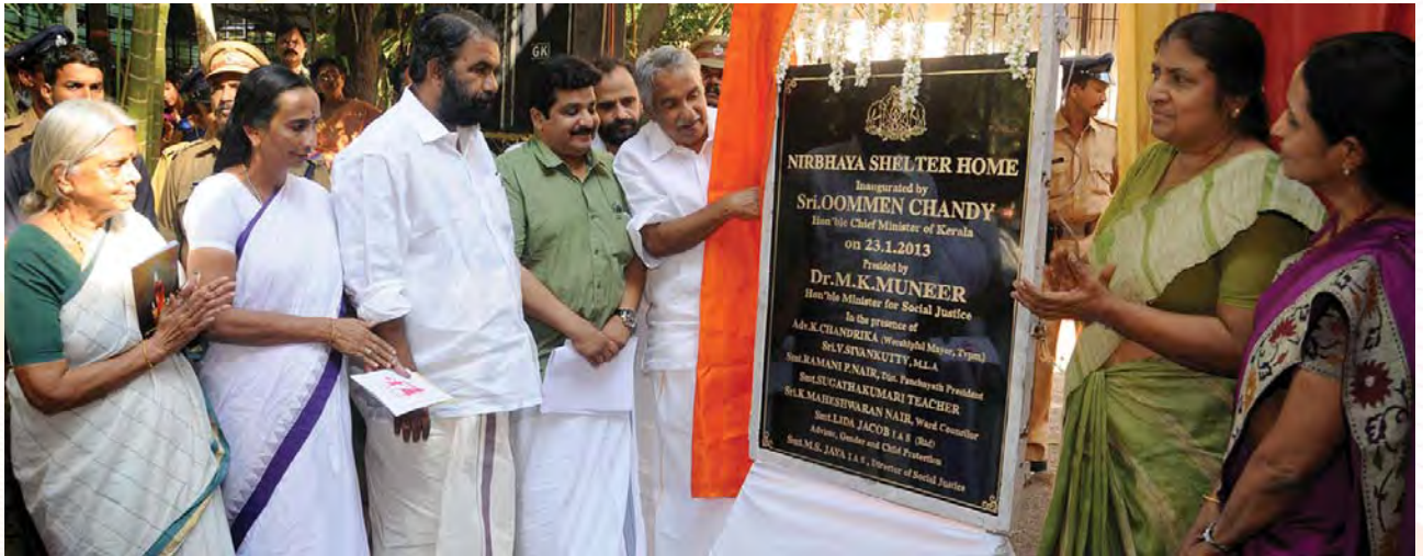
കേരളത്തിലെ ആദ്യത്തെ നിർഭയ ഷെൽട്ടർഹോമിന്റെ ഉദ്ഘാടനം പുഷ്പരയിൽ മുഖ്യമന്ത്രി ഉമ്മൻചാണ്ടി നിർവഹിക്കുന്നു. മന്ത്രി എം.കെ. മുനീർ സമീപം