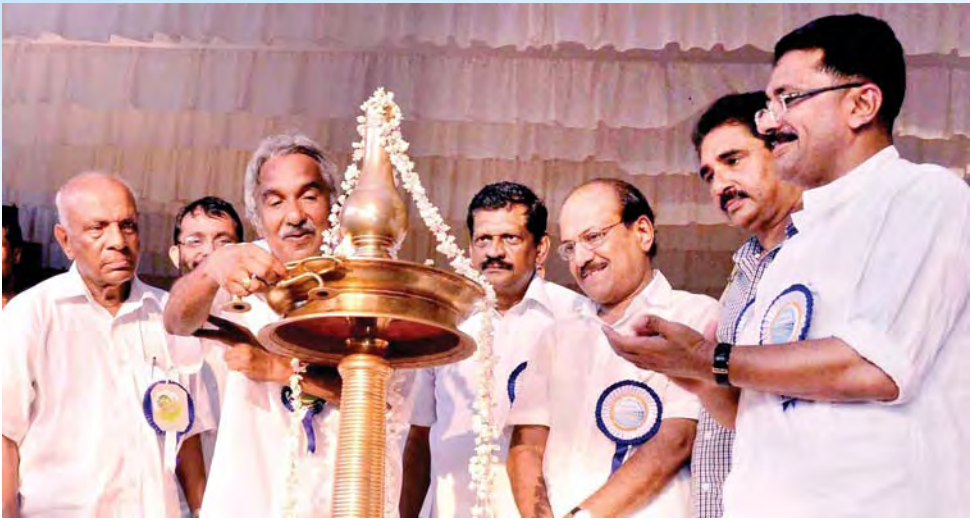
ചമ്രവട്ടം റഗുലേറ്റർ കം ബ്രിഡ്ജ് മുഖ്യമന്ത്രി ഉമ്മൻ ചാണ്ടി ഉദ്ഘാടനം ചെയ്യുന്നു.

കാവേരി ട്രൈബ്യൂണലിന്റെ അവാർഡ് പ്രകാരം കേരളത്തിന് കബനി, ഭവാനി, പാമ്പാർ ബേസിനുകളിൽ ലഭ്യമാകുന്ന 30 റ്റി.എം.സി വെള്ളം പ്രയോജനപ്പെടുത്താനുള്ള പദ്ധതികൾ ത്വരിതപ്പെടുത്തുന്നതാണ്. പാമ്പാർ ബേസിനിൽ ഡാം നിർമ്മിക്കുന്നതിന് 25 കോടി രൂപയുടെ ഭരണാനുമതി നല്കി. ഭവാനി ബേസിനിൽ ലഭ്യമായ