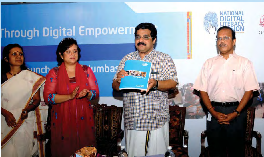
കുടുംബശ്രീ ഡിജിറ്റൽ എംപവർമെന്റ് പദ്ധതിയുടെ കരിക്കുലത്തിന്റെയും സി.ഡി.യുടെയും പ്രകാശനം മന്ത്രി എം.കെ. മുനീർ നിർവഹിക്കുന്നു

കേരളീയ സാമൂഹികജീവിതത്തിൽ കുടുംബശ്രീ സൃഷ്ടിച്ച ചലനങ്ങൾ വികസന മാതൃകയിൽ പുതിയ അധ്യായം എഴുതിച്ചേർക്കുകയാണ്. സ്ത്രീ ശാക്തീകരണ പ്രവർത്തനങ്ങൾ എങ്ങനെ ഗ്രാമതലത്തിൽ പ്രാവർത്തികമാക്കാം എന്നതിന് മികച്ച ഉദാഹരണമാണ് കുടുംബശ്രീ പ്രവർത്തനങ്ങൾ. 238831 കുടുംബങ്ങളെ ഉൾപ്പെടുത്തി 22500 അയൽക്കൂട്ടങ്ങൾ രൂപീകരിച്ചു. പാർശ്വവത്കൃതരുടെ ശാക്തീകരണവും കുടുംബശ്രീയിലൂടെ ഫലപ്രദമായി നടപ്പാ