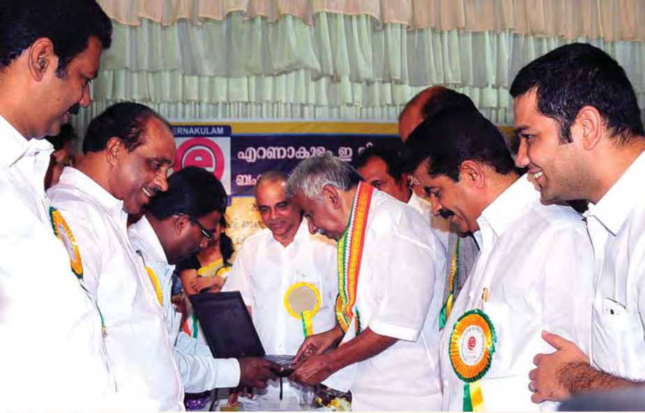
എറണാകുളം ഇ-ജില്ലാ പദ്ധതി മുഖ്യമന്ത്രി ഉമ്മൻ ചാണ്ടി ഉദ്ഘാടനം ചെയ്യുന്നു

സൗദി അറേബ്യയിലെ തദ്ദേശവാതകരണ നിയമമായ നിതാഖത് ഇന്ത്യൻ പ്രവാസികളിൽ ഭീതി വിതച്ചപ്പോൾ സത്വരം സമയം കളയാതെ ഇടപെടാൻ കേരള സർക്കാരിനായി. പത്തു തൊഴിലാളികളിൽ കൂടുതലുള്ള സ്ഥാപനങ്ങളിൽ പത്തുശതമാനം ജോലികൾ തദ്ദേശീയർക്ക് നീക്കിവെക്കുന്ന ഈ നിയമത്തെ കുറിച്ചുള്ള