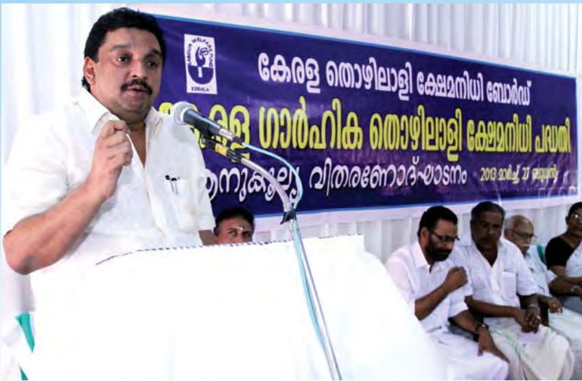
കേരള ഗാർഹിക തൊഴിലാളി ക്ഷേമനിധി പദ്ധതി ആനുകൂല്യവിതരണോദ്ഘാടനം തൊഴിൽമന്ത്രി ഷിബു ബേബിജോൺ നിർവഹിക്കുന്നു

ദിച്ചു. തൊഴിലില്ലായ്മ വേതനവിതരണവും കൃത്യമായിത്തന്നെ പൂർത്തീകരിക്കാൻ കഴിഞ്ഞു.