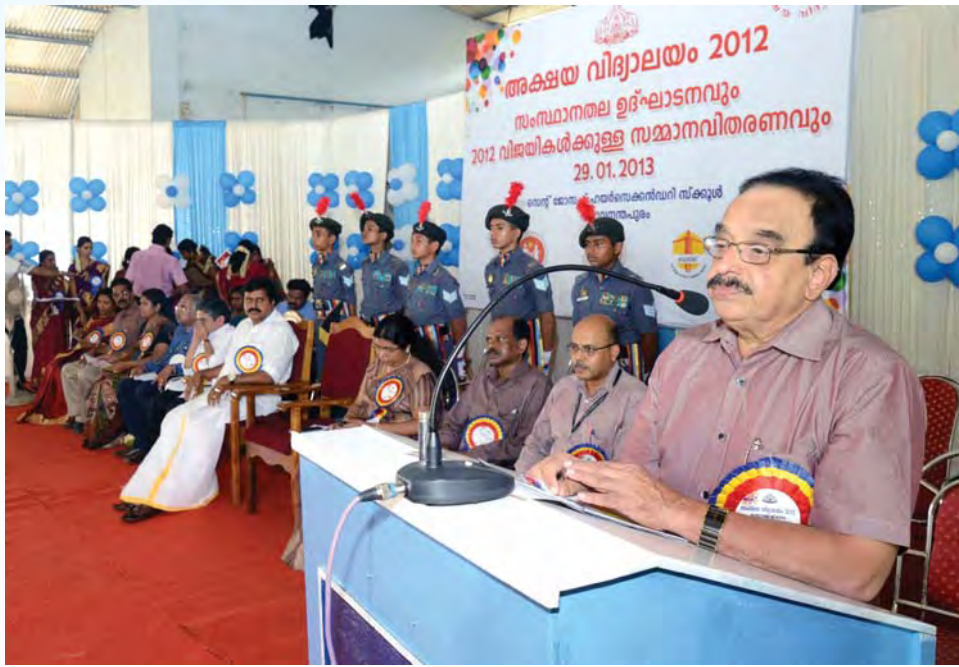
അക്ഷയ വിദ്യാലയം സംസ്ഥാനതല ഉദ്ഘാടനം വിദ്യാഭ്യാസമന്ത്രി പി.കെ. അബ്ദു റബ്ബ് നിർവഹിക്കുന്നു.

മലയാള ഭാഷയുടെയും സാഹിത്യത്തിന്റെയും സംരക്ഷണത്തിനും നവോത്ഥാനത്തിനും മാതൃഭാഷയ്ക്കുമാത്രമായി ഒരു സർവകലാശാല വേണമെന്ന കേരളീയരുടെ ആവശ്യത്തിന് പതിറ്റാണ്ടുകളുടെ പഴക്കമുണ്ട്. മലയാളിയുടെ ഹൃദയ നൈർമല്യവും മലയാള ഭാഷയുടെ ആത്മപ്രകാശനവും സംരക്ഷിച്ചു നിർത്താൻ മലയാളക്കരയ്ക്ക് അഭിമാനമായി തിരുതിൽ, ആധുനിക മലയാളഭാഷയുടെ അഭിവന്ദ്യ പിതാവിന്റെ പേരിൽ 'തുഞ്ചത്തെഴുത്തച്ഛൻ മലയാള സർവകലാശാല' സ്ഥാപിച്ചു. മലയാളം നേരിടുന്ന വെല്ലുവിളികളെ അതിജയിക്കാൻ വേണ്ടുന്ന ശക്തിയും സംവിധാനവും ഒരുക്കിക്കൊണ്ടാണ് ഈ മഹാപാഠ