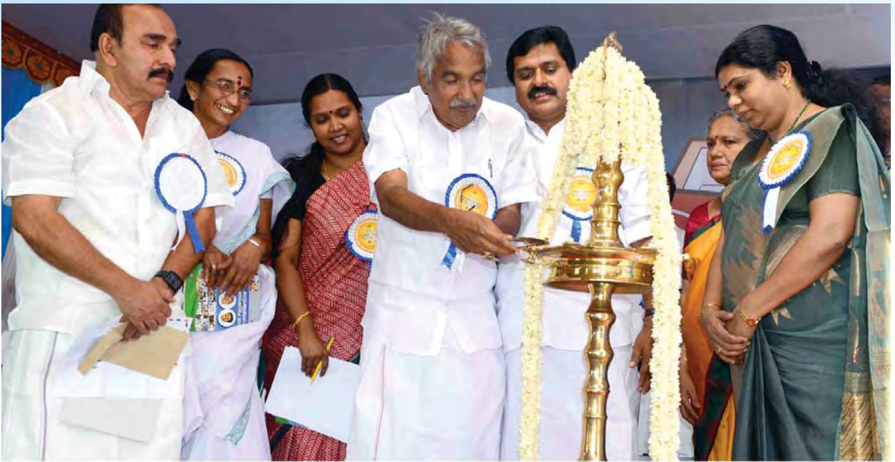
ആരോഗ്യരംഗത്തെ സർക്കാർ സംവിധാനങ്ങളെക്കുറിച്ച് പൊതുജനങ്ങൾക്കുള്ള പരാതികൾ പരിഹരിക്കുന്നതിന് ജില്ലകൾ തോറും സംഘടിപ്പിക്കുന്ന ആരോഗ്യ അഭാവത്തുകളുടെ സംസ്ഥാനതല ഉദ്ഘാടനം തിരുവനന്തപുരത്ത് ആരോഗ്യവകുപ്പ് ഡയറക്ടറേറ്റിൽ മുഖ്യമന്ത്രി ഉമ്മൻചാണ്ടി ഉദ്ഘാടനം ചെയ്യുന്നു. ആരോഗ്യമന്ത്രി വി.എസ്. ശിവകുമാർ സമീപം

20,000 രൂപയുടെ ധനസഹായമാണ് നൽകിവരുന്നത്. സാമൂഹ്യനീതി വകുപ്പ് സംസ്ഥാനത്തെ ഒട്ടേറെ കുട്ടികൾക്ക് കോക്ലിയർ ഇംപ്ലാന്റേഷൻ സൗജന്യമായി നടത്തിവരികയാണ്. അഞ്ചു മെഡിക്കൽ കോളേജുകളിലും തിരുവനന്തപുരം ജനറൽ ആശുപത്രിയിലും കാരുണ്യ കുട്ടിരിപ്പ് കേന്ദ്രങ്ങൾ തുടങ്ങാൻ 22.6 കോടി രൂപ അനുവദിച്ചിട്ടുണ്ട്.