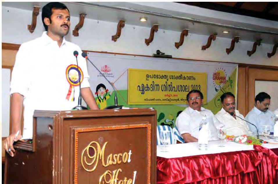
ഉപഭോക്തൃ ശാക്തീകരണം - ഏകദിന ശില്പശാലയുടെ ഉദ്ഘാടനം ക്ഷേമ സിവിൽസപ്ലൈസ് മന്ത്രി അനൂപ് ജേക്കബ്ബ് നിർവഹിക്കുന്നു

ഭൂമിയുടെ ന്യായവില സംബന്ധിച്ച അപാകതകൾ സമയബന്ധിതമായി പരിഹരിക്കുന്നതിനുള്ള നടപടികളുടെ ഭാഗമായി അദാലത്തുകളിൽക്കൂടി 80000 അപ്പീലുകളിൽ തീർപ്പുകൽപ്പിച്ചു. അപ്പീൽ പരിഗണിക്കൽ തുടർപ്രക്രിയയെക്കൊണ്ട് തുടർന്നുണ്ടാകുന്ന അപാകതകൾ പരിഹരിക്കുന്നതിനാവശ്യമായ സംവിധാനവും നടപ്പാക്കി. ■