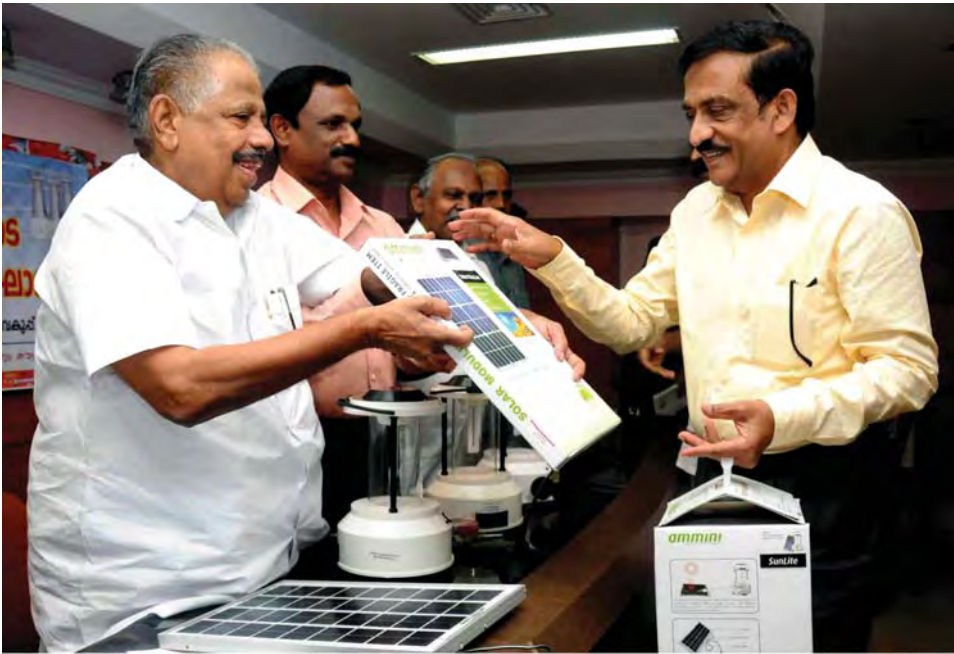
സൗരവിളക്കുകളുടെ വിതരണോദ്ഘാടനം വൈദ്യുതി മന്ത്രി ആര്യാടൻ മുഹമ്മദ് നിർവഹിക്കുന്നു

വൈദ്യുതി ഉത്പാദനത്തിലും വിതരണത്തിലും ഊർജ്ജമേഖലയിലെ പദ്ധതിനിർവഹണത്തിലും ശ്ലാഘനീയമായ പുരോഗതിയാണ് ചുരുങ്ങിയ കാലത്തിനുള്ളിൽ കൈവരിച്ചത്. കഴിഞ്ഞ രണ്ടു വർഷക്കാലയളവിൽ ജനോപകാരപ്രദവും വികസനോ