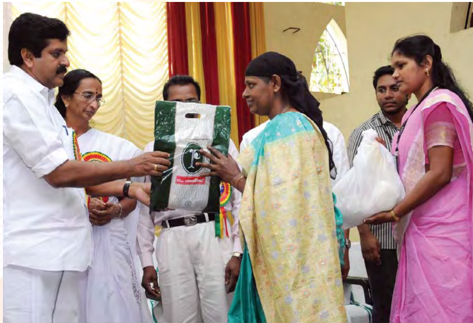
കേരള പാലിയറ്റീവ് കെയർ ദിനാചരണത്തോടനുബന്ധിച്ച് നടന്ന സാന്ത്വന സംഗമവും രോഗീ സഹായ കൈപ്പുസ്തകത്തിന്റെ പ്രകാശനവും സഹായവിതരണവും വി.എസ്. ശിവകുമാർ നിർവഹിക്കുന്നു

സ്കൂൾ ഹെൽത്ത് പ്രോഗ്രാമായ 'ബാലമുക്തം' പദ്ധതിയ്ക്ക്വേണ്ടി ഈ വർഷം 1.25 കോടി രൂപയാണ് വകയിരുത്തിയിട്ടുള്ളത്. കാസർകോട്, വയനാട്, പാലക്കാട് ജില്ലകൾക്ക് വേണ്ടിയാണ് ഇത് അനുവദിച്ചത്. ആയുർമിത്രം പദ്ധതിക്കുവേണ്ടി 10 ലക്ഷം രൂപ അനുവദിച്ചു. ഇടുക്കി, പാലക്കാട് ട്രൈബൽ സങ്കേതങ്ങളിലുള്ള വൃദ്ധജനങ്ങൾക്കാണ് ഈ പദ്ധതിയുടെ പ്രയോജനം ലഭിച്ചുകൊണ്ടിരിക്കുന്നത്. കാഞ്ഞിരംകുളം മർമ ആശുപത്രിയിൽ ആയുഷ് ഫണ്ടിൽ നിന്നും 10 ലക്ഷം രൂപ വിനിയോഗിച്ച് പേവർഡ് നിർമ്മിച്ചു. താളിയോലകൾ കണ്ടെടുത്ത്, ഔഷധയോഗങ്ങളെക്കുറിച്ചുള്ള ബൃഹത് ഗ്രന്ഥങ്ങൾ പ്രസിദ്ധീകരിച്ചു. എൻ.ആർ.എച്ച്.എമ്മിന്റെ 191 ആയുർവേദ ഡിസ്പെൻസറികൾ സംസ്ഥാനത്ത് പ്രവർത്തിക്കുന്നുണ്ട്. എൻ.ആർ.എച്ച്.എമ്മിന്റെ തന്നെ 15 യൂനാനി ഡിസ്പെൻസറികളും 17 സിദ്ധ ഡിസ്പെൻസറികളും നമ്മുടെ സംസ്ഥാനത്തുണ്ട്.