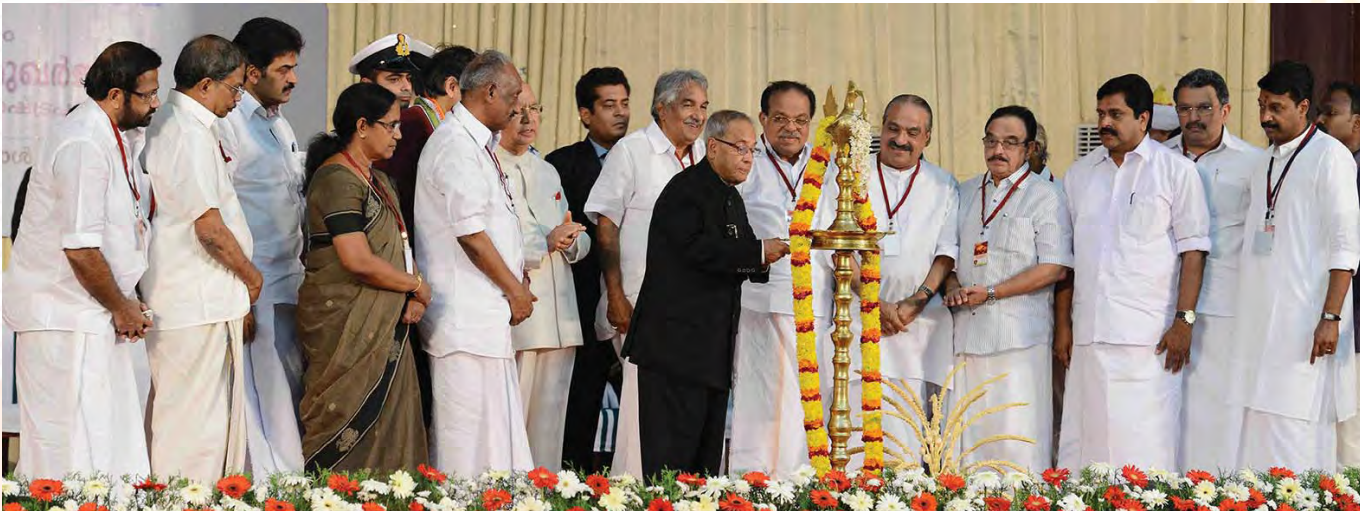
വിശ്വമലയാള മഹോത്സവം രാഷ്ട്രപതി പ്രണബ് മുഖർജി ഉദ്ഘാടനം ചെയ്യുന്നു

കേന്ദ്രവിഷ്കൃത പദ്ധതികളുടെ ആസൂത്രണ വികേന്ദ്രീകരണത്തിന് ഉപഗ്രസഹായത്തോടെ വിവരശേഖരണം സാധ്യമാക്കുന്ന ജിയോപോർട്ടൽ സംവിധാനം പൂർത്തിയാക്കി.