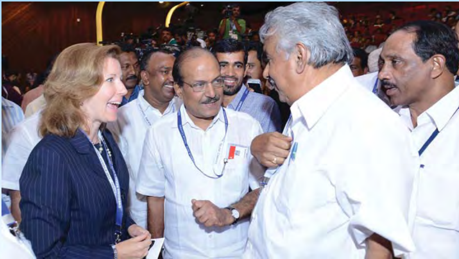
എമർജിങ് കേരളയിൽ വിദേശപ്രതിനിധികളുമായുള്ള കൂടിക്കാഴ്ച