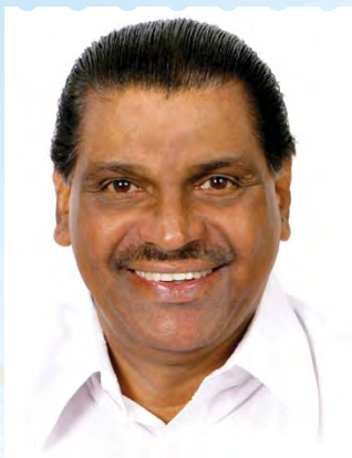
■ തിരുവഞ്ചൂർ രാധാകൃഷ്ണൻ ആഭ്യന്തര-വിജിലൻസ് മന്ത്രി

ഏതൊരു ജനതയുടെയും ഐശ്വര്യത്തിനും പുരോഗതിക്കും നിലനിൽപ്പിനും അവശ്യം വേണ്ടത് സമാധാനത്തോടെ ജീവിക്കാനുള്ള അടിസ്ഥാന സാഹചര്യമാണ്. ക്രമസമാധാനപാലനത്തിൽ ഇന്ത്യയിലെ ഇതര സംസ്ഥാനങ്ങളെ അപേക്ഷിച്ച് കേരളം ഏറ്റവും മുൻനിരയിലാണ്. ശ്രദ്ധേയമായ പുരോഗതിയാണ് ഇക്കാര്യത്തിൽ സംസ്ഥാനം കൈവരിച്ചിട്ടുള്ളത്. ഇവിടെ കുറ്റകൃത്യങ്ങൾ നടക്കുന്നില്ലെന്നോ എല്ലാം പൂർണ്ണ ഭദ്രമാണെന്നോ അതിനാൽ നാം ജാഗ്രത പാലിക്കേണ്ടതില്ലെന്നോ ഇതുകൊണ്ട് അർത്ഥമാക്കുന്നില്ല. മാറിവരുന്ന സാഹചര്യങ്ങൾക്ക് അനുസൃതമായി പൊലീസിന്റെ പ്രവർത്തനത്തിലും സമീപനത്തിലും ആവശ്യമായ മാറ്റം വരേണ്ടതുണ്ട്. അതിനുള്ള ശ്രമമാണ് സർക്കാർ നടത്തിവരുന്നത്. എങ്കിലും പൊതുവെയുള്ള സ്ഥിതിയനുസരിച്ച് കേരളത്തിൽ മെച്ചപ്പെട്ട ക്രമസമാധാനനിലയാണ് നിലവിലുള്ളതെന്നാണ് വിവിധ സർവ്വേകളിൽ നിന്നും വ്യക്തമാകുന്നത്. സർക്കാരിന്റെയും കേരള പൊലീസിന്റെയും ജാഗ്രതയുള്ള പ്രവർത്തനങ്ങൾ വഴിയാണ് നമുക്ക് ഈ നേട്ടം ആർജ്ജിക്കാനായത്. ക്രമസമാധാനപാലനം, കുറ്റാന്വേഷണം, ജാഗ്രതാപ്രവർത്തനം, ഗതാഗത നിയന്ത്രണം, അഴിമതി തടയാനുള്ള പ്രവർത്തനങ്ങൾ, ജനസൗഹൃദ പൊലീസ് സംവിധാനം എന്നീ മേഖലകളിലാണ് പൊലീസിന്റെ പ്രവർത്തനത്തിൽ മുഖ്യമായും ഊന്നൽ നൽകിയിട്ടുള്ളത്. ജനശ്രദ്ധയാകർഷിച്ച ഒട്ടനവധി കേസുകളിൽ തികച്ചും പ്രൊഫഷണലും കാര്യക്ഷമവുമായ അന്വേഷണം വഴി ഒട്ടും കാലതാമസം ഇല്ലാതെ തന്നെ കുറ്റവാളികളെ കണ്ടെത്താനും അവരെ നിയമത്തിന്റെ മുമ്പിലെത്തിക്കാനും കഴിഞ്ഞിട്ടുണ്ട്.