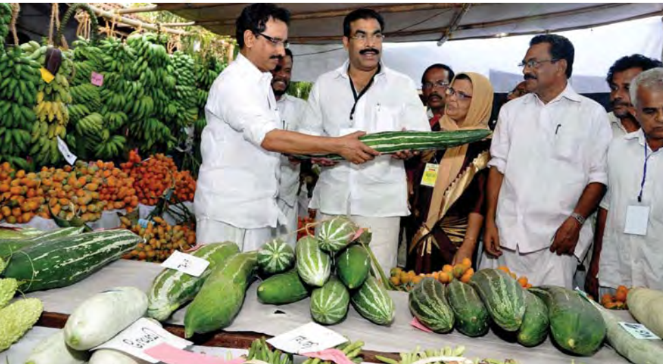
സമൃദ്ധി : കാർഷികോത്സവം

1469041 കർഷകരുടെ കൃഷി വിവരങ്ങളും അടിസ്ഥാന വിവരങ്ങളും കൃഷിഭവൻ വഴി ശേഖരിച്ച് ക്രോഡീകരിക്കുന്ന കർഷക രജിസ്ട്രേഷനും ധനസഹായ ബാങ്ക് മുഖേനയാക്കി ഇ-പേമെന്റ് സംവിധാനവും ഏർപ്പെടുത്തുകയും, ആറു മൊത്ത വ്യാപാര വിപണികളിലൂടെ ഇടനിലക്കാരുടെ ചൂഷണം അവസാനിപ്പിച്ച് കർഷകരുടെ ഉത്പന്നങ്ങൾ ആദായകരമായി വിറ്റഴിക്കാനും 61 കർഷക ഗ്രൂപ്പുകൾ രൂപീകരിച്ച് ആഴ്ചയിൽ ഒരു ദിവസമെങ്കിലും ഉത്പന്നങ്ങളുടെ ലേലം നടത്തുന്നതിനുള്ള