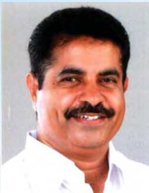
■ അടൂർ പ്രകാശ് റവന്യൂ മന്ത്രി