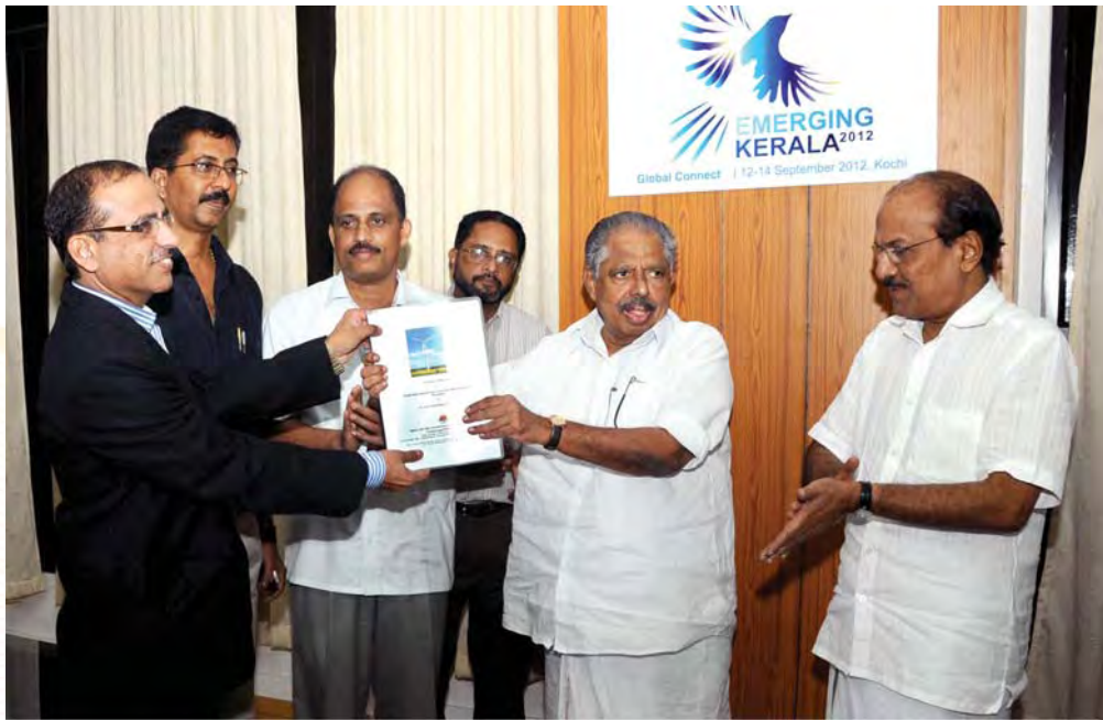
കമ്മീഷോട് 22 മെഗാവാട്ട് കാറ്റാടിപ്പാടം സ്ഥാപിക്കുന്നതിനുള്ള സാങ്കേതിക അനുമതിപത്രം വൈദ്യുതി മന്ത്രി ആര്യാടൻ മുഹമ്മദ് ഇനൈക്സ് റിന്യൂവബിൾ ലിമിറ്റഡിന് കൈമാറുന്നു. വ്യവസായമന്ത്രി പി.കെ. കുഞ്ഞാലിക്കുട്ടി സമീപം

പാരമ്പര്യേതര ഊർജ്ജ രംഗത്ത് വിവിധ പദ്ധതികൾ ആവിഷ്കരിച്ചു നടപ്പാക്കുക വഴി സംസ്ഥാനത്തിന്റെ ഊർജ്ജ പ്രതിസന്ധിക്ക് ഒരു പരിധിവരെ പരിഹാരമുണ്ടാക്കാൻ കഴിഞ്ഞ രണ്ടു വർഷങ്ങളിൽ സാധിച്ചു. സൗരവൈദ്യുത പദ്ധതികൾ നടപ്പാക്കുക, ബയോഗ്യാസ് പ്ലാന്റുകൾ സ്ഥാപിക്കുക, മെച്ചപ്പെട്ട വിറകുപ്പുകൾ സ്ഥാപിക്കുക, സോളാർ വാട്ടർ ഹീറ്ററുകൾ