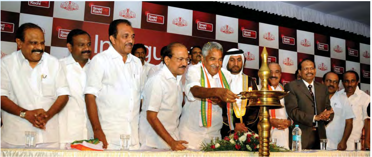
സ്മാർട്ട്സിറ്റി പവലിയൻ മുഖ്യമന്ത്രി ഉമ്മൻചാണ്ടി ഉദ്ഘാടനം ചെയ്യുന്നു

കഴിയും. സർക്കാർ വകുപ്പുകളിലേക്ക് പർച്ചേയ്സ് നടത്തുന്നതിന് ഇ-പ്രൊക്യൂർമെന്റ് സംവിധാനം ഏർപ്പെടുത്തിയതും വലിയൊരു ചുവടുവെയ്പാണ്. 25 ലക്ഷത്തിന് മുകളിൽ വരുന്ന എല്ലാ പർച്ചേയ്സുകളും ടെണ്ടറുകളും ഇ-പ്രൊക്യൂർമെന്റ് സംവിധാനത്തിന് കീഴിലാക്കി ഉത്തരവിട്ടു. വെബ് അധിഷ്ഠിത സോഫ്റ്റ് വെയറായ 'ഫ്രീസ്' എല്ലാ അക്ഷയകേന്ദ്രങ്ങളിലും ഫ്രണ്ട്സ് കേന്ദ്രങ്ങളിലും വിന്യസിച്ചതുവഴി തിരഞ്ഞെടുക്കപ്പെടുന്ന ബിൽ പേയ്മെന്റുകൾ കൂടുതൽ വേഗത്തിൽ ഈ കേന്ദ്രങ്ങൾ വഴി പൊതുജനങ്ങൾക്ക് ലഭി