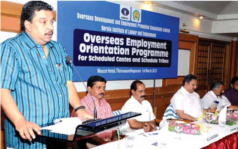
പട്ടികജാതി-പട്ടികവർഗ്ഗ യുവാക്കൾക്കുള്ള വിദേശ തൊഴിലവസര ബോധവൽക്കരണ പരിപാടിയിലെ ഉദ്ഘാടനം

തൊഴിലാളികളുടെ എതിരാധിപത്യപ്രക്ഷോഭങ്ങൾ അധികരിക്കുന്ന മനുഷ്യൻ്റെ എക്കാലവും സംഘശക്തിയുടെ ശ്രോതസ്സായി നിലകൊള്ളുമെന്ന കാര്യത്തിൽ സംശയമില്ല. നവഭാരത സൃഷ്ടിക്കുവേണ്ടി പണിയെടുക്കുന്ന എല്ലാ തൊഴിലാളി സുഹൃത്തുക്കളുമായിച്ചേർന്ന് മുന്നോട്ടുള്ള കുതിച്ചുചാട്ടത്തിന് തയ്യാറെടുക്കുകയാണ് ഭാവികേരളം. ■