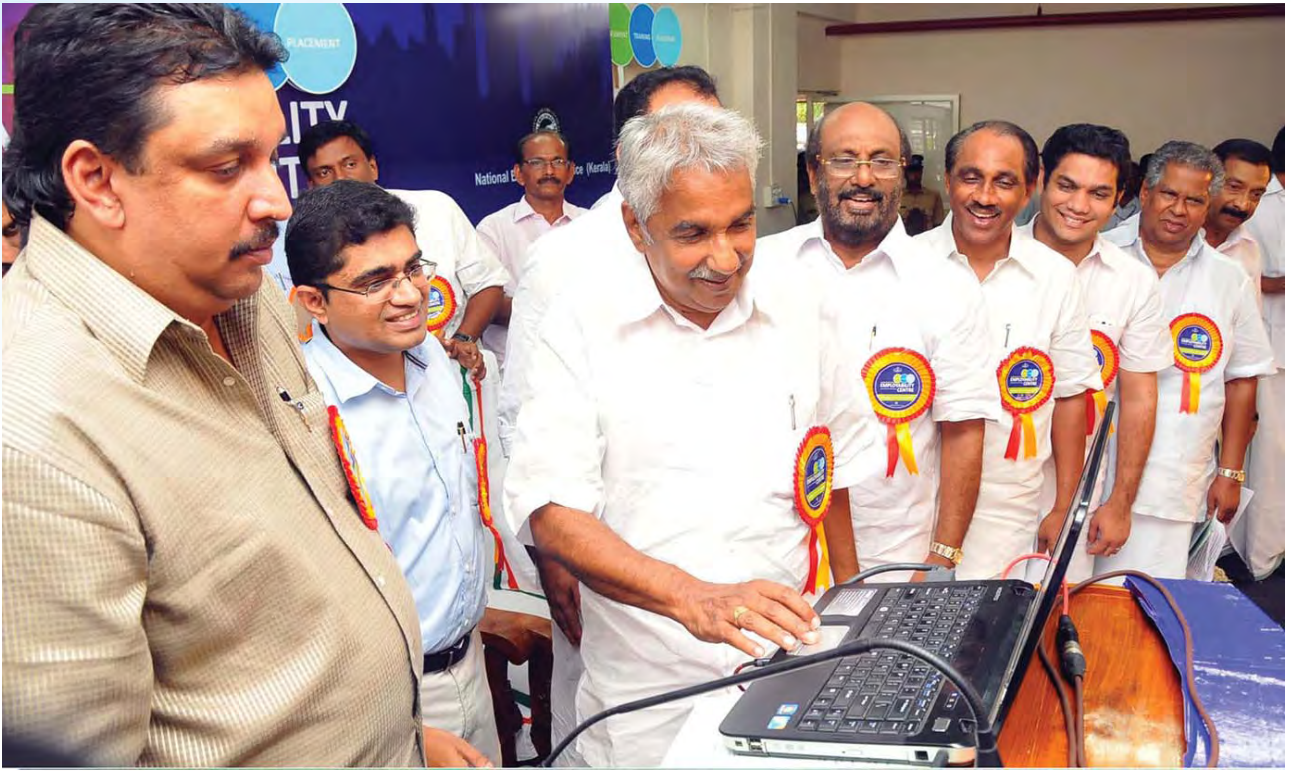
എംപ്ലോയബിലിറ്റി സെന്ററുകളുടെ സംസ്ഥാനതല ഉദ്ഘാടനം കൊച്ചിയിൽ മുഖ്യമന്ത്രി ഉമ്മൻചാണ്ടി നിർവഹിക്കുന്നു

നുകളും വിതരണം ചെയ്യുവാനും വകുപ്പിനു കഴിഞ്ഞു. സർക്കാർ പുതുതായി ആവിഷ്കരിച്ചു നടപ്പാക്കിയ മരംകയറ തൊഴിലാളി