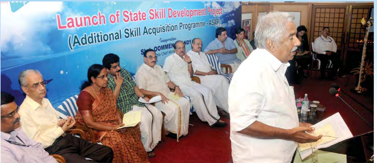
സ്കിൽ ഡവലപ്മെന്റ് പ്രോജക്ടിന്റെ സംസ്ഥാനതല ഉദ്ഘാടനം മുഖ്യമന്ത്രി ഉമ്മൻചാണ്ടി നിർവഹിക്കുന്നു

ണമായിട്ടുണ്ട്. തൊഴിലും ആധുനിക സാങ്കേതികവിദ്യയുമായി സമന്വയിക്കുന്ന ബോധനരീതി കേരളീയർക്ക് മുൻ പരിചിതമായിരുന്നില്ല.