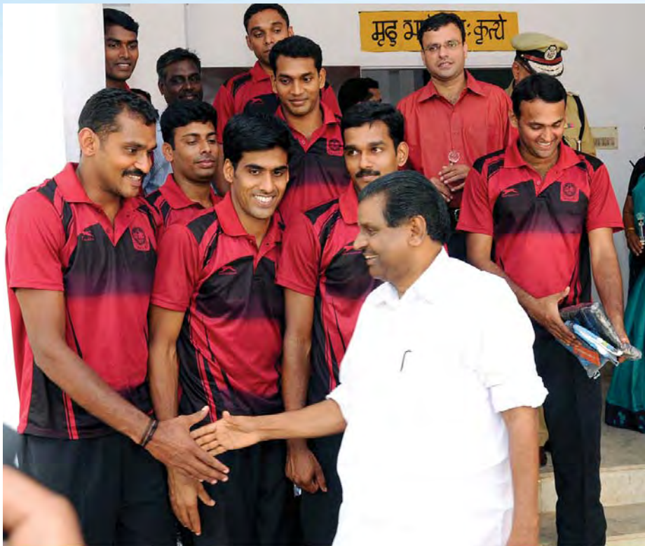
ദേശീയ കായിക മത്സരത്തിൽ വിജയിച്ച പൊലീസ് കായിക പ്രതിഭകളെ ആദ്യന്തരമന്ത്രി തിരുവഞ്ചൂർ രാധാകൃഷ്ണൻ അനുമോദിക്കുന്നു

ദുരന്തങ്ങളുണ്ടാകുമ്പോൾ രക്ഷാപ്രവർത്തനം നടത്തുന്നതിന് പൊലീസ് സേന ഏതു സമയത്തും സേവനസജ്ജമായെത്തുന്നു. ദുരന്തനിവാരണ രക്ഷാപ്രവർത്തനങ്ങൾക്കു പ്രത്യേക പരിശീലനം ലഭിച്ച 300 അംഗങ്ങളെ ഉൾപ്പെടുത്തി സംസ്ഥാന ദുരന്തനിവാരണസേന രൂപീകരിച്ചു. ആധുനിക പരിശീലനം നേടിയ കമാണ്ടോകളെ ഉൾപ്പെടുത്തി 'തണ്ടർ ബോൾട്സ്' എന്ന സുരക്ഷാ വിഭാഗം ആരംഭിച്ചു. വ്യക്തികളുടെ സുരക്ഷയ്ക്കും തീവ്രവാദി ആക്രമങ്ങൾക്കുമെതിരെ ജാഗ്രതയോടെ പ്രവർത്തിക്കാൻ സദാസേവനസജ്ജമായ ഒരു വിഭാഗമാണിത്. സെൻട്രൽ ഇൻഡസ്ട്രിയൽ സെക്യൂരിറ്റി ഫോഴ്സിന്റെ (സി.ഐ.എസ്.എഫ്) മാതൃകയിൽ സ്റ്റേറ്റ് ഇൻഡസ്ട്രിയൽ സെക്യൂരിറ്റി ഫോഴ്സ് ആരംഭിക്കുവാൻ സർക്കാർ തീരുമാനമായി. ഇതിന്റെ പ്രാരംഭ പ്രവർത്തനങ്ങൾ സ്വീകരിച്ചുവരുന്നു. ബാങ്കുകൾ, വ്യവസായ സ്ഥാപനങ്ങൾ തുടങ്ങിയവയുടെ സുരക്ഷയ്ക്ക്, പ്രതിഫലം വാങ്ങിക്കൊണ്ട്, പരിശീലനം ലഭിച്ച സേനയുടെ സേവനം