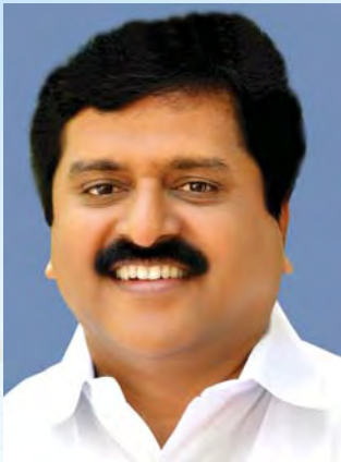
■ വി.എസ്. ശിവകുമാർ ആരോഗ്യ-കുടുംബക്ഷേമ-ദേവസ്വം മന്ത്രി

ആ രോഗ്യരംഗത്തെ കേരളമാതൃക വീണ്ടും പ്രകീർത്തിക്കപ്പെടുകയാണ്. ശിശുമരണനിരക്ക്, മാതൃമരണനിരക്ക്, സ്ത്രീ-പുരുഷ അനുപാതം, ജനനനിരക്ക് തുടങ്ങിയ ആരോഗ്യ സൂചികകളിൽ നമ്മുടെ സംസ്ഥാനം വികസിതരാജ്യങ്ങളുടേതിന് തുല്യമായ നേട്ടം കൈവരിച്ചുകഴിഞ്ഞു. പ്രതിരോധകൃത്തി വയ്പ്പ്, കുടുംബസുത്രണം, ആയുർദൈർഘ്യം എന്നിങ്ങനെ പൊതു ജനാരോഗ്യവുമായി ബന്ധപ്പെട്ട പല മേഖലകളിലും കേരളം ഇതര സംസ്ഥാനങ്ങളേക്കാൾ ബഹുദൂരം മുന്നിലാണ്. എന്നാൽ ഈ നേട്ടങ്ങൾക്കൊപ്പം ഒട്ടേറെ വെല്ലുവിളികളും ആരോഗ്യമേഖലയിൽ സംജാതമായിക്കഴിഞ്ഞു. ജീവിതശൈലീ രോഗങ്ങളുടെ വ്യാപനം, പകർച്ചവ്യാധികൾ, നിർമ്മാർജ്ജനം ചെയ്യപ്പെട്ട മലേറിയ പോലുള്ള രോഗങ്ങളുടെ തിരിച്ചുവരവ്, റോഡപകടങ്ങൾ, വർദ്ധിച്ചുവരുന്ന മാനസികാരോഗ്യ പ്രശ്നങ്ങൾ, കുടിക്കൊണ്ടിരിക്കുന്ന വൃദ്ധജനസംഖ്യ എന്നിവയാണ് അവയുടെ മുൻനിരയിൽ. അവയെ ഫലപ്രദമായി നേരിടാൻ വിവിധങ്ങളായ പദ്ധതികൾ സർക്കാർ ആവിഷ്കരിച്ച് നടപ്പാക്കി വരികയാണ്.