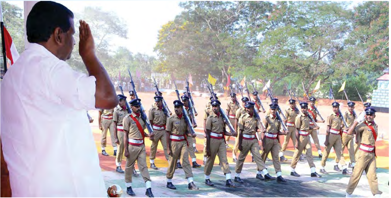
പേരൂർക്കട എസ്.എ.പി. ക്യാമ്പിൽ നടന്ന പോലീസ് സേനാഗങ്ങളുടെ പാസിങ്ങ് ഔട്ട് പരേഡിൽ ആഭ്യന്തരമന്ത്രി തിരുവഞ്ചൂർ രാധാകൃഷ്ണൻ സല്യട്ട് സ്വീകരിക്കുന്നു

മുൻകയ്യെടുക്കുന്നു. പരിശീലനവും സേവനസന്നദ്ധതയും അച്ചടക്കവുമുള്ള ഒരു പുതിയ തലമുറയെ വളർത്തിക്കൊണ്ടുവരുന്നതിന് ഈ സംരംഭം ഏറെ ഉപകാരപ്രദമാകും.