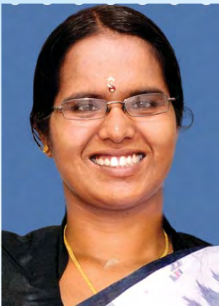
■ പി.കെ. ജയലക്ഷ്മി പട്ടികവർഗക്ഷേമം-യുവജനകാര്യം- മ്യൂസിയം-മൃഗശാല മന്ത്രി

അ ർഥപൂർണ്ണമായ രണ്ടു വർഷം പൂർത്തിയാക്കുന്ന സർക്കാരിന്റെ ഭാഗമാകാൻ കഴിഞ്ഞതിൽ എനിക്ക് അഭിമാനമുണ്ട്. വികസനവും കരുതലുമെന്ന മുദ്രാവാക്യത്തോടെ ജനജീവിതത്തിന്റെ എല്ലാ മേഖലകളിലും ഫലപ്രദമായി ഇടപെടാൻ ഈ സർക്കാരിന് സാധിച്ചിട്ടുണ്ട്. വികസനത്തിന്റെ ഗുണഫലങ്ങൾ എല്ലാവരിലും എത്തിച്ചേരുമ്പോഴാണ് ഭരണനിർവഹണത്തിൽ തുല്യനീതി നടപ്പാക്കുന്നത്. പട്ടികവർഗക്ഷേമം, യുവജനകാര്യം, മ്യൂസിയം, മൃഗശാല എന്നീ വകുപ്പുകളുടെ ചുമതലക്കാരിയെന്ന നിലയിൽ സർക്കാരിന്റെ പൊതു സമീപനത്തിന് അനുയോജ്യമായി പ്രവർത്തിക്കാൻ എനിക്കു സാധിച്ചുവെന്ന ആത്മവിശ്വാസമുണ്ട്.