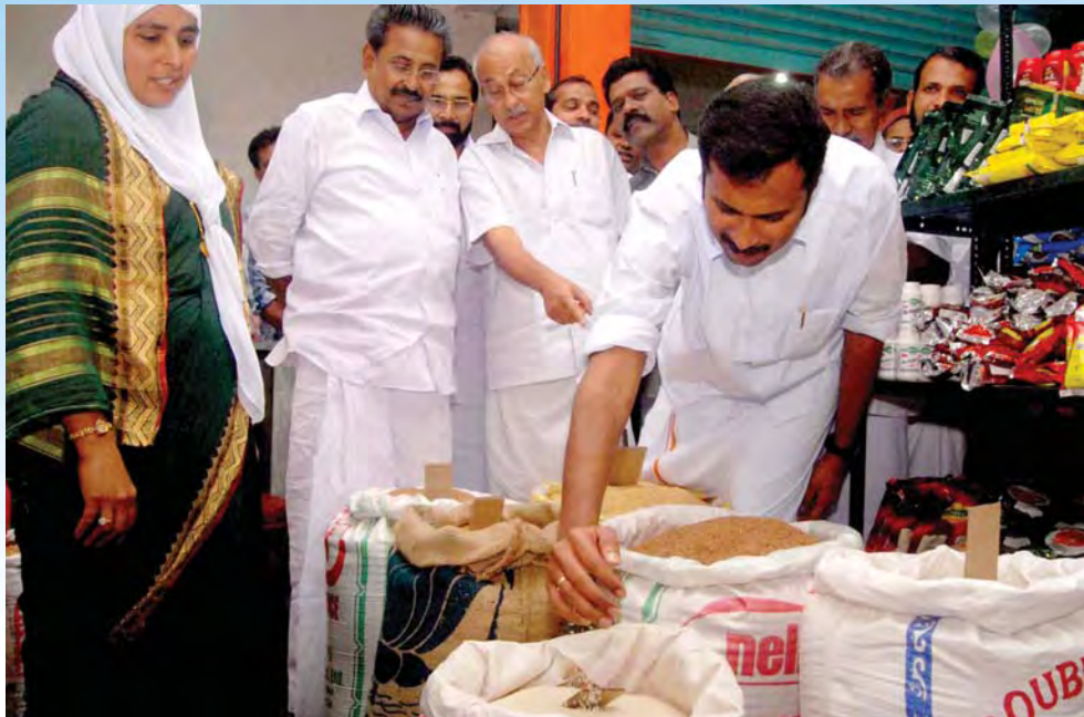
ഈങ്ങാപ്പുഴ മാവേലി സ്റ്റോർ ഉദ്ഘാടനം നിർവഹിച്ച മന്ത്രി അനൂപ് ജേക്കബ് ഉൽപന്നങ്ങൾ പരിശോധിക്കുന്നു

ഗുണഭോക്താക്കളുടെ പൂർണ്ണ വിവരങ്ങൾ ഡിജിറ്റൈസ് ചെയ്യുന്ന ജോലികൾ പൂർത്തീകരിച്ചുകഴിഞ്ഞു. അടുത്ത ഘട്ടം എഫ്.സി.ഐ. ഗോഡൗണുകളിൽ നിന്ന് ഭക്ഷ്യധാന്യങ്ങൾ ഏറ്റെടുത്ത് റേഷൻ കടകളിൽ എത്തിക്കുന്നതുവരെയുള്ള വിതരണ പ്രക്രിയ കമ്പ്യൂട്ടർവത്കരിക്കുന്നതാണ്. റേഷൻ സാധനങ്ങൾ