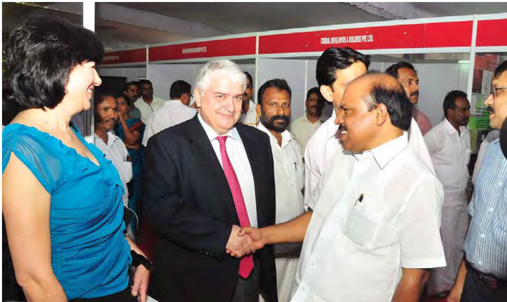
എറണാകുളത്ത് നടന്ന ഇൻഫ്രാസ്ട്രക്ചർ കോൺഫറൻസിൽ മന്ത്രി വിദേശ പ്രതിനിധികൾക്കൊപ്പം

ഇപ്പോൾ കരാറുകാർ ഒത്തുചേർന്ന് മത്സരമില്ലാതെ ടെൻഡറുകൾ സമർപ്പിക്കുന്ന രീതിയിലും അഴിമതിരഹിതമായ ഇ-