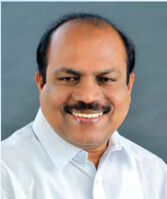
■ വി.കെ. ഇബ്രാഹിം കുഞ്ഞ് പൊതുമരാമത്ത് മന്ത്രി

സ ഫലമായ രണ്ടു വർഷങ്ങൾ കഴിയുകയാണ്. ചാരിതാർത്ഥ്യമുണ്ട്, കേരളത്തിന്റെ വികസനത്തിൽ പങ്കാളിയാവാൻ കഴിഞ്ഞതിൽ. കഴിഞ്ഞ രണ്ടു വർഷത്തിൽ അടിസ്ഥാന സൗകര്യവികസനത്തിൽ ഊന്നിയ പ്രവർത്തനങ്ങൾക്ക് കേരളം സാക്ഷ്യം വഹിച്ചു. അതിന്റെ മാറ്റങ്ങൾ ജനങ്ങൾ അറിഞ്ഞുകഴിഞ്ഞു.