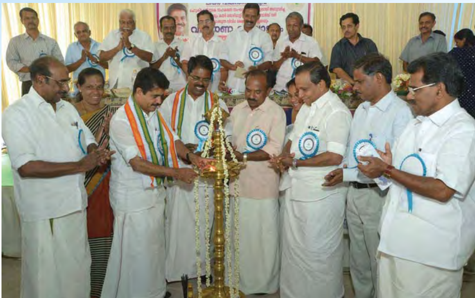
കയർ തൊഴിലാളി ക്ഷേമനിധി ബോർഡ് വഴി നടപ്പാക്കുന്ന വിവിധ ക്ഷേമപദ്ധതികളുടെ ഉദ്ഘാടനം മന്ത്രി അടൂർ പ്രകാശ് നിർവഹിക്കുന്നു

കയർ തൊഴിലാളി ക്ഷേമനിധി പെൻഷൻ 300 രൂപയിൽ നിന്നും 500 രൂപയായി വർദ്ധിപ്പിച്ചു. 2011 ൽ തുടക്കം കുറിച്ച കയറിന്റെയും പ്രകൃതിദത്തനാരുകളുടെയും അന്താരാഷ്ട്രമേളയായ 'കയർ കേരള' 2012 ലും 2013 ലും സംഘടിപ്പിച്ചു. ഇതുവഴി കയർമേഖലയിൽ ആഭ്യന്തര സ്വദേശവിപണി ശക്തമാക്കാൻ സാധിച്ചു. കയർ പൊതുമേഖലാ സ്ഥാപനങ്ങളായ കയർ കോർപ്പറേഷൻ, ഫോമിൽ, കയർ