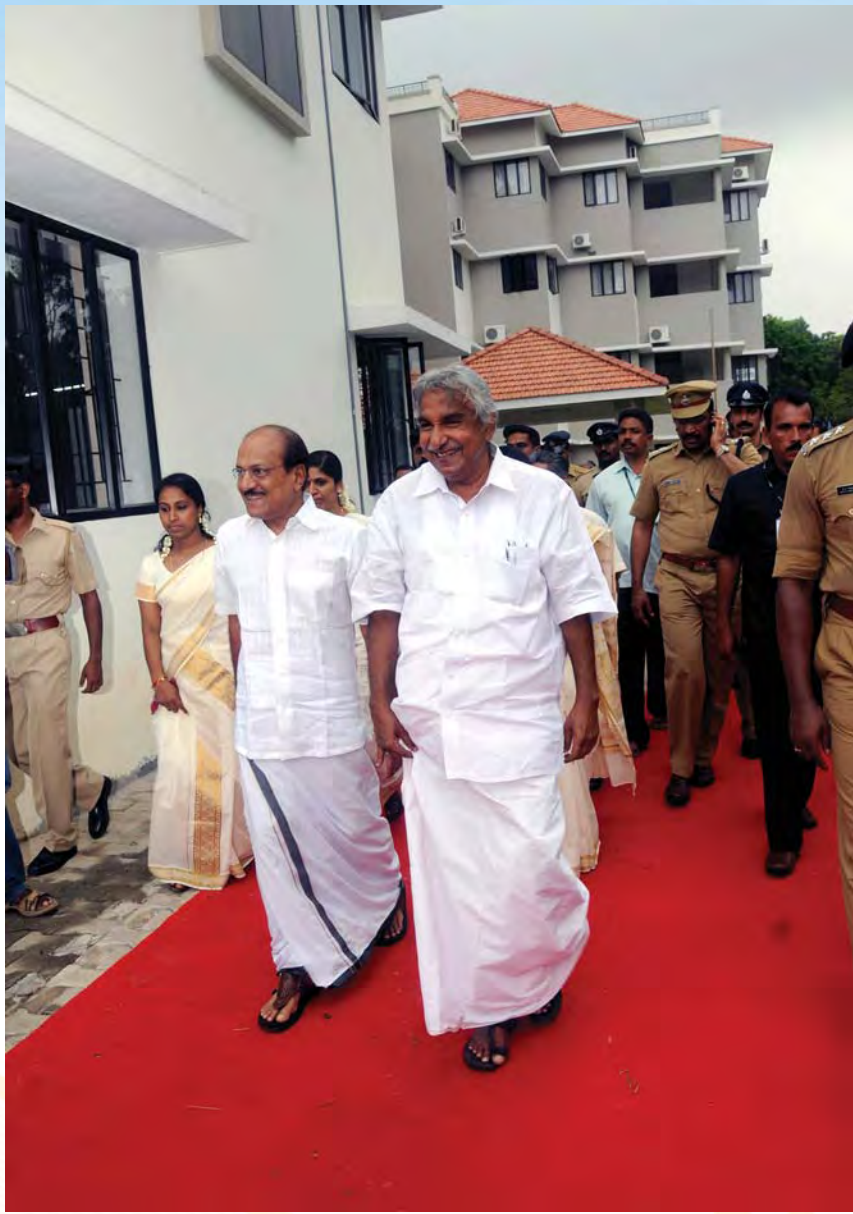
ഇന്ത്യൻ ഇൻസ്റ്റിറ്റ്യൂട്ട് ഓഫ് ഇൻഫർമേഷൻ ടെക്നോളജി-മാനേജ്മെന്റ് കേരളയുടെ പുതിയ കാമ്പസ് ടെക്നോ പാർക്കിൽ ഉദ്ഘാടനം ചെയ്യാനെത്തുന്ന മുഖ്യമന്ത്രിയും വ്യവസായമന്ത്രിയും

2012 സെപ്റ്റംബറിൽ കൊച്ചിയിൽ പ്രധാനമന്ത്രി മൻമോഹൻ സിങ് ഉദ്ഘാടനം ചെയ്ത എമർജിൻ്റ് കേരള ആഗോള നിക്ഷേപകർക്ക് മുന്നിൽ കേരളത്തിന്റെ സാധ്യതകൾ അവതരിപ്പിക്കുവാനും സാമ്പത്തിക സംരംഭങ്ങളുടെ സുപ്രധാന കേന്ദ്രമായി കേരളത്തെ മാറ്റാനും ഉദ്ദേശിച്ചുകൊണ്ടുള്ളതായിരുന്നു. 45 വൻ പദ്ധതികളിലായി 40,000 കോടിയിലധികം നിക്ഷേപ നിർദ്ദേശങ്ങളാണ് ഇതിലൂടെ ലഭിച്ചത്. എമർജിൻ്റ് കേരളയിലെ ആദ്യത്തെ പ്രധാന പദ്ധതി സി പ്ളെയിൻ സർവീസ് ഈ വർഷംതന്നെ ആരംഭിക്കും. എമർജിൻ്റ് കേരളയുടെ പുരോഗതി നിരീക്ഷിക്കാനും റിപ്പോർട്ട്