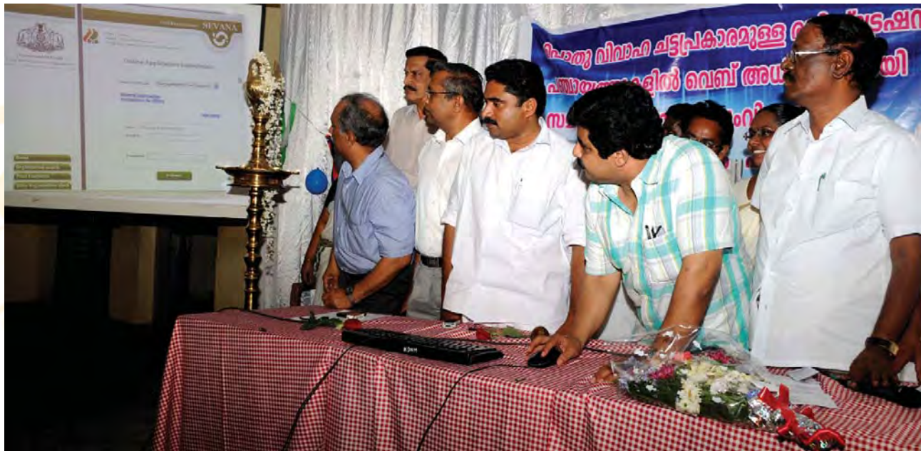
പൊതുവിവാഹചട്ടപ്രകാരമുള്ള രജിസ്ട്രേഷൻ അപേക്ഷകൾ പഞ്ചായത്തുകളിൽ വെബ് അധിഷ്ഠിതമായി സമർപ്പിക്കുന്നതിനുള്ള സംവിധാനത്തിന്റെ സംസ്ഥാനതല ഉദ്ഘാടനം പഞ്ചായത്ത് സാമൂഹികക്ഷേമമന്ത്രി എം.കെ. മുനീർ നിർവഹിക്കുന്നു

978 ഗ്രാമപഞ്ചായത്തിലേയും സെക്രട്ടറിമാരുടെ തസ്തിക ഏകീകരിച്ചുകൊണ്ട് വകുപ്പ് ശക്തിപ്പെടുത്തുന്നതിനും കാര്യക്ഷമമാക്കുന്നതിനുമുള്ള നടപടികൾ തുടക്കം കുറിച്ചു. തുടർന്ന് 978 അസിസ്റ്റന്റ് സെക്രട്ടറി തസ്തികകൾ, ക്ലറിക്കൽ തസ്തികകൾ എന്നിവ സൃഷ്ടിച്ച് ജോലിഭാരത്തിന് അനുസൃതമായി ജീവനക്കാരുടെ ലഭ്യത ഉറപ്പാക്കി. എൽ.എസ്.ജി.ഡി. എൻജിനീയർ