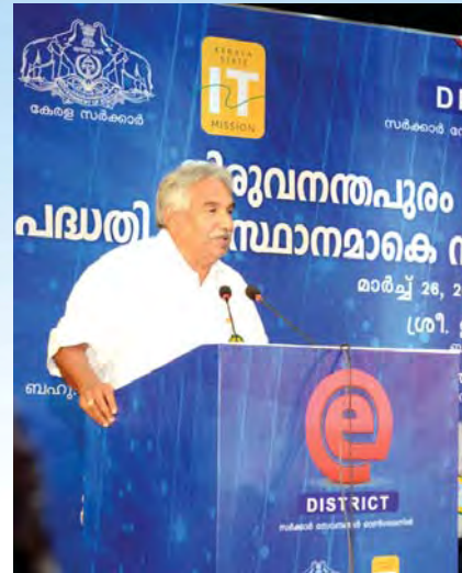
ഇ-ഡിസ്ട്രിക്ട് പദ്ധതിയുടെ തിരുവനന്തപ്രവൃദ്ധാപനവും മുഖ്യമന്ത്രി ഉമ്മൻചാണ്ടി

ശ്ലേരി കിൻഫ്രാ പാർക്കിൽ നടപ്പാക്കിയ സ്റ്റാർട്ട്അപ്പ് പദ്ധതിക്ക് ആവേശകരമായ പ്രതികരണമാണ് ലഭിക്കുന്നത്. ഇതിനകം 5000 ചതുരശ്രഅടി സ്ഥലം സ്റ്റാർട്ട്അപ്പ് വില്ലേജിന് അനുവദിച്ചു. 2014 ഓടെ ഒരു ലക്ഷം ചതുരശ്ര അടി സ്ഥലം സ്റ്റാർട്ട് അപ്പ് വില്ലേജിൽ സംരംഭകർക്കായി നൽകും. നമ്മുടെ വിദ്യാർഥികളെ സംരംഭകരായി വളർത്തിയെടുക്കാനുള്ള ശ്രമത്തിന്റെ ഭാഗമായിട്ടാണ് ഇത്തരം പദ്ധതികൾ ആവിഷ്കരിക്കുന്നത്. സ്റ്റാർട്ട്അപ്പ് മാതൃകയിലുള്ള പദ്ധതികൾക്ക് മുഴുവൻ പിന്തുണയും നൽകാനാണ് സർക്കാരിന്റെ തീരുമാനം. വിദ്യാർഥി സംരംഭകർക്കുള്ള ഗ്രേസ് മാർക്ക്, ഹാജർ ഇളവ് തുടങ്ങിയ പാക്കേജുകളും ഇതിന്റെ ഭാഗമാണ്.