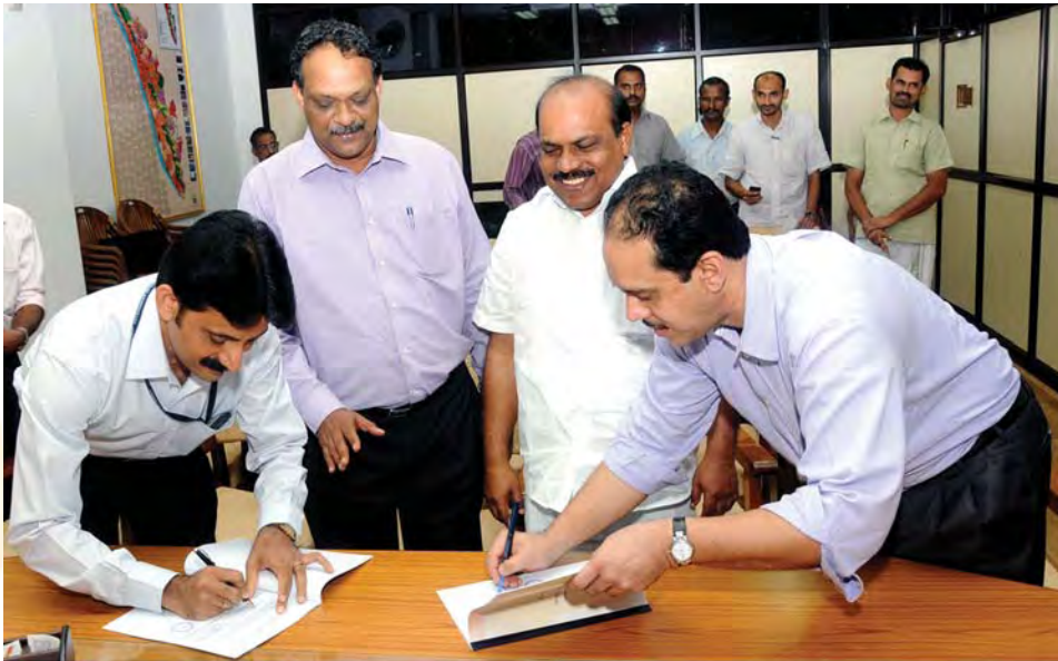
കോഴിക്കോട് സിറ്റി റോഡുകൾ നവീകരിക്കുന്നതിനുള്ള കരാർ പൊതുമരാമത്ത് മന്ത്രി വി.കെ. ഇബ്രാഹിംകുഞ്ഞിന്റെ സാന്നിധ്യത്തിൽ ഒപ്പു വയ്ക്കുന്നു

ഭാവിയിൽ പൊതുമരാമത്ത് വകുപ്പിന് മാർഗരേഖയാകുന്ന ഈ കോൺഫറൻസുകളുടെ കണ്ടെത്തലുകൾ ഉദ്യോഗസ്ഥർക്ക് പുതുരീതികളിലേക്ക് ഉൾക്കാഴ്ച നൽകുന്നവയാണ്.